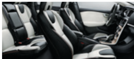
専用本革シート(チャコール/ブロンズ)(S10F) 助手席8ウェイパワーシート