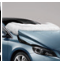
歩行者エアバッグ