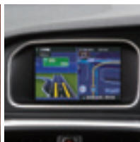
HDDナビゲーションシステム、VICIS3 12セグ地上デジタルTV (リモートコントロール付)