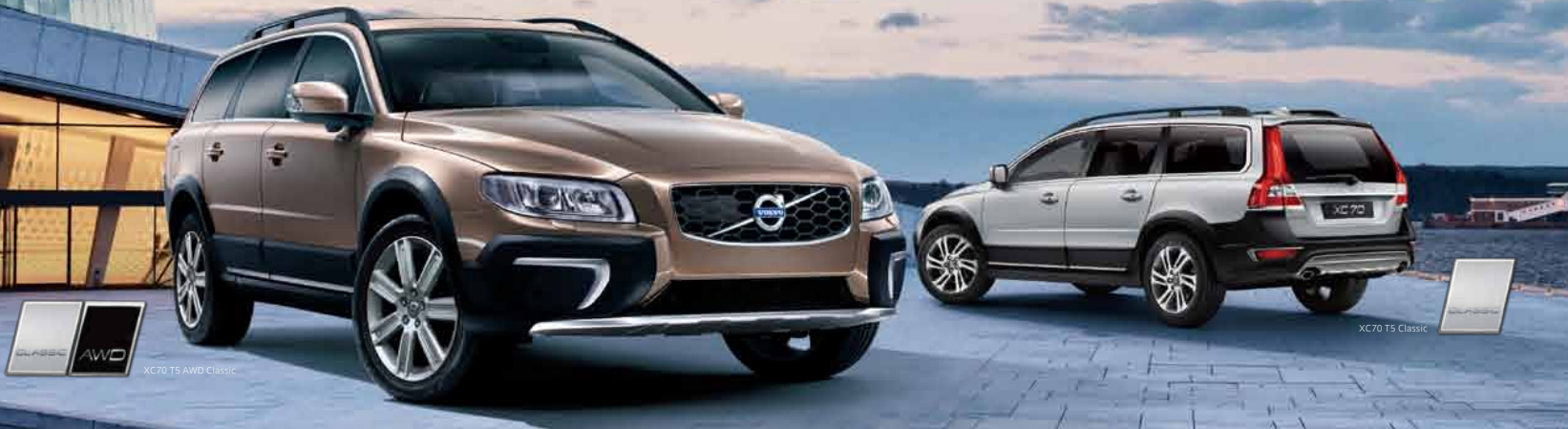
CLASSIC AWD XC70 T5 AWD Classic

ラグジュアリーなインテリアと堅牢なシャーシ、そして卓越した走破性を融合させた、まさに独創的なクルマ。スカンジナビアン・デザインの魅力を際立たせる厳選された装備を搭載して、XC70 Classic誕生。さらなる快適性と冒険への思いに応える、洗練されたクロスカントリーです。