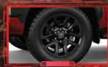
ចាសកង់ទំហំ 18 អ៊ីញ