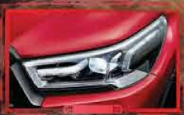
ចង្អៀង Bi-Beam LED Projector ភ្ជាប់ជាមួយអំពូល Daytime Running Light