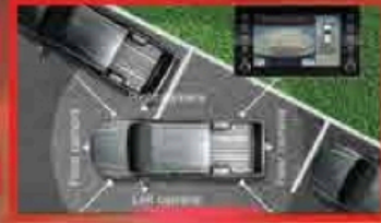
កាមេរ៉ា 360 ដឺក្រេ បង្ហាញប្រភពមួយចំរើមនូវ