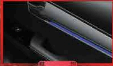
អំពូល LED លំអដណ្តូងទ្វារ