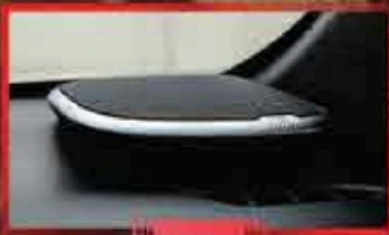
ឧបករណ៍បំពងសំឡេង JBL 9 គ្រាប់