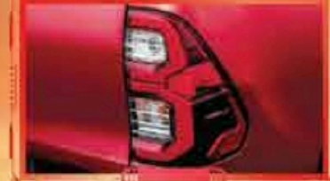
ចង្អៀងក្រោយរចនារូបរាងថ្មី ស្រស់ស្អាត