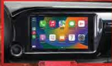
ប្រព័ន្ធកំណត់ Touch Screen 9អ៊ីញ អាចភ្ជាប់តភ្ជាប់ខ្សែ ជាមួយ Apple Carplay & Android Auto