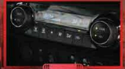
ប្រព័ន្ធគ្រប់គ្រងសីតុណ្ហភាពស្វ័យប្រវត្តិ (DUAL Zone)