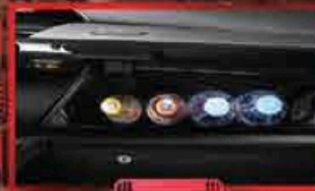
ប្រអប់សម្រាប់ដាក់កេសច្នៃ: (Cool Box)