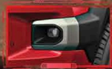
ចង្អៀងកាត់អំពូល LED រចនារូបរាងថ្មីកាន់តែទាន់សម័យ