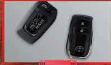
សោរឆ្នោត Smart Key