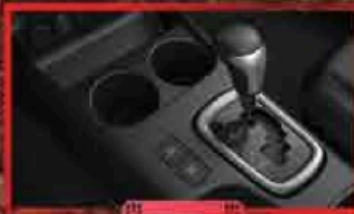
ប្រព័ន្ធពើករ ECO & PWD Mode និងប្រអប់លេខ ៩គុំមូតូ