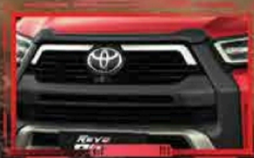
កាងមុខរចនាថ្មី (Front Bumper) ភ្ជាប់មុខងារ Multi-Meter Wave Radar និង Camera មួយគ្រាប់