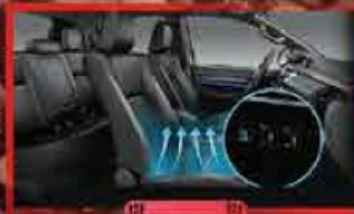
តៅវីស្បែក លេសម្រួលបាន ៨និរសដៅក្តាប់មុខងារ ខ្យល់ក្រចាក់