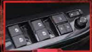
ប៊ូតុងបញ្ជាកញ្ចក់ទ្វារទាំង៤ និងមុខងារការពារភ្លៀប