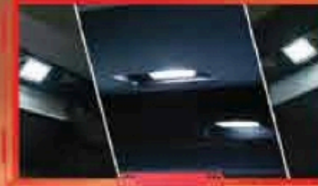
អំពូលបំភ្លឺ នៃបរិវេណផ្ទៃកាត់កាន់ LED 3 គ្រាប់