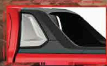
កាងលម្អផ្នែកខាងក្រោយ Sport Bar