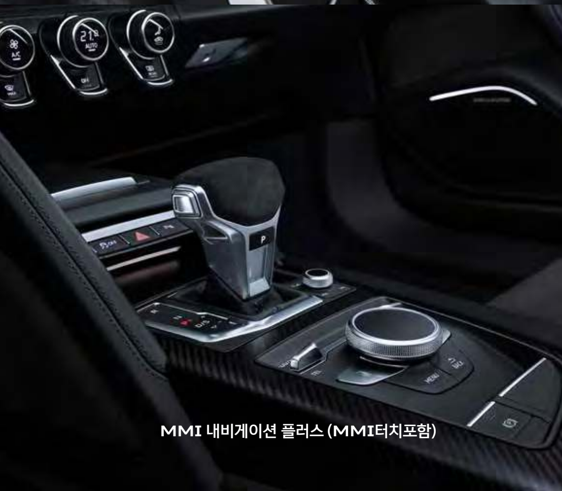
MMI 내비게이션 플러스 (MMI터치포함)

R8 퍼포먼스 다기능 스티어링 휠은 그립부의 타공 가죽마감으로 부드러운 그립감을 선사합니다. 스티어링 휠에 위치한 드라이브 셀렉트 버튼으로 운전 중 신속한 드라이브 모드 변경이 가능하며, 다기능 컨트롤러로 필요한 기능을 다양하게 제어할 수 있습니다.