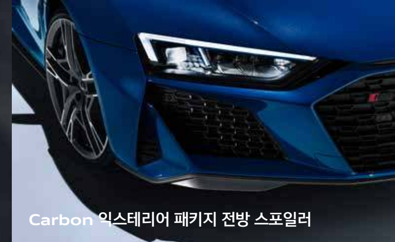
Carbon 익스테리어 패키지 전방 스포일러