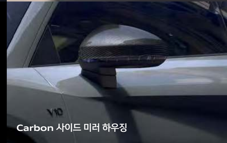
Carbon 사이드 미러 하우징