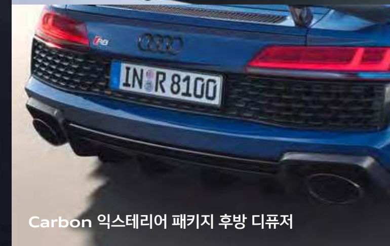
Carbon 익스테리어 패키지 후방 디퓨저