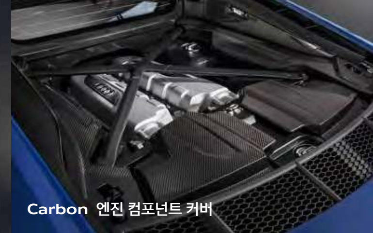
Carbon 엔진 컴포넌트 커버