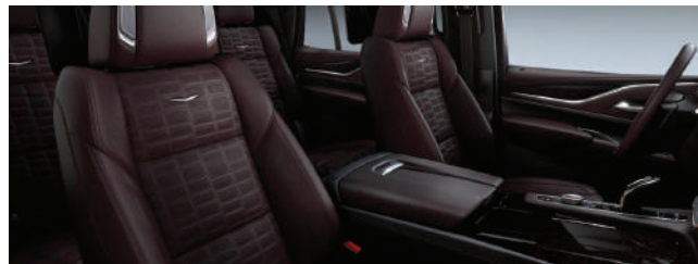
Full Semi-Aniline Leather Seats with Mondrian Quilting DARK AUBURN WITH JET BLACK ACCENTS (다크 오번 컬러) Bitter Lace wood trim