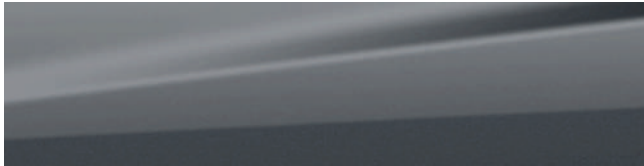
GALACTIC GRAY METALLIC