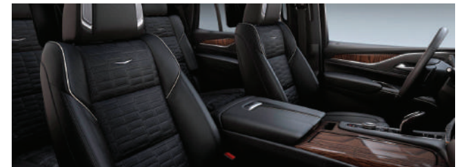
Full Semi-Aniline Leather Seats with Mondrian Quilting JET BLACK (제트 블랙 컬러) Natural Figured Ash wood trim