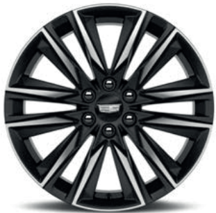
22" 12-SPOKE POLISHED ALLOY WITH DARK ANDROID FINISH