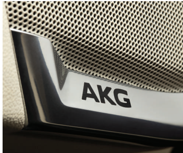
※ 상기 이미지는 실제 국내 적용 사양과 상이할 수 있습니다.

월드클래스 오디오 메이커, AKG의 독점 기술로 탄생. 총 36개의 스피커로 깊은 감동을 전하는 프리미엄 사운드를 즐기세요.