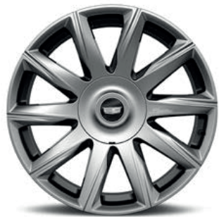
22" 10-SPOKE POLISHED ALLOY WITH DARK ANDROID FINISH & LASER ETCH