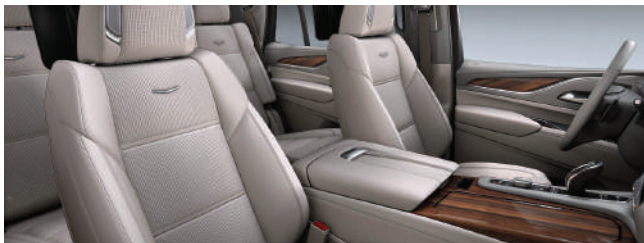
Full Semi-Aniline Leather Seats with Mini-Chevron Perforated inserts WHISPER BEIGE WITH GIDEON ACCENTS (위스퍼 베이지 컬러) Linear Marquetry wood trim