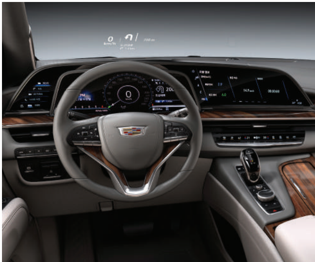
※ 상기 이미지는 실제 국내 적용 사양과 상이할 수 있습니다.

38" 커브드 디스플레이는 4K TV의 두 배가 넘는 화소로, 다양한 정보를 한눈에 고화질로 담아냅니다. 업계 최초로 적용된 독보적인 기술력과 품격을 만나보세요.