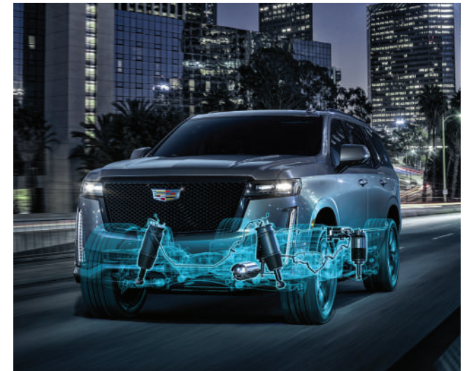
※ 상기 이미지는 실제 국내 적용 사양과 상이할 수 있습니다.

에어 라이드 어댑티브 서스펜션은, 최첨단 전자 제어식 에어 스프링으로 진동을 흡수하여 불규칙한 도로 상태에서도 안정적이고 부드러운 드라이빙 경험을 선사합니다.