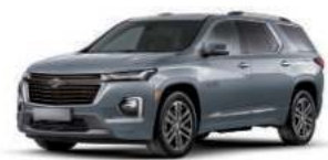
NEW 스틸링 그레이 (GXD)