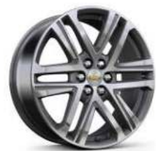
20인치 루나 그레이 머신드 알로이 휠 (High Country 전용)