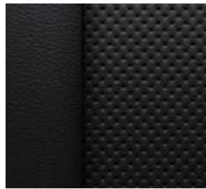
젯 블랙 & 차이 엑센트 천공 천연가죽 시트 (Premier, Redline 전용)