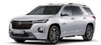
아발론 화이트 펄 (G1W)