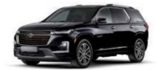
미드나이트 블랙 (GB8)