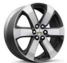
20인치 테크니컬 그레이 포켓 머신드 알로이 휠 (LT Leather Premium 전용)