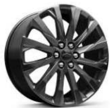
20인치 다크 안드로이드 페인티드 알로이 휠 (RS 전용)