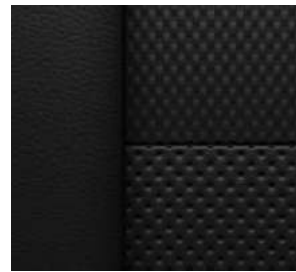
젯 블랙 & 레드 포인트 천연가죽 시트 (RS 전용)