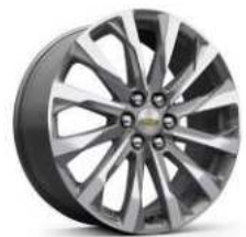
20인치 아전트 메탈릭 머신드 알로이 휠 (Premier 전용)