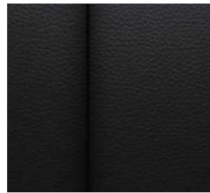
젯 블랙 천연가죽 시트 (LT Leather Premium 전용)