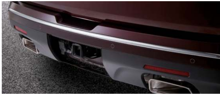
히든 순정 트레일러 히치 리시버 & 미국식 7핀 커넥터 트레일러 히치 가이드 라인 히치 뷰 모니터링

트레일러 연결부를 zoom하여 센터 디스플레이에 보여주는 히치 뷰 모니터링 기능(탑 뷰)은 트레일러 연결 시 쉬운 체결을 도와주며, 주행 중 차량 히치 리시버와 트레일러 연결부의 체결 상황을 실시간으로 볼 수 있습니다.