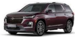
블랙 체리 (GLR)