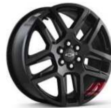
20인치 레드라인 시그니처 블랙 알로이 휠 (Redline 전용)