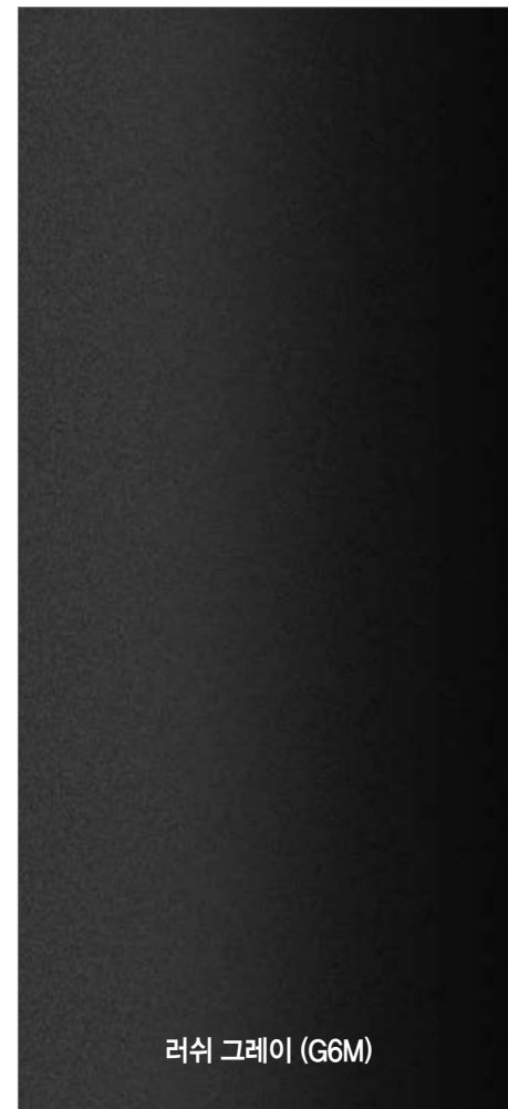
러쉬 그레이 (G6M)