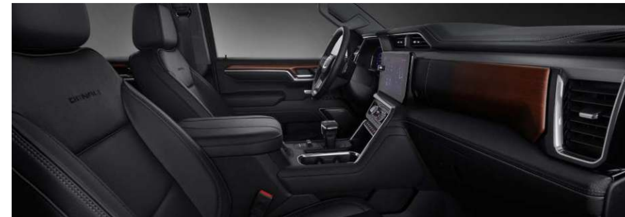
젯 블랙 인테리어