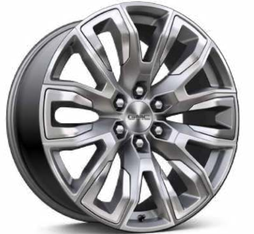
22인치 폴리쉬드 투톤 알로이 휠