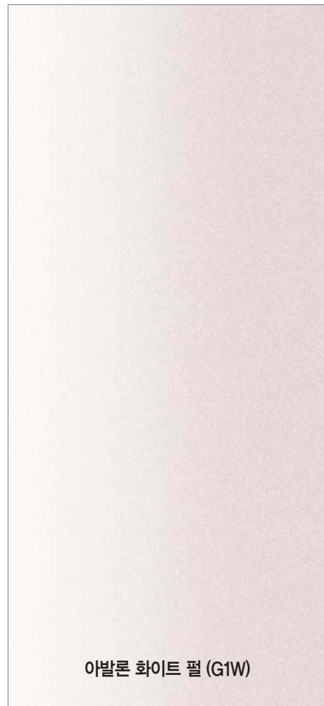
아발론 화이트 필 (G1W)