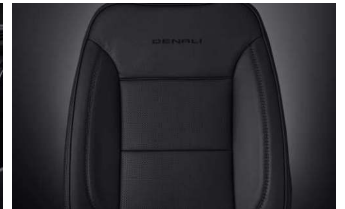
젯 블랙 천공 천연 가죽 시트