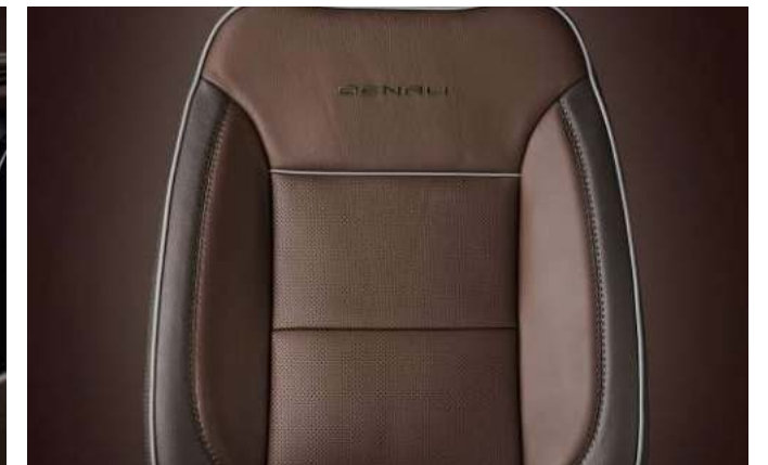
브라운스톤 천공 천연 가죽 시트

※ Denali 트림 선택 시, 익스테리어 색상은 아발론 화이트 필(G1W), 텍시도 블랙(GBA) 중 선택 가능. 인테리어는 젯 블랙 인테리어 자동 적용. (브라운스톤 인테리어 선택 불가)