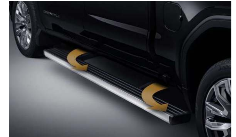
적재함 전개 위치