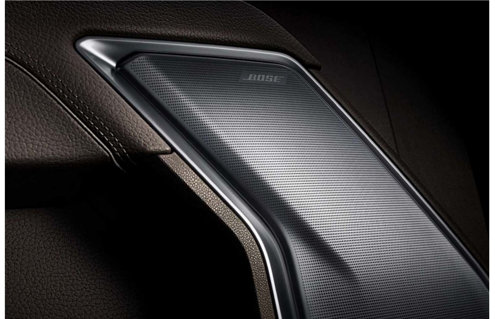
프리미엄 BOSE® 사운드 (Richbass™ 우퍼/앰프/7스피커)는 실내 어느 좌석에서도 최상의 음질을 제공합니다.