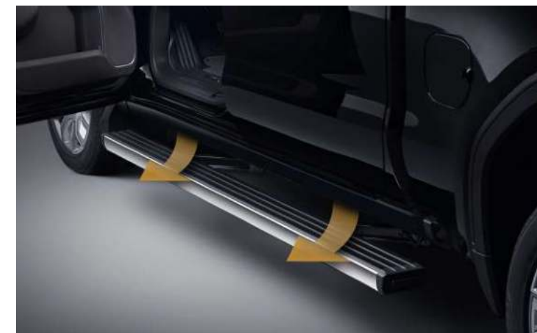
일반 전개 위치

3 포지션 멀티프로 파워 스텝은 편리한 탑승과 적재함에서의 작업이 모두 용이하도록 설계되었습니다. 승하차시 작동하는 전동 사이드 스텝의 한계를 뛰어 넘어 스텝 후측면 킥 스위치를 통해 적재함까지 이동하는 기술로 GMC 시에라만의 차별화된 편리함을 느끼실 수 있습니다.