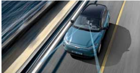
차로 이탈방지 보조 / 차로 이탈 경고 (전 트림 기본 적용) 전방 감지 카메라를 이용해 차선을 인식하고 방향지시등 조작 없이 차량이 차선을 이탈하려 할 경우, 스티어링 휠을 제어 또는 경고하여 차로 이탈을 방지해줍니다.