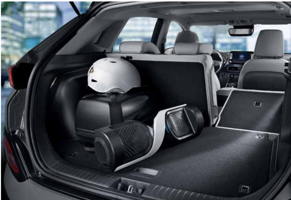
6:4 폴딩 시트