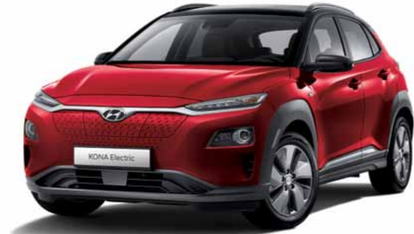
프리미엄 풀옵선 (필스레드 / 블랙 투톤 컬러 루프)