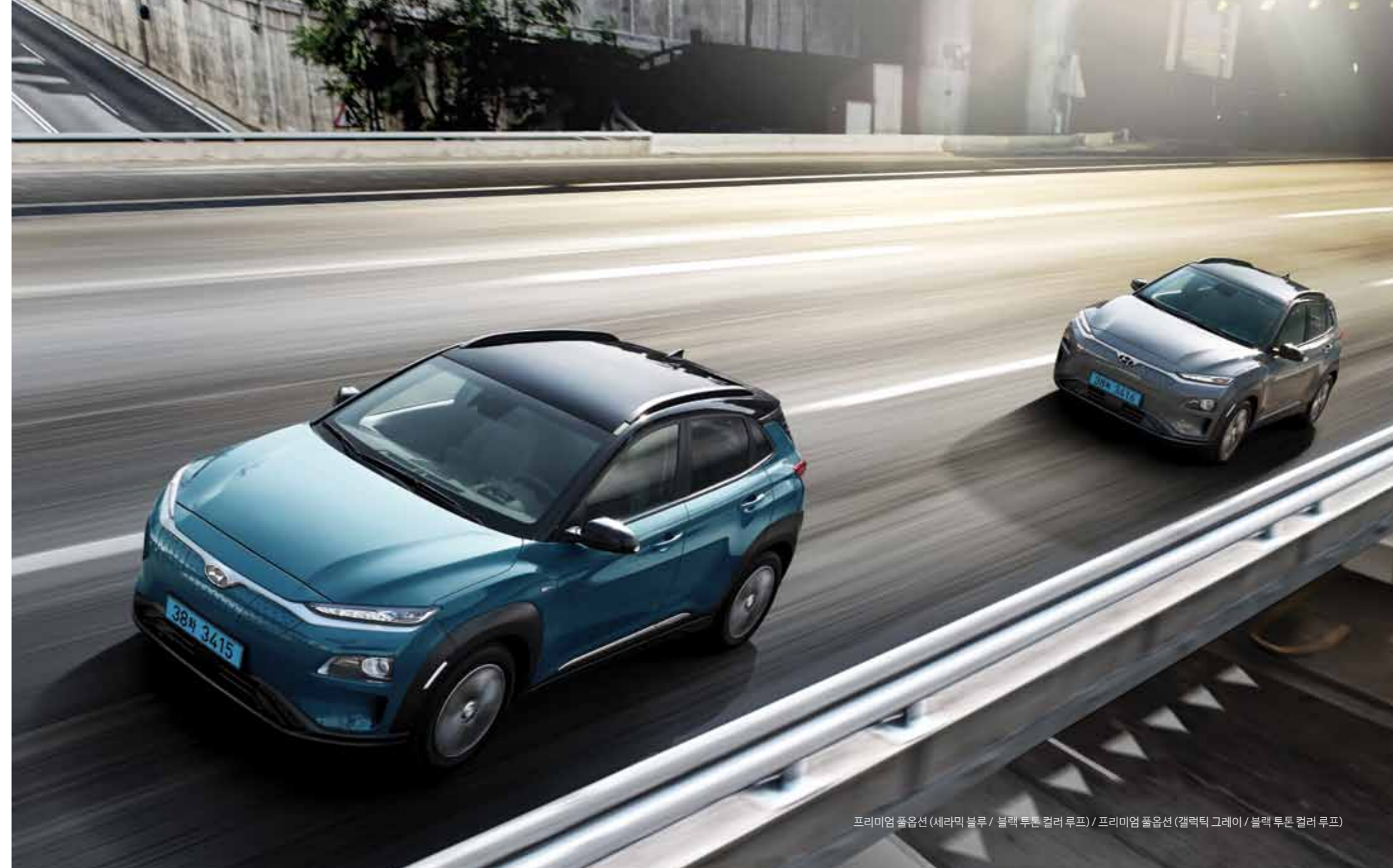
프리미엄 풀옵션 (세라믹 블루 / 블랙 투톤 컬러 루프) / 프리미엄 풀옵션 (갤럭시 그레이 / 블랙 투톤 컬러 루프)