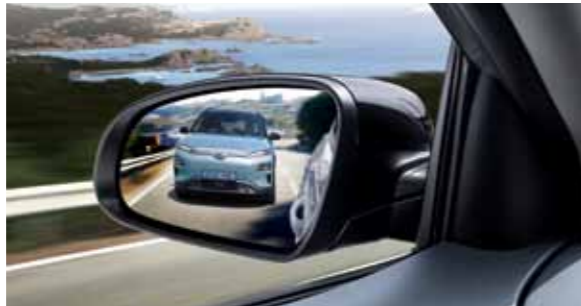
후측방 충돌 경고 (현대 스마트센스 패키지 옵션 선택 필요) 아웃사이드 미러로 확인할 수 없는 사각지대에 있는 차량 또는 옆 차선에서 고속으로 접근하는 차량을 인지하여 운전자에게 경고를 줌으로써 차선변경 시 충돌사고를 예방합니다.