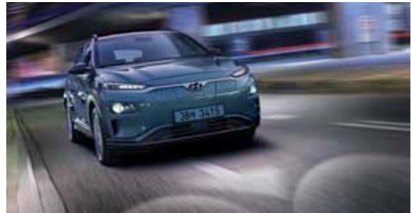
하이빔 보조 (프리미엄 트림 기본 사양) 야간에 상향등을 켜고 주행하는 중 맞은 편에 차량이 있을 경우 헤드램프를 자동으로 하향등으로 전환하여 짙은 상향등 조작에 따른 불편함을 줄여주고 운전차량 및 상대차량이 안전하게 주행할 수 있도록 도와줍니다.