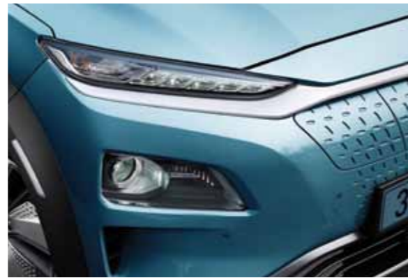
17인치 알로이 휠 LED 주간주행등 (DRL, 포지셔닝 기능 포함)