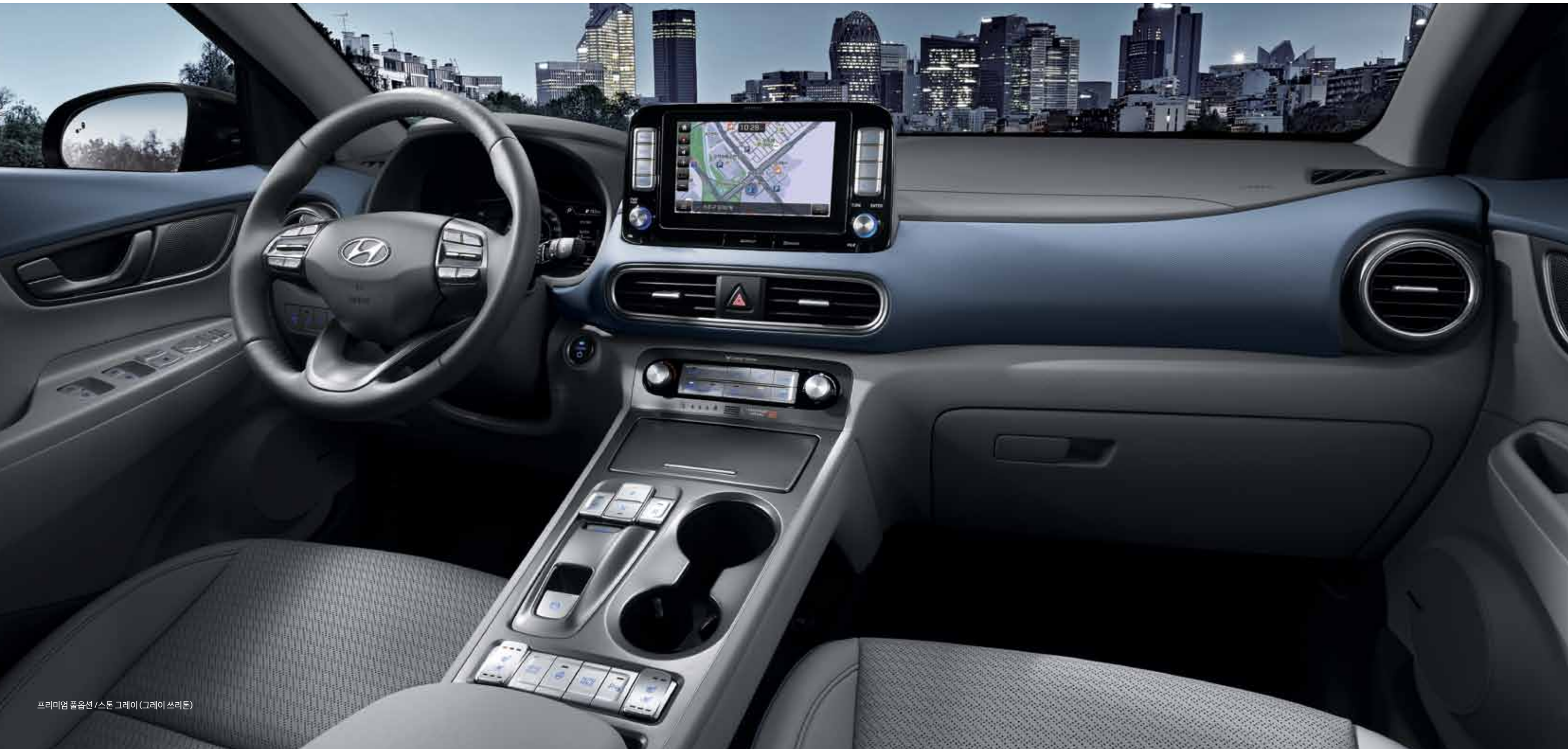
프리미엄 풀옵션 / 스톤 그레이 (그레이 쓰리톤)