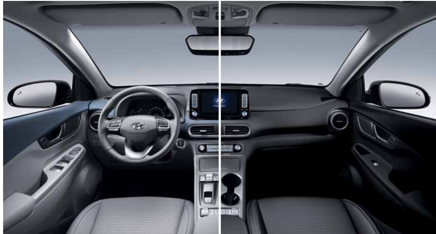
스톤 그레이 (그레이 쓰리톤)