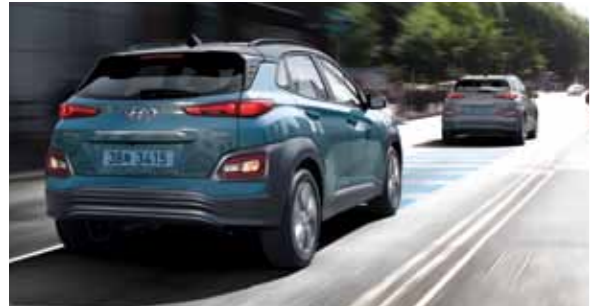
전방 충돌방지 보조 / 전방 충돌 경고 (전 트림 기본 적용) 선형 차량과의 충돌 위험이 감지될 경우 운전자에게 이를 경고하고, 필요 시 브레이크 작동을 보조합니다.

운전자를 배려하는 지능형 안전 기술 'Hyundai SmartSense'로 안전하고도 편안한 주행을 경험할 수 있습니다.