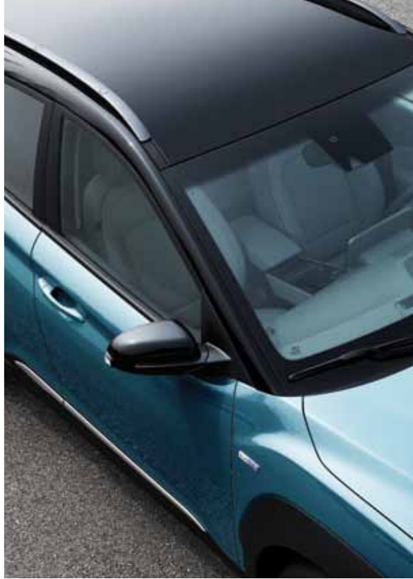
블랙 투톤 컬러 루프