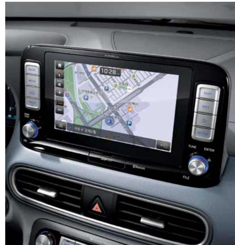
심리스 8인치 내비게이션