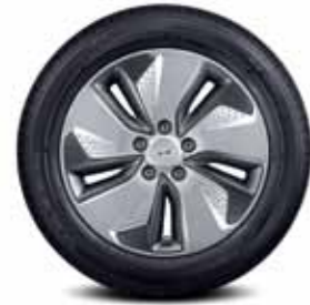
17인치 알로이 휠 & 타이어

LED 헤드램프 (스태틱 벤딩 기능) 전동식 파킹 브레이크 버튼시동 & 스마트키 시스템