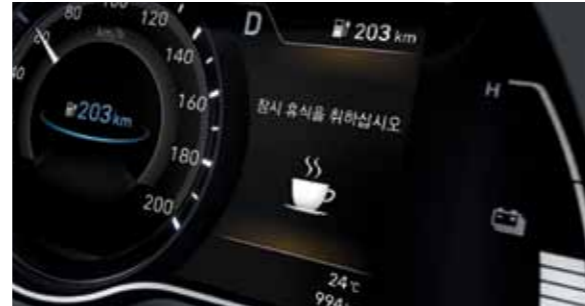
운전자 주의 경고 (전 트림 기본 적용) 운전 상태를 5단계로 표시하며, 운전자의 피로나 부주의한 운전 패턴으로 판단되면 팝업 메시지와 경고음을 통해 휴식을 유도합니다.