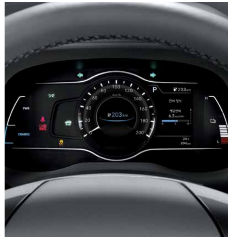
버추얼 클러스터 (7인치 컬러 LCD)

SUV 특유의 실용성과 함께 헤드업 디스플레이, 버추얼 클러스터, 8인치 내비게이션을 통해 다양한 정보를 직관적으로 제공합니다.