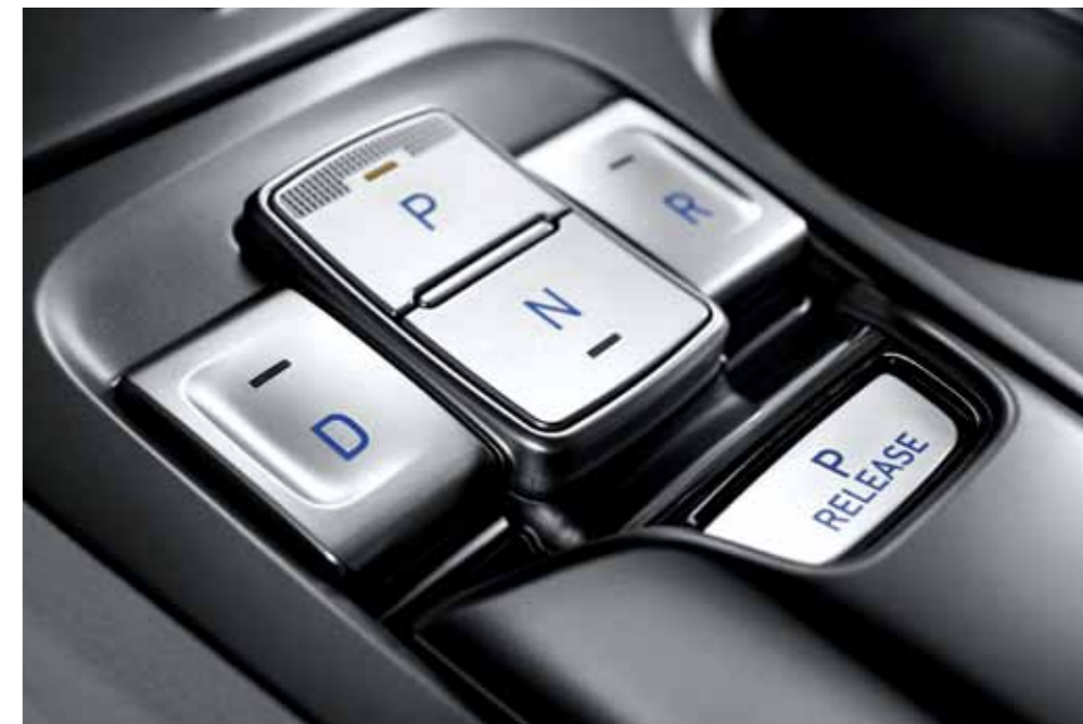
전자식 변속 버튼 (SBW)

브릿지 타입 센터 콘솔을 적용하여 미래지향적 이미지를 제공하며 전자식 변속 버튼을 통해 편리하고 하이테크한 인테리어 공간을 선사합니다.