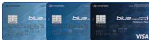
HYUNDAI BLUE members 신용-Platinum-Platinum Plus카드(신용)

카드 이용금액 연체 시 23.5~27.9%의 연체이자율 적용(회원별, 연체 기간별 차등 적용) 신용카드 남용은 가계 경제에 위험이 됩니다. 여신금융협회 심의필 제 2017 - C1g - 05955호(2017.04.21)