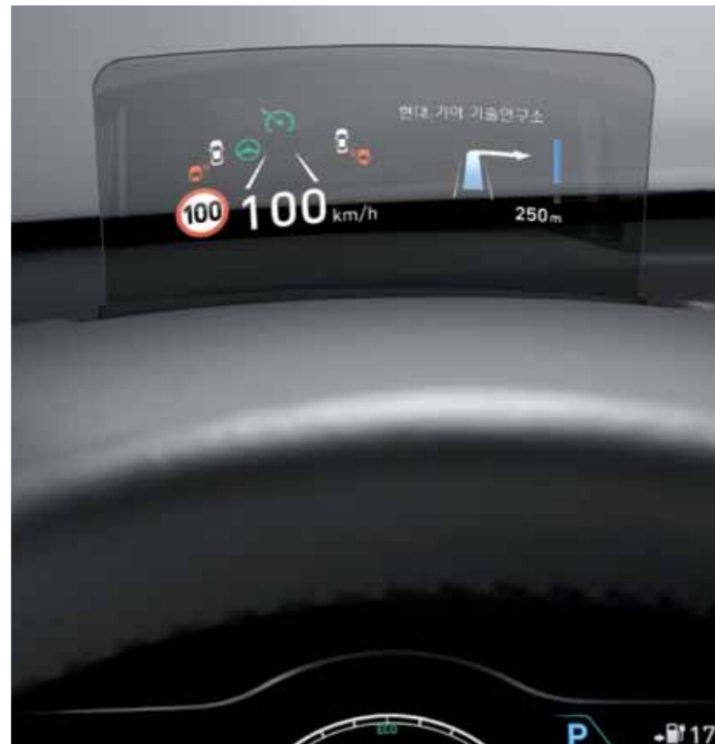
헤드업 디스플레이 (컴바이너 타입)