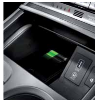
KRELL 프리미엄 사운드 시스템 스마트폰 무선충전 시스템