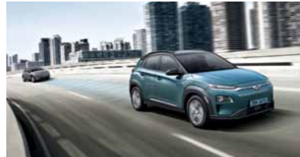
스마트 크루즈 컨트롤 (Stop & Go 포함 / 현대 스마트센스 패키지 옵션 선택 필요) 운전자가 설정한 속도 및 앞차와의 거리를 유지하며, 정차한 후 3초 이내에 앞차가 출발하면 자동으로 재출발하여 속도와 거리를 제어합니다. 3초 이후 앞차가 출발하면 전방 차량 출발 알림음과 메시지가 표시됩니다.