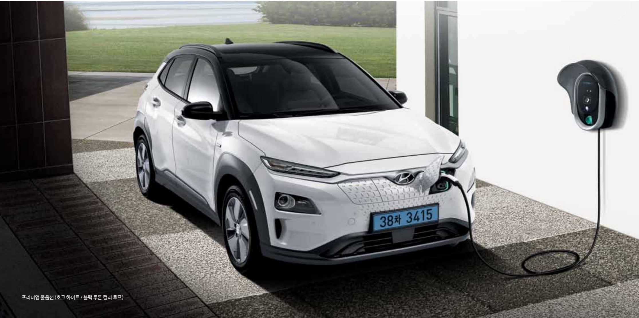
프리미엄 풀옵션 (초크 화이트 / 블랙 투톤 컬러 루프)

코나 일렉트릭에 적용된 고성능 모터와 대용량 배터리로 당신의 드라이빙은 더욱 경쾌해집니다. 전기자동차가 선사하는 운전의 즐거움을 지금 누려보세요.