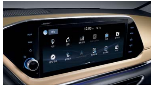
프리미엄 패밀리 공통