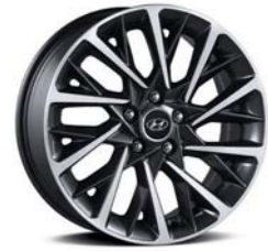
18인치 알로이 휠