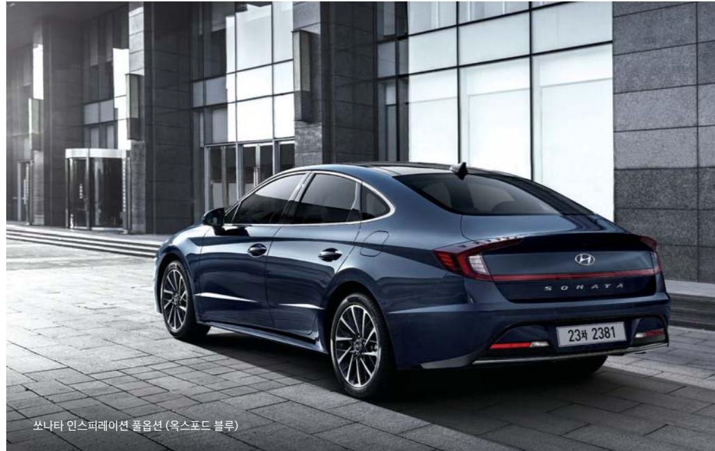
쏘나타 인스퍼레이션 풀옵션 (옥스포드 블루)

트렌디한 쿠페형 스타일의 감각적이고 역동적인 디자인, 그리고 하나의 선으로 완성된 듯 자연스럽게 이어지는 실루엣까지. 지금껏 경험해 보지 못한 쏘나타의 비전을 담았습니다.