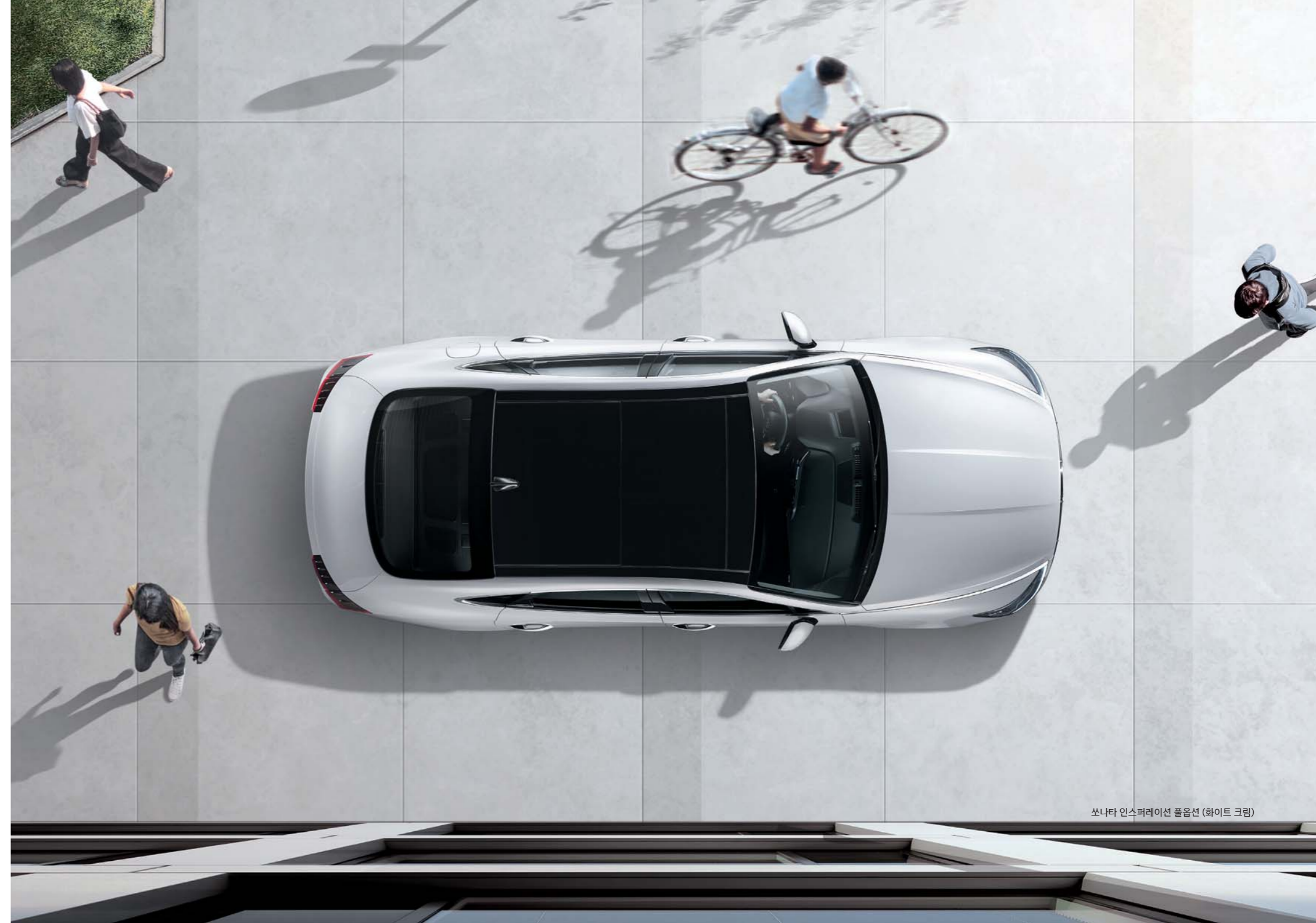
쏘나타 인스퍼레이션 풀옵션 (화이트 크림)

측면 에어백을 비롯해 운전석 무릎 에어백까지 총 9개의 에어백이 충돌로부터 탑승자를 보호합니다. 특히 운전석과 1열 동승석은 충돌 상황에 따라 저압 또는 고압으로 전개되며, 1열 동승자를 감지하여 전개 여부를 결정하는 어드밴스드 에어백이 적용되었습니다.