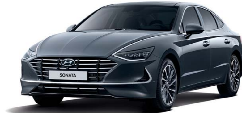
인스퍼레이션 (녹턴 그레이)