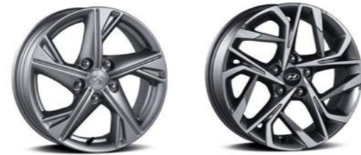
16인치 알루미늄 휠