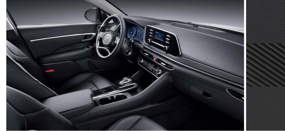
블랙 원톤 인조가죽 시트 / 니트 내장재, 천연가죽 시트 / 멜란지 니트 내장재