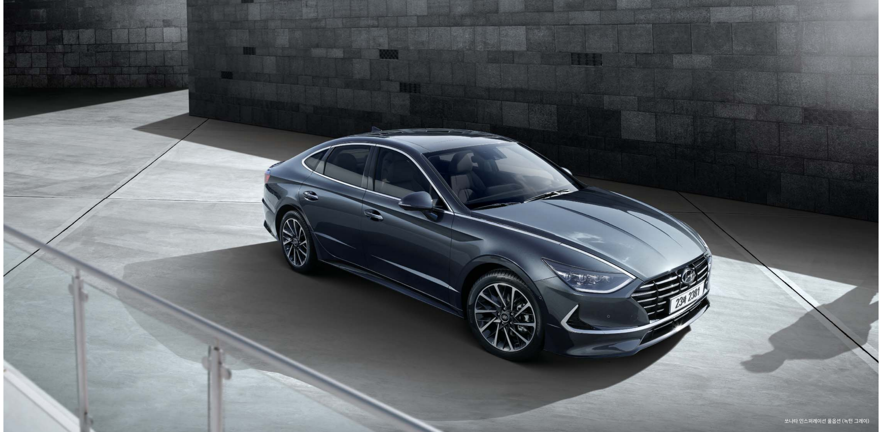
쏘나타 인스퍼레이션 풀옵션 (녹턴 그레이)