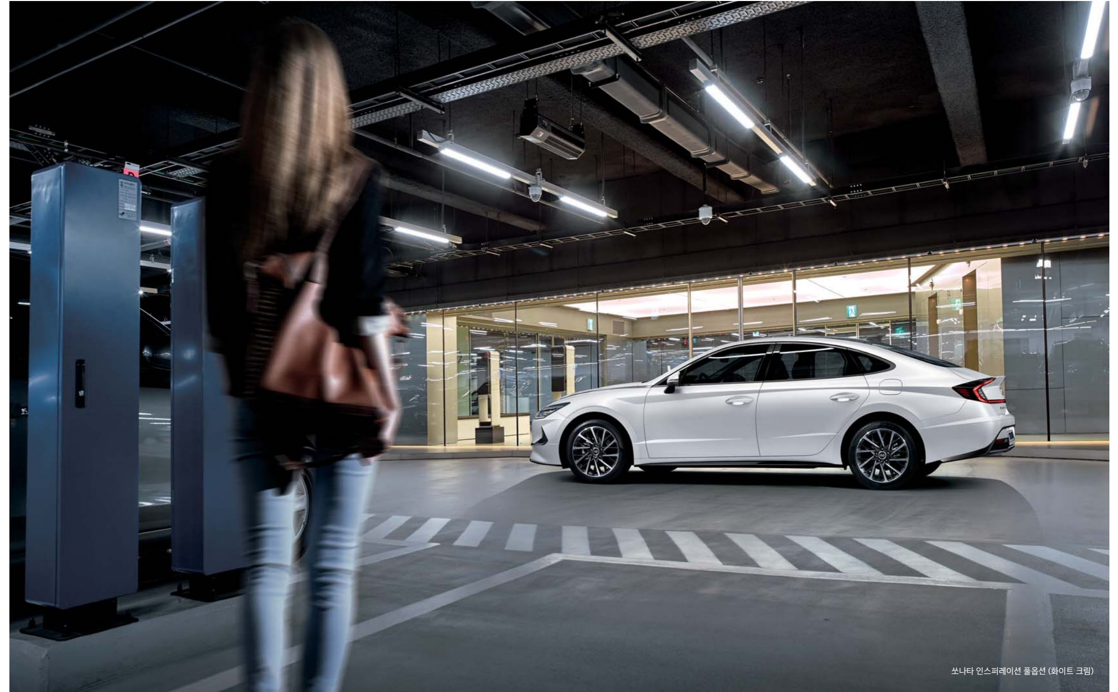
쏘나타 인스퍼레이션 풀옵션 (화이트 크림)