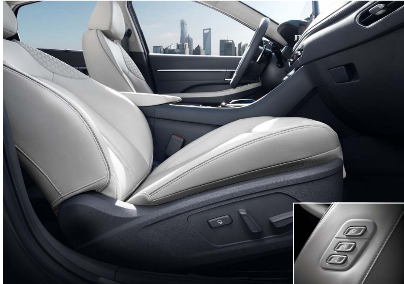
동승석 릴렉션 컴포트 시트 동급 최초로 동승석 릴렉션 컴포트 시트를 적용해 동승자의 무중력 중립 자세를 도와주어 차 안에서도 편안한 휴식을 선사합니다. 쏘나타의 실내를 가득 채운 모든 디테일에는 고급스러운 감성과 동승자에 대한 배려가 깃들여 있습니다.

* 동승석 릴렉션 컴포트 시트는 안전을 위하여 주·정차 시 사용을 권장합니다.