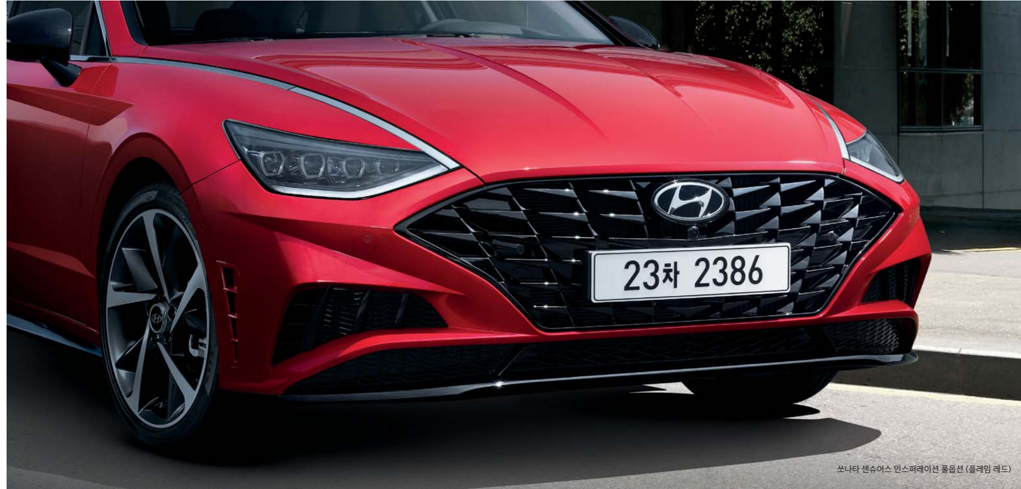
쏘나타 센슈어스 인스퍼레이션 풀옵션 (플레임 레드)

전후면 범퍼 디자인에 쏘나타 센슈어스만의 아이덴티티를 구현하였습니다. 특히 보석 원석을 기하학적 형태로 깎아낸 듯한 형상의 파라메트릭 주얼 패턴 그릴에 블랙 유광 소재를 더해 더욱 강렬한 이미지를 연출합니다.