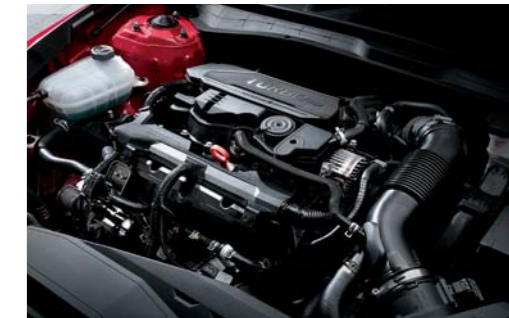
쏘나타 센슈어스_스마트스트림 가솔린 1.6 터보 엔진

160 최고출력 PS/6,500rpm 20 최대토크 kg-m/4,800rpm