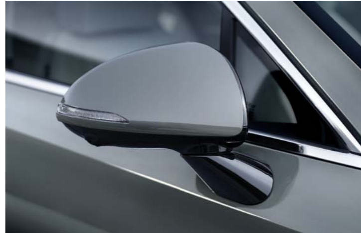
프로젝션 타입 Full LED 헤드램프 / 크롬 라디에이터 그릴 아웃사이드 미러 (LED 리피터, 열선, 전동조절, 전동접이)