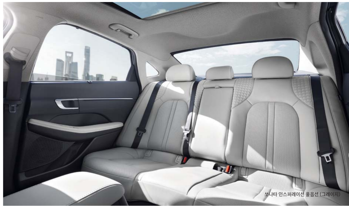
쏘나타 인스퍼레이션 풀옵션 (그레이지)

실내를 가득 채운 모든 디테일에는 혁신적인 기술과 정성 어린 배려가 공존하고 있습니다. 운전자와 동승자를 위해 효율적으로 설계된 실내공간은 새로움을 넘어 놀라움을 선사해줍니다.