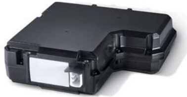
빌트인 캠 보조배터리

한층 더 업그레이드된 기능과 감각적인 스타일을 원한다면 TUUX에 주목하십시오. 곳곳에 장착되는 특별한 아이템들로 편의와 감성을 더해 나만의 개성을 연출할 수 있습니다.