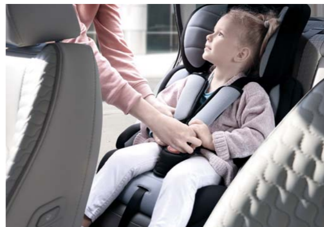
서라운드 뷰 모니터 고화질 카메라가 전·후·측면의 사각지대를 보여주어 운전자가 안전하게 주차할 수 있습니다. 후석 승객 알림 차량 뒷문의 개폐 여부로 후석 승객의 유무를 판단한 뒤, 운전자가 주행 후 시동을 끄고 운전석 도어를 열 경우 클러스터 경고 메시지 및 경고음을 통해 1차적으로 운전자가 후석을 확인하도록 합니다.