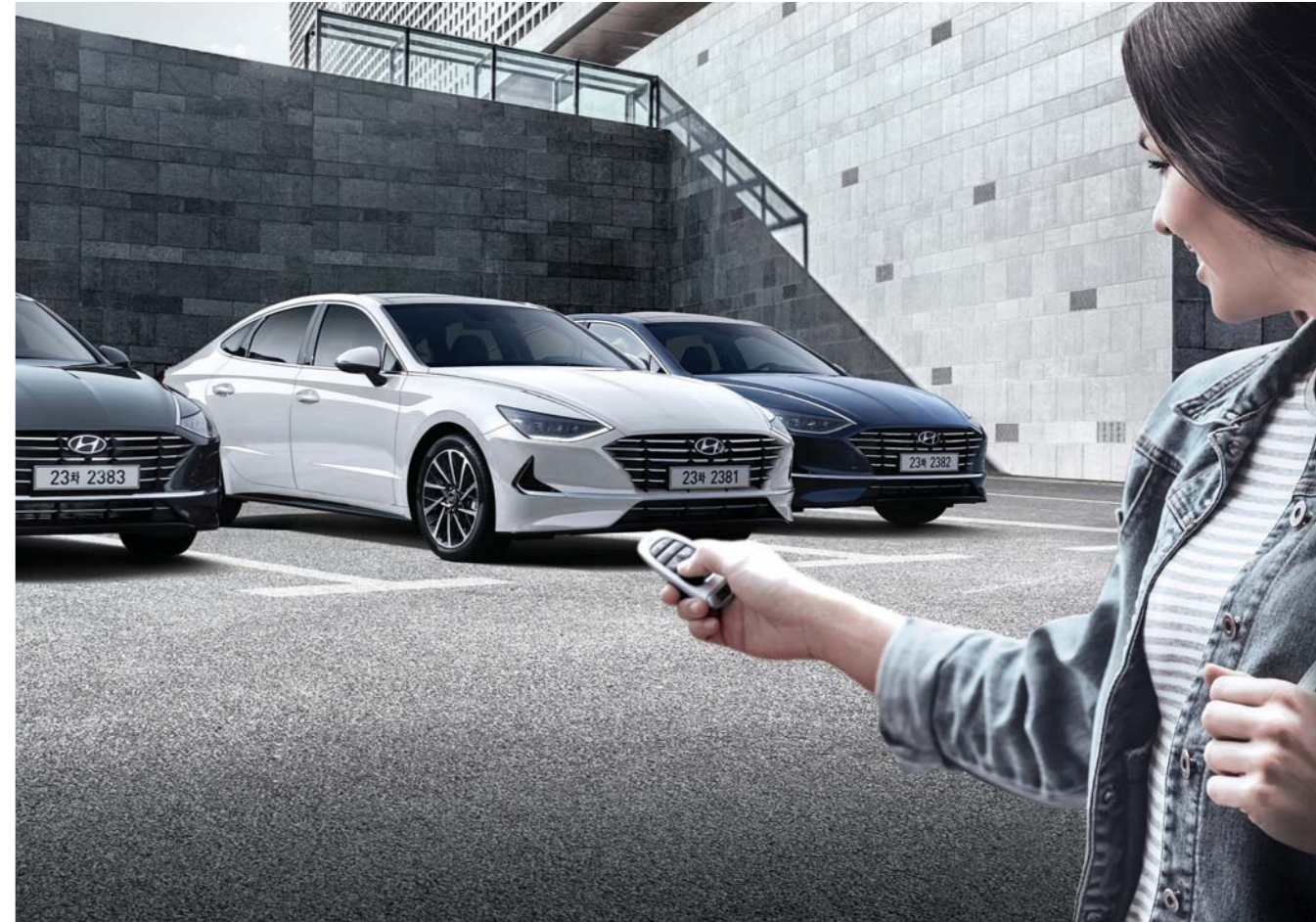
원격 스마트 주차 보조 운전자 및 탑승자의 승하차가 어려운 좁은 주차공간에서 원활한 주차 / 출차를 도와주는 기술로, 운전자가 하차한 상태에서 스마트키를 통해 차량의 원격 시동은 물론 전 / 후진을 제어해 편리하게 주차할 수 있도록 보조해줍니다.