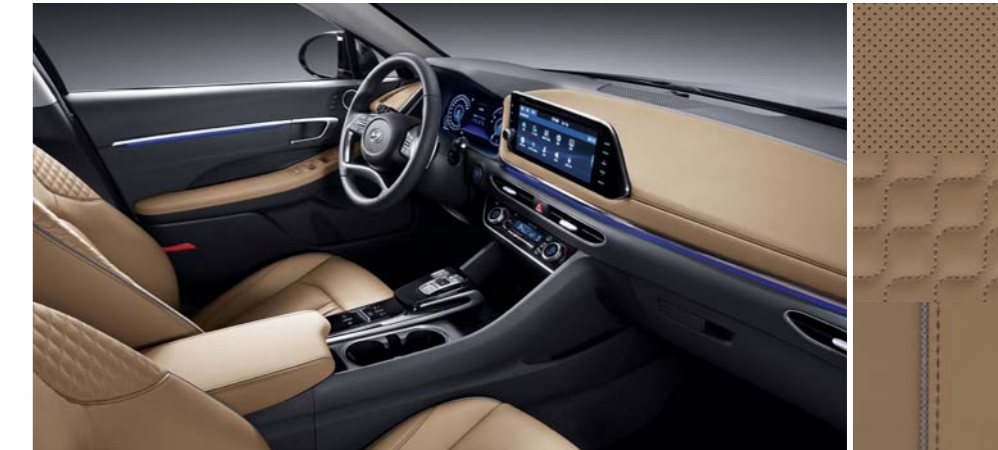
카멜 나파가죽 시트 / 멜란지 니트 내장재