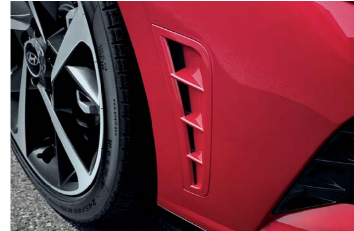
센슈어스 전용 블랙 아웃사이드 미러 센슈어스 전용 에어덕트