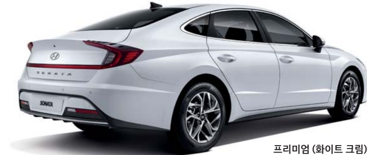
프리미엄 (화이트 크림)