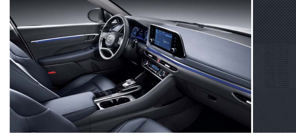
네이비 천연가죽 시트 / 멜란지 니트 내장재