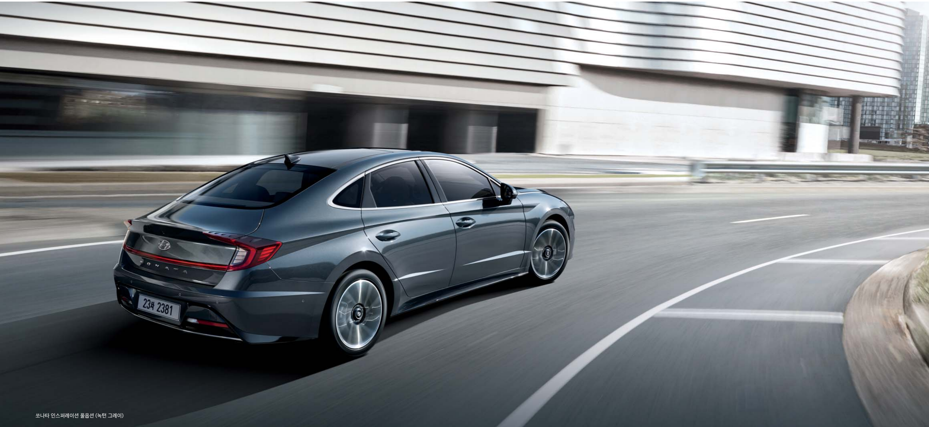
쏘나타 인스퍼레이션 풀옵션 (녹턴 그레이)