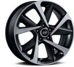
19인치 알로이 휠 (센서리스 전용)