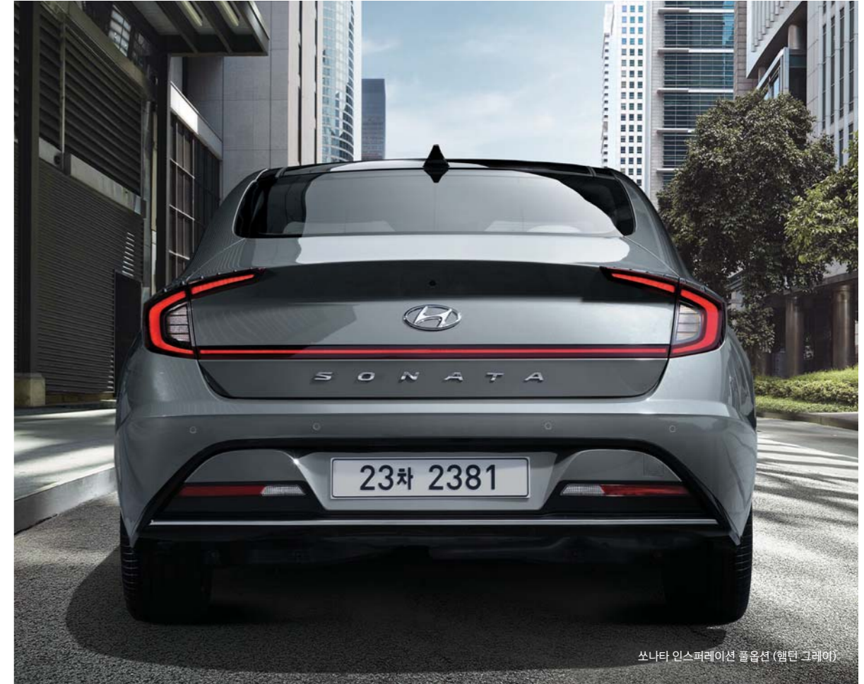
쏘나타 인스퍼레이션 풀옵션 (헬던 그레이)