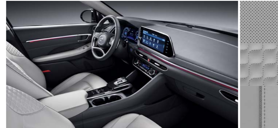
그레이지 나파가죽 시트 / 멜란지 니트 내장재