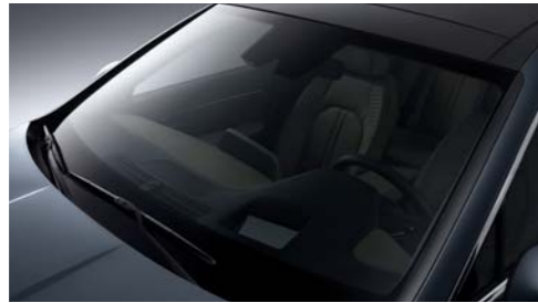
프리미엄 밀레니얼 이상