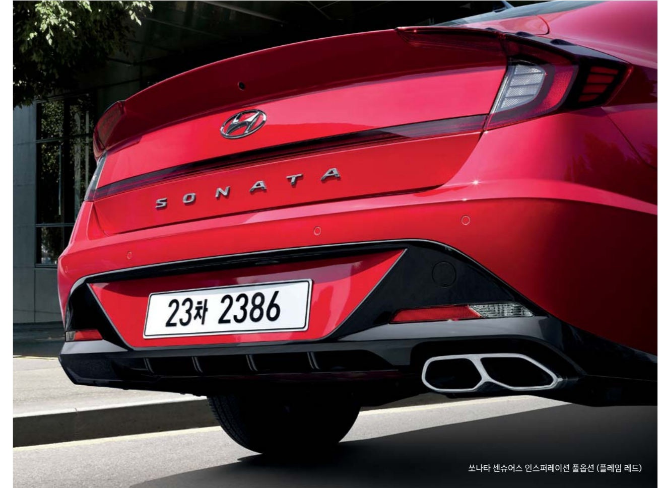
쏘나타 센슈어스 인스퍼레이션 풀옵션 (플레임 레드)