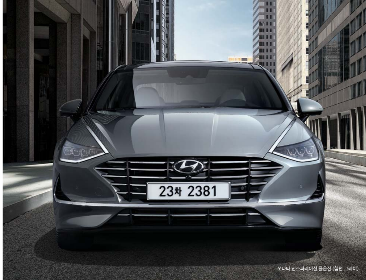
쏘나타 인스퍼레이션 풀옵션 (헬던 그레이)

와이드하고 볼륨감 넘치는 전면부 디자인에 미래지향적인 그라데이션 히든 라이트를 적용해, 날쌔면서도 우아한 모습을 갖췄습니다. 특히 입체감이 돋보이는 LED 리어콤비램프 디자인이 역동적인 조형미를 완성해줍니다.