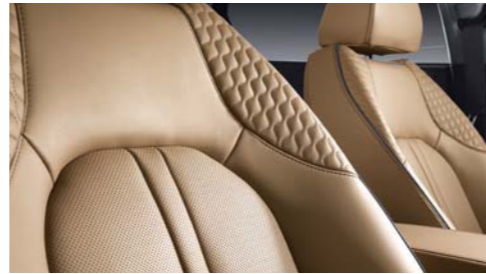
프리미엄 패밀리 공통