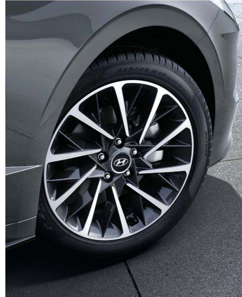
18인치 알로이 휠 & 피렐리 타이어