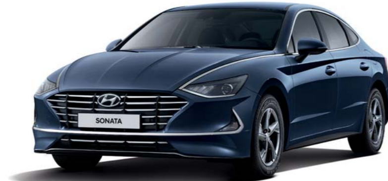
스마트 (옥스포드 블루)