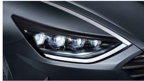
프로젝션 타입 Full LED 헤드램프 / LED 주간주행등 헤드업 디스플레이