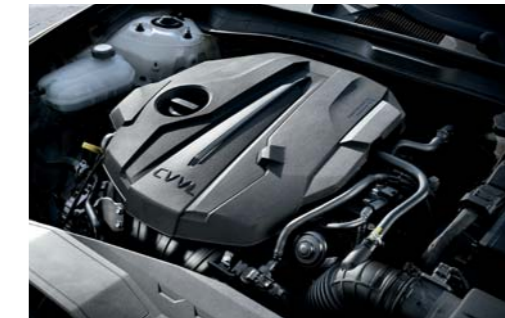
쏘나타_스마트스트림 가솔린 2.0 엔진

차세대 스마트스트림 엔진과 3세대 플랫폼을 탑재하여 효율성 향상과 동시에 안정감 있으면서도 다이내믹한 주행성능을 구현하였습니다.