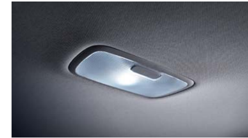
룸 램프 러기지 램프