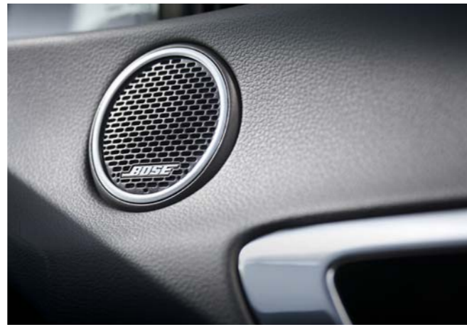
블루투스 멀티커넥션 블루투스 기기 두 개를 동시에 연결할 수 있어 운전자와 동승자가 상황에 따라 자유롭게 선택할 수 있도록 편의성을 높였습니다.