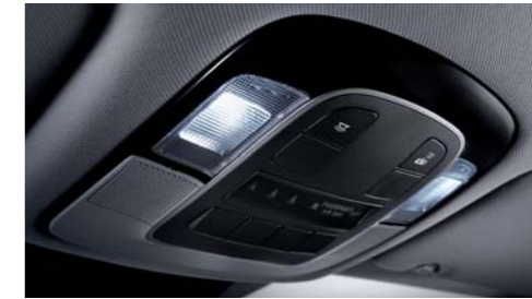
오버헤드콘솔 램프 선바이저 램프