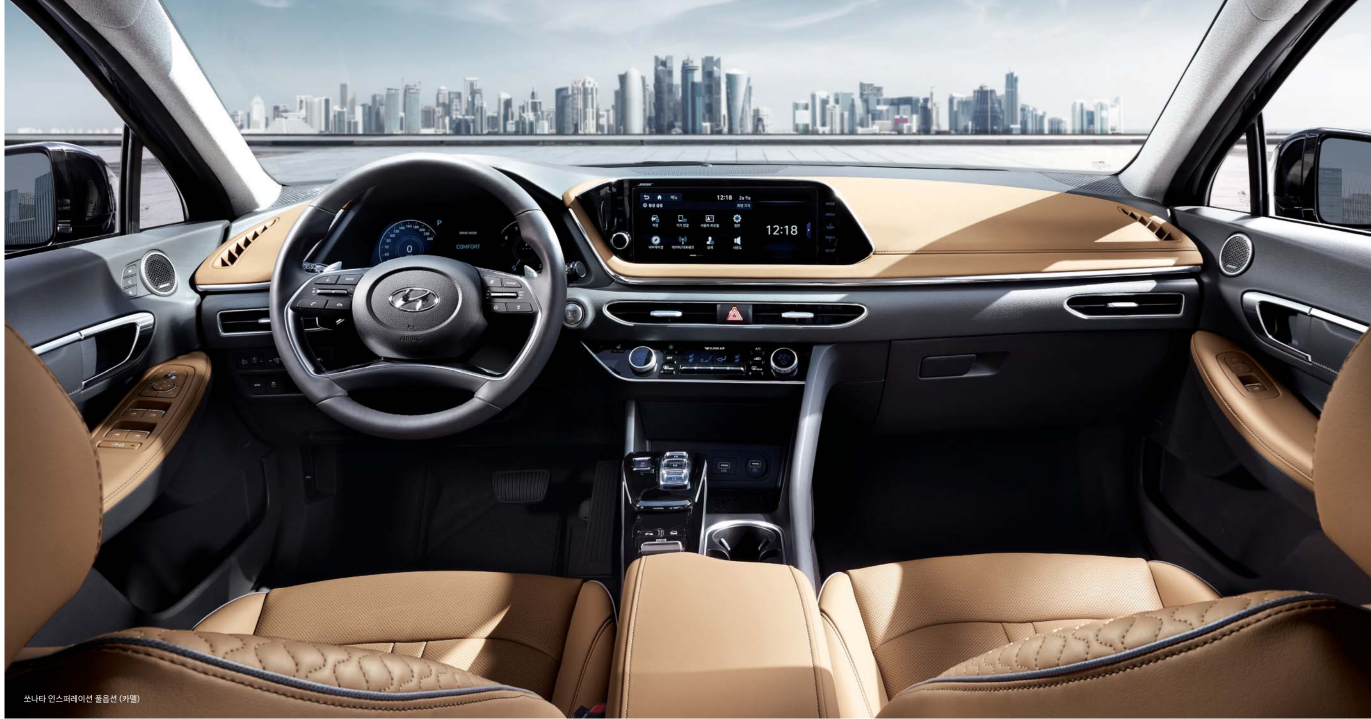
쏘나타 인스퍼레이션 풀옵션 (카멜)