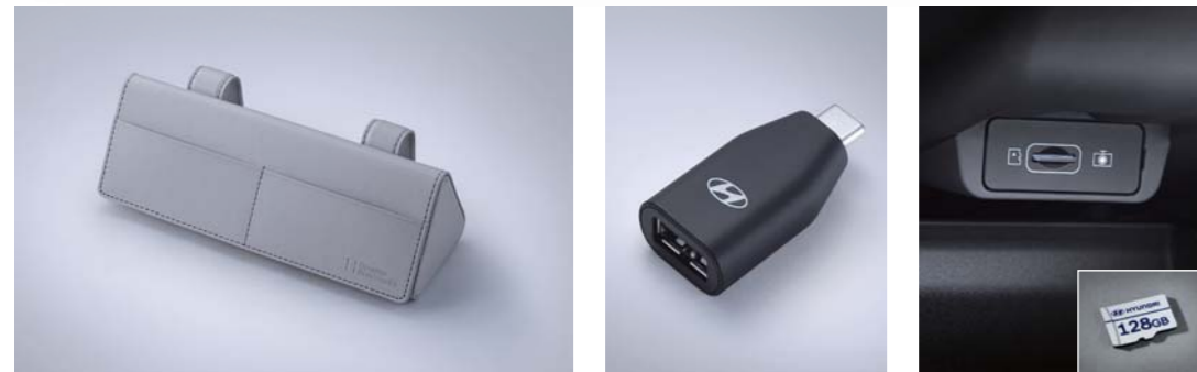
선바이저 선글라스 케이스