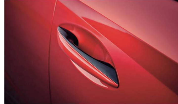
블랙 투톤 아웃사이드 도어 핸들 리어 스포일러