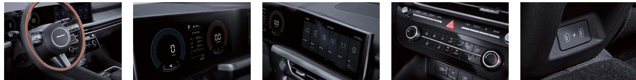
심리스 호라이즌 램프, Full LED 헤드램프(MFR타입) 가죽 스티어링 휠(열선포함) 펜더 LED 방향지시등 클러스터(4.2인치 컬러 LCD) LED 리어컴비램프 12.3인치 디스플레이 세이프티 파워 윈도우(전좌석) 매뉴얼 에어컨 이중접합 차음유리(윈드실드, 1열도어) C타입 USB 포트(1열 2개, 2열 2개)