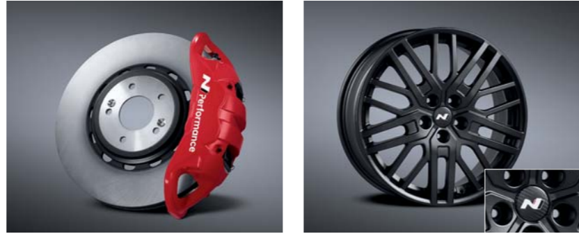
모노블록 4P 캘리퍼 & 하이브리드 디스크 & 로우 스틸 패드