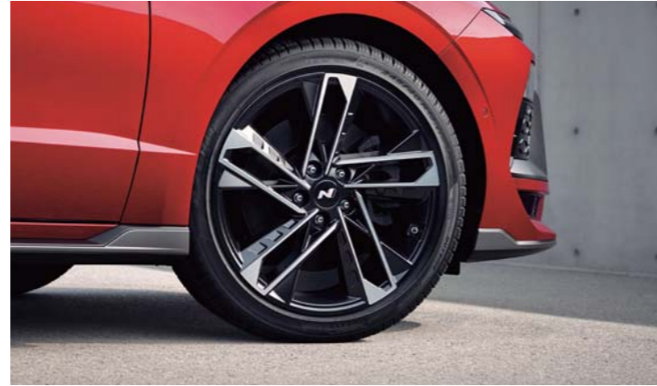
19인치 알로이 휠 & 피렐리 타이어, N 휠캡 사이드 실 몰딩