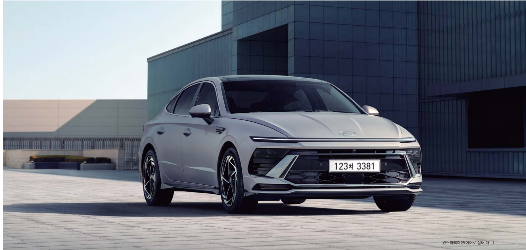
인스퍼레이션(에어로 실버 매트)