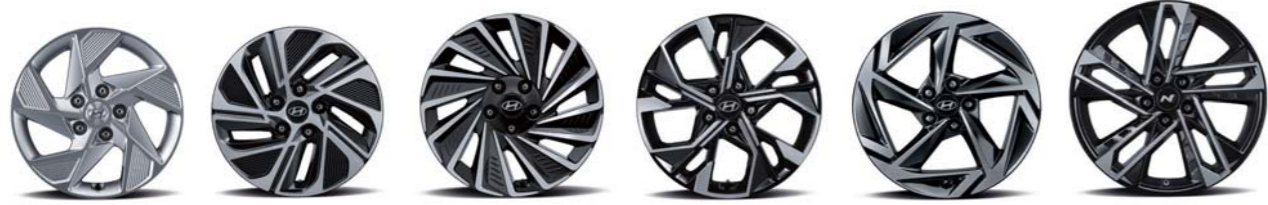
16인치 알로이 휠 (LPG 렌터카 전용) 16인치 알로이 휠 (하이브리드 전용) 17인치 알로이 휠 (하이브리드 전용) 17인치 알로이 휠 18인치 알로이 휠 19인치 알로이 휠 (N Line 전용)