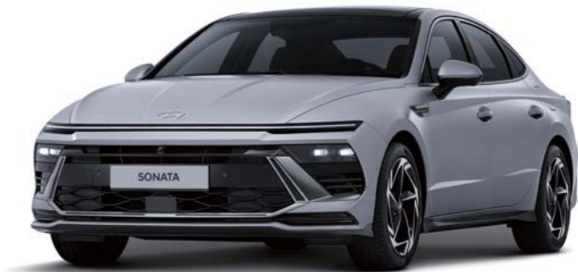
인스퍼레이션(에어로 실버 매트)