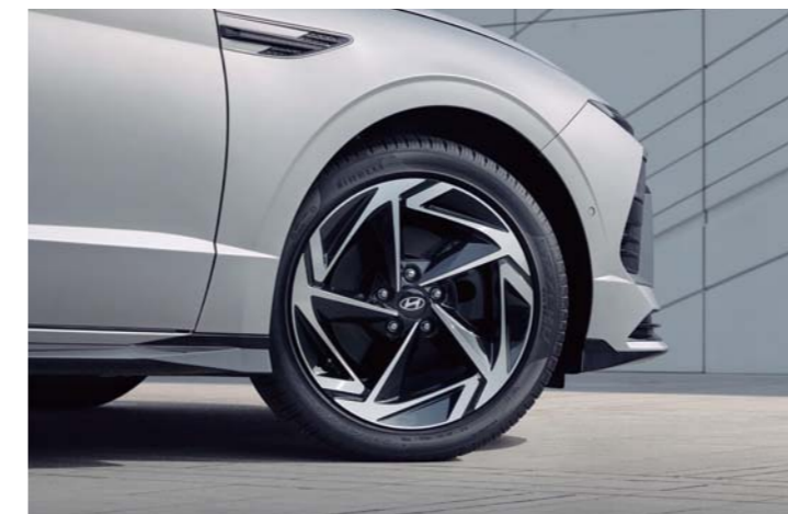
LED 리어콤비램프 18인치 알루미늄 휠 & 피렐리 타이어