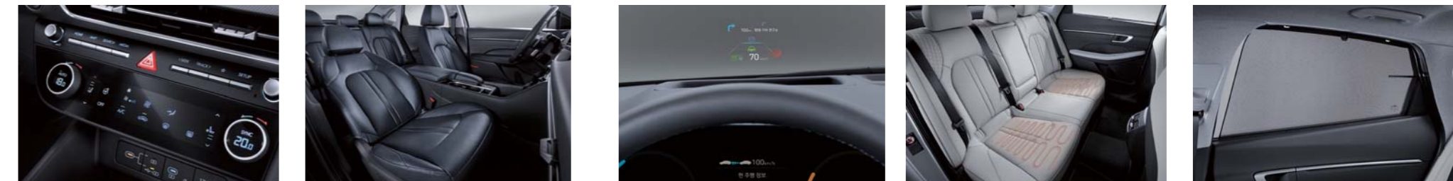
스마트 파워 트렁크 파노라믹 커브드 디스플레이/클러스터(12.3인치 컬러 LCD) 동승석 전동시트(4way, 릴랙션 컴포트, 워크인 디바이스) 심리스 호라이즌 램프, Full LED 헤드램프(프로젝션 타입) 헤드업 디스플레이 자외선 차단 유리(윈드실드) 2열 열선시트 터치타입 아웃사이드 도어 핸들 2열 수동식 도어커튼