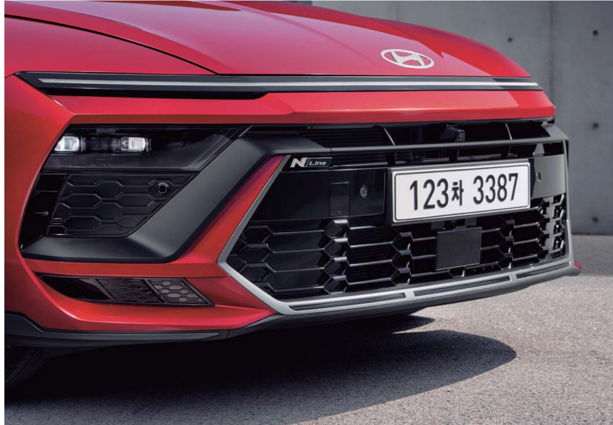
N Line 전용 디자인