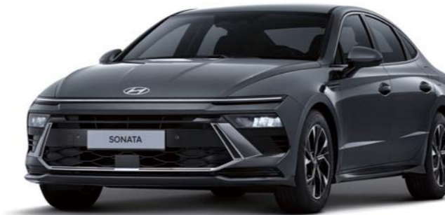
익스클루시브(녹턴 그레이 메탈릭)