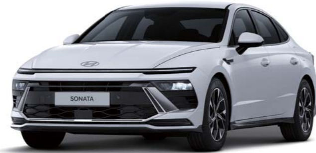
프리미엄(세레니티 화이트 펠)