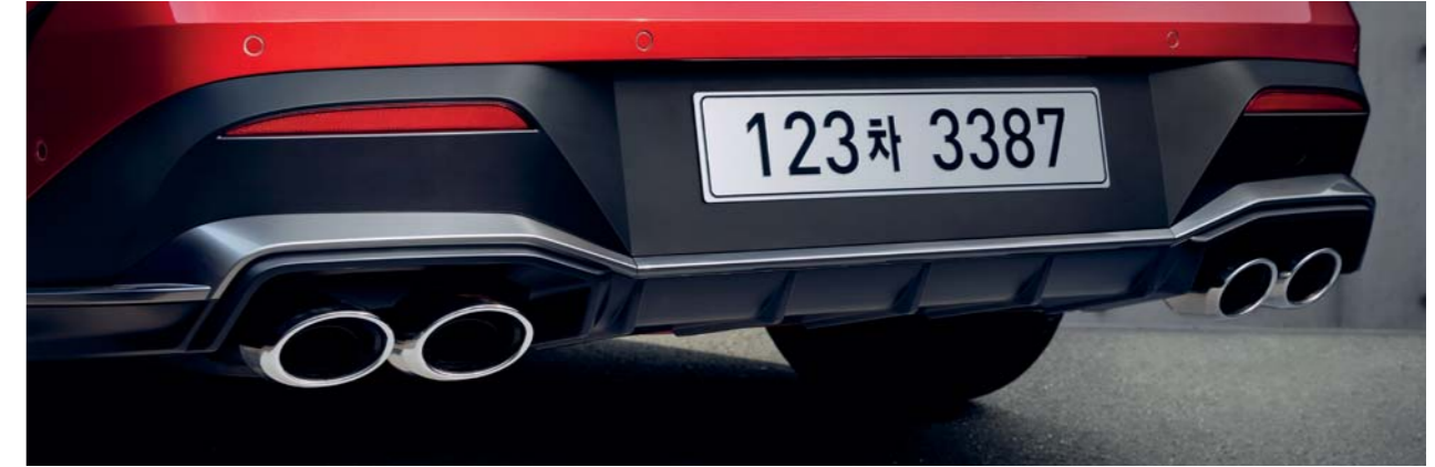
듀얼 트윈팁 머플러(2.5T) 듀얼 트윈팁 머플러 가니쉬(2.0/1.6T)