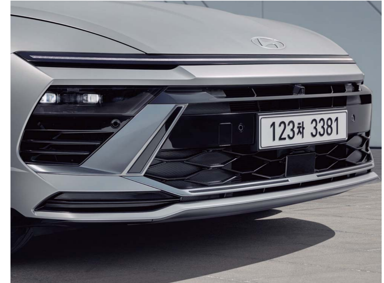
심리스 호라이즌 램프, Full LED 헤드램프(프로젝션 타입)