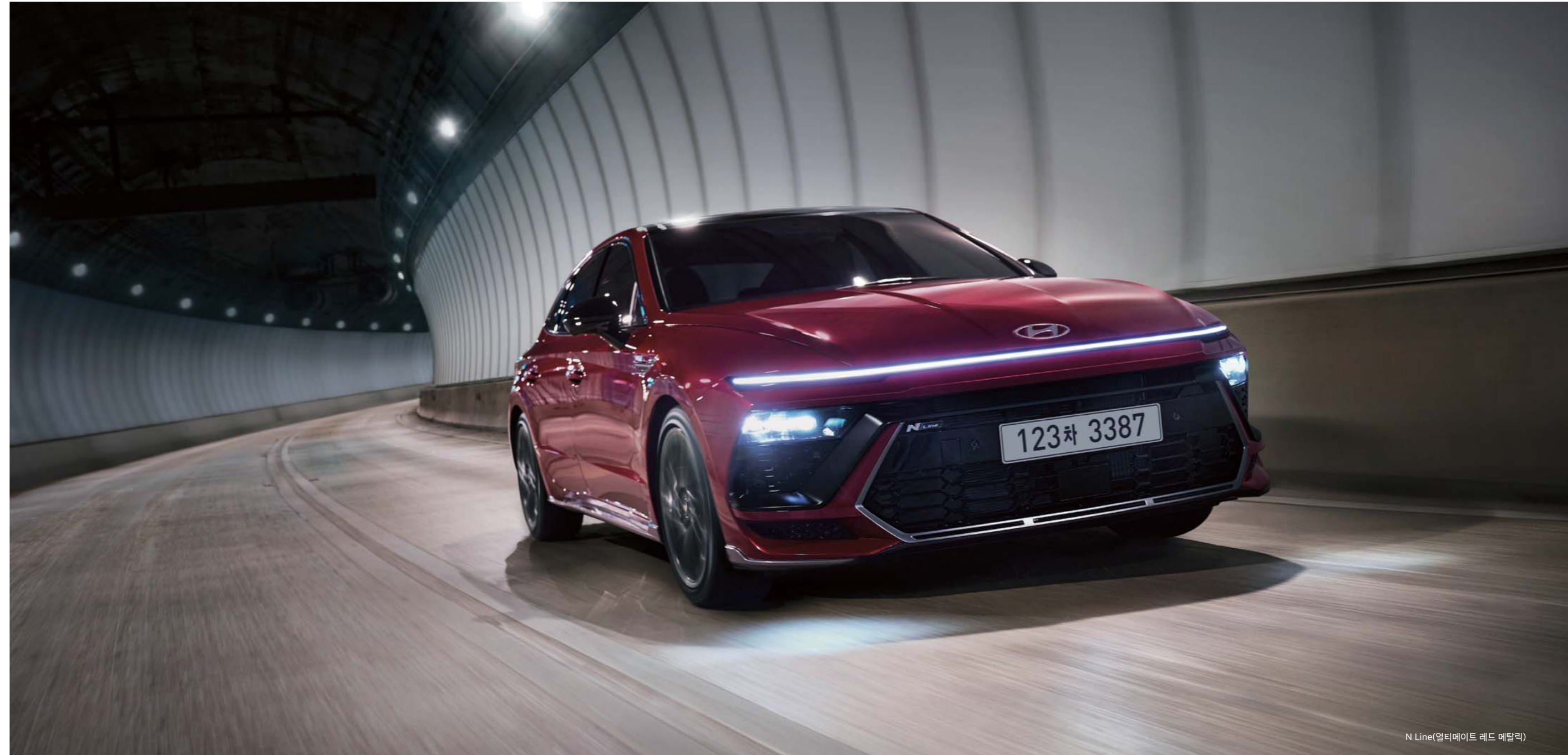
N Line(얼티메이트 레드 메달릭)

290 최고출력 PS/5,800rpm 43.0 최대토크 kgf-m/1,650~4,000rpm 11.1 복합연비 km/ℓ(8단 습식 DCT/19인치)