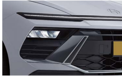
심리스 호라이즌 램프(수평형 LED 램프-주간주행등, 방향지시등(앞), 포시셔닝 램프)