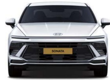
윤거전 1,623 전폭 1,860