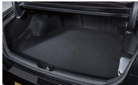
트렁크 용량 증대(구형 소나타 택시 모델 대비 +60ℓ)