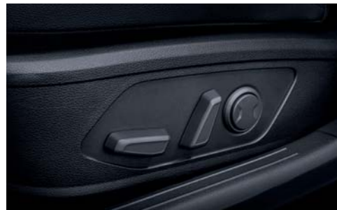
운전석 전동시트(8way, 림버서포트)