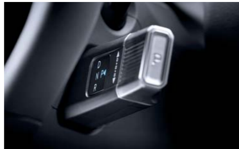
전자식 변속 칼럼