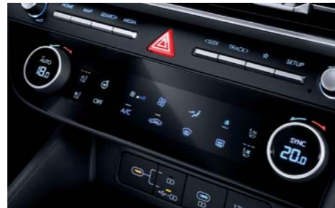
듀얼 풀오토 에어컨(미세먼지센서/공기청정모드/애프터 블로우 포함)