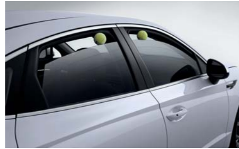
세이프티 파워 윈도우(전좌석)