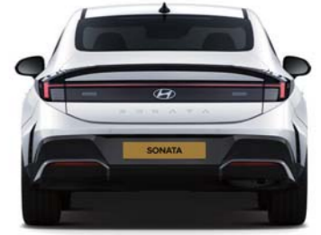
윤거후 1,630 단위: mm