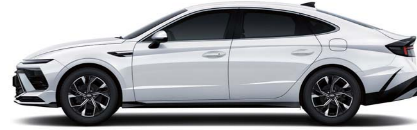
축간거리 2,875 전장 4,945