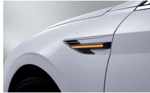
펜더 LED 방향지시등