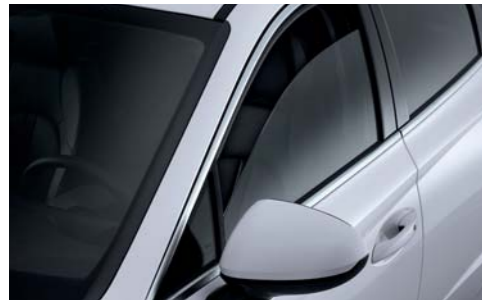
이중접합 차음유리(윈드실드, 1열도어)