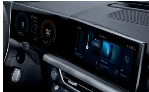
클러스터(4.2인치 컬러 LCD)/12.3인치 디스플레이