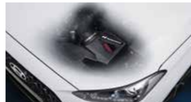
고성능 흡기 시스템