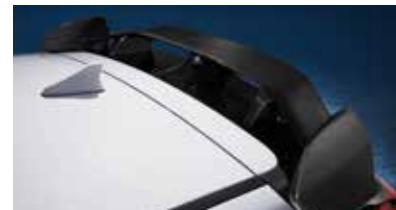
카본 리어 스포일러