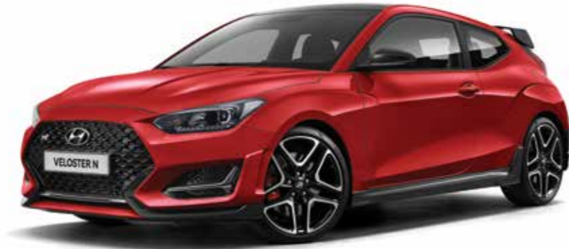
VELOSTER N (이그나이트 레드)