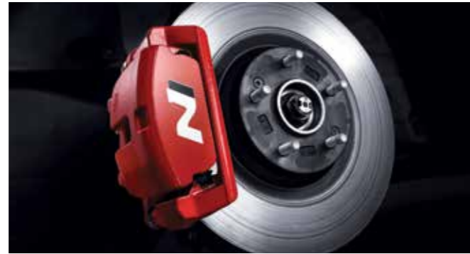
N 전용 대용량 고성능 브레이크 & 캘리퍼 N 로고 고성능 자동차에서는 달리는 것보다 멈추는 것이 더 중요하기에 대용량 고성능 브레이크로 다이내믹한 드라이빙에도 안정감을 전달합니다.