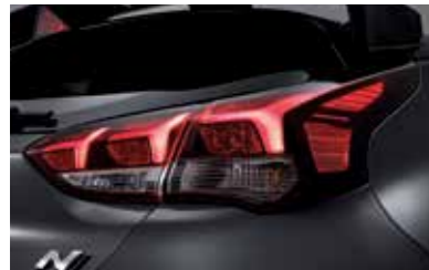
LED 리어 콤비램프