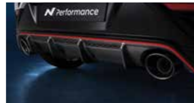
카본 리어 디퓨저