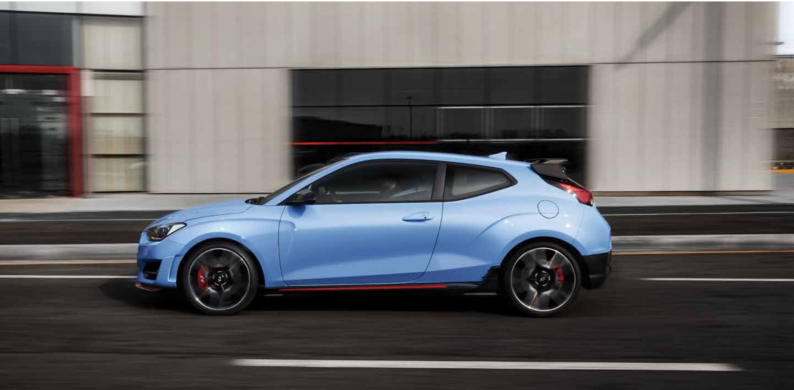
VELOSTER N 풀옵션 (퍼포먼스 블루, 와이드 선루프 제외)