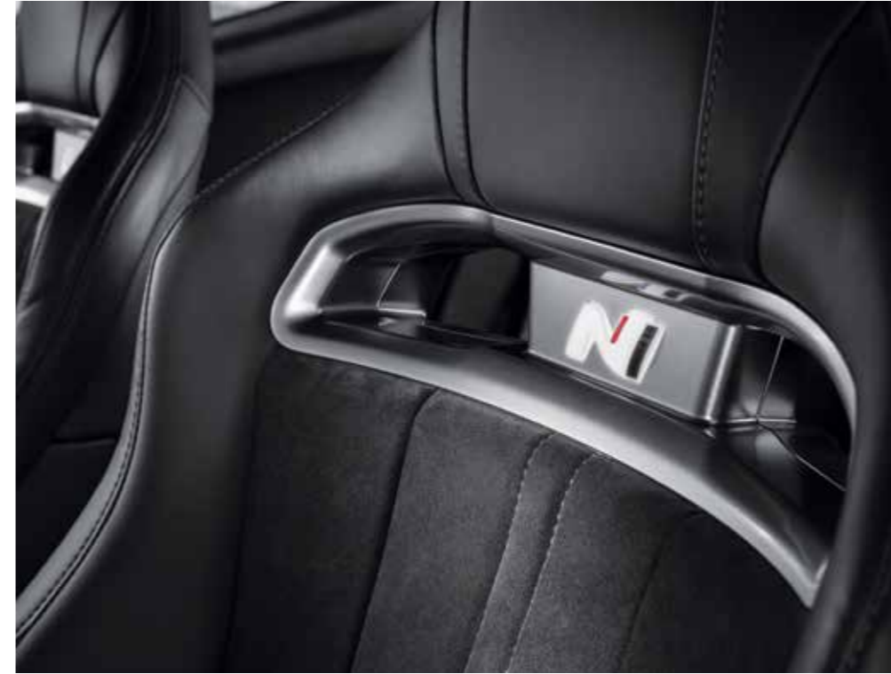
N 라이트 스포츠 버킷 시트 (N 로고 웰컴 점등, 알칸타라 스웨이드 적용)