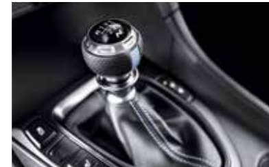
N 전용 6단 수동 변속기