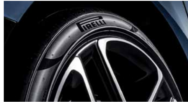
피렐리 P Zero 타이어 N의 파워풀한 성능을 완벽하게 구현하기 위해 피렐리의 고성능 타이어인 P Zero를 적용하였습니다.