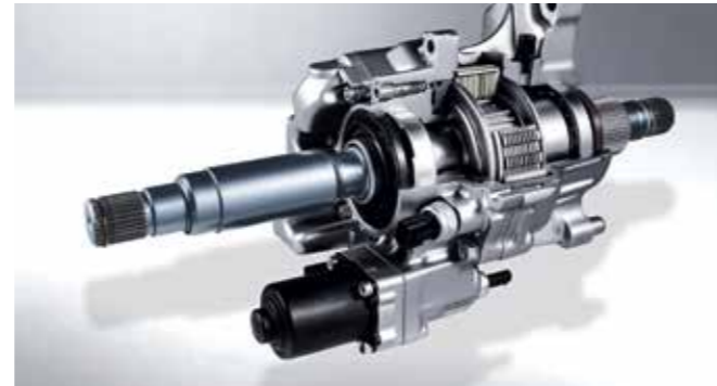
N 코너 카빙 디퍼렌셜 (N Corner Carving Differential) 코너링 주행 시 좌우 바퀴의 구동력을 전자적으로 제어/배분하여 미끄러짐 없는 가속이 가능합니다.