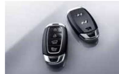
N 로고 스마트키