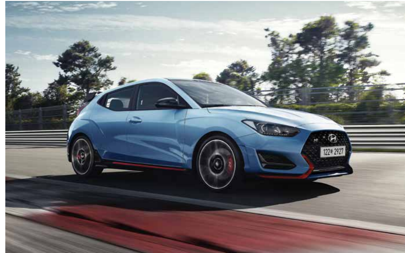
N 파워 쉬프트 (NPS, N Power Shift) 가속 시 엔진 회전수를 제어하여 가속성능을 향상시키고, 수동 변속기에서나 가능했던 변속 시 힘있게 밀어주는 느낌을 구현하여 편 드라이빙을 완성합니다.