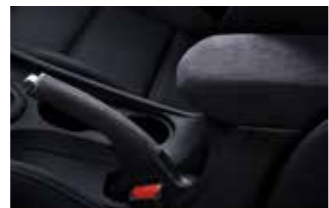
알칸타라 파킹레버 & 센터콘솔