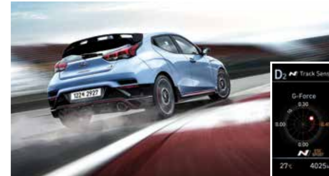
N 트랙 센스 쉬프트 (NTS, N Track Sense Shift) 코너링이 많은 주행이 감지되는 경우 스포츠 주행 조건에 최적화된 변속단을 자동 제어하여 전문 드라이버 수준의 역동적인 드라이빙을 선사합니다.