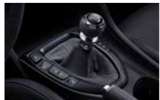
알칸타라 수동 변속기 노브 & 부츠 *N DCT 적용 가능