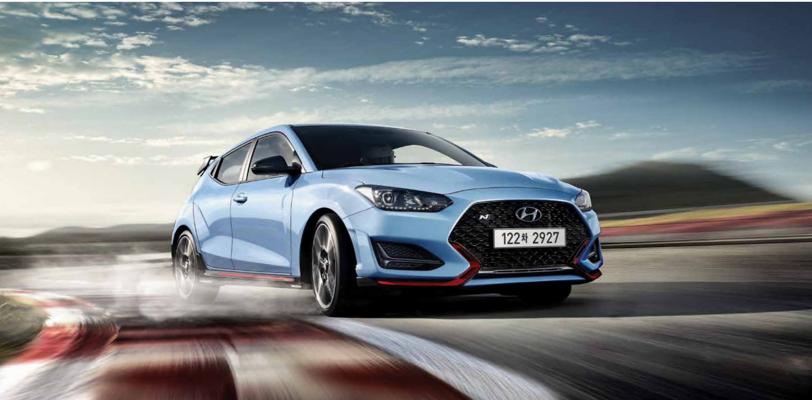
VELOSTER N 풀옵션 (퍼포먼스 블루, 와이드 선루프 제외)