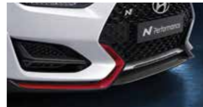
카본 프론트 립 & 포그 가니쉬