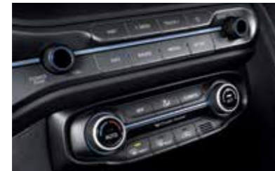
풀 오토 에어컨