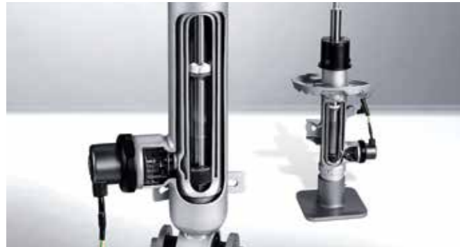
전자 제어 서스펜션 (ECS, Electronic Control Suspension) 운전상황에 맞게 각 휠의 속업소버 감쇠력을 제어하여 트랙과 일상, 모든 주행 조건에서 차별화된 성능을 구현합니다.