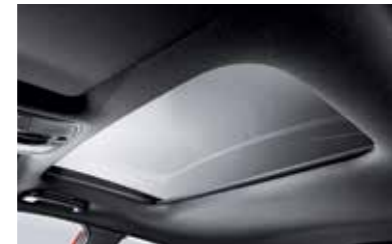
와이드 선루프(직물 헤드라이닝 포함)