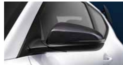
카본 사이드 미러 커버