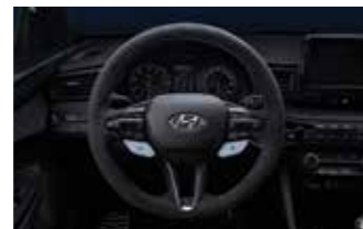
알칸타라 스티어링 휠