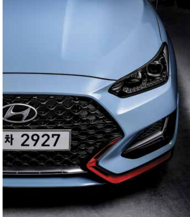
와이드 타입 라디에이터 그릴 & 에어커튼

성능을 극대화하는 설계와 강렬한 레드 컬러 포인트의 디자인으로 보다 강인하고 개성 있는 고성능 핫해치를 완성했습니다.