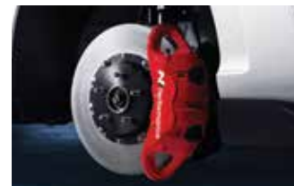
N 퍼포먼스 브레이크 시스템 (모노블록 4피스톤 캘리퍼, 볼팅타입 하이브리드 디스크, 로우 스틸 패드)