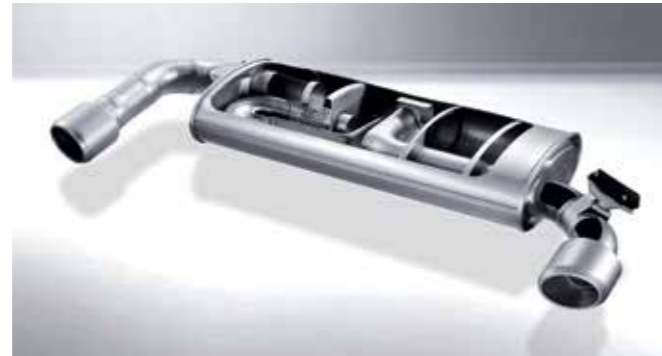
능동 가변 배기 시스템 (Variable Exhaust Valve) 배기 파이프의 형상과 전자식 가변 밸브를 이용하여 운전상황에 맞게 정숙하거나 스포티한 배기음을 선사합니다.