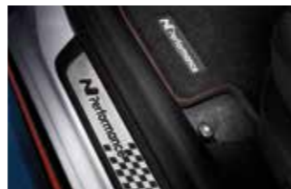
N 퍼포먼스 전용 매트 & 메탈 도어스커프