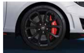
19인치 경량 휠 *단품 선택 가능