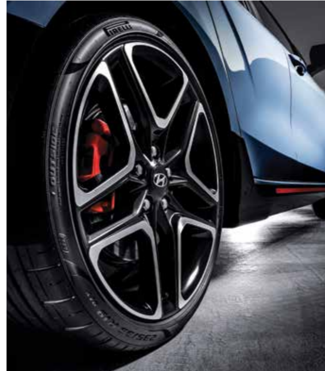
19인치 알로이 휠 & 사이드 실