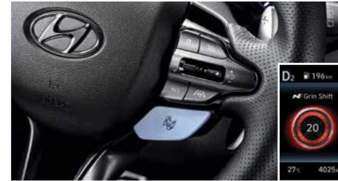
N 그린 쉬프트 (NGS, N Grin Shift) 주행 중 빠른 가속이 필요할 때 NGS 버튼을 누르면 20초간 엔진과 변속기의 최대 성능을 활용할 수 있습니다.