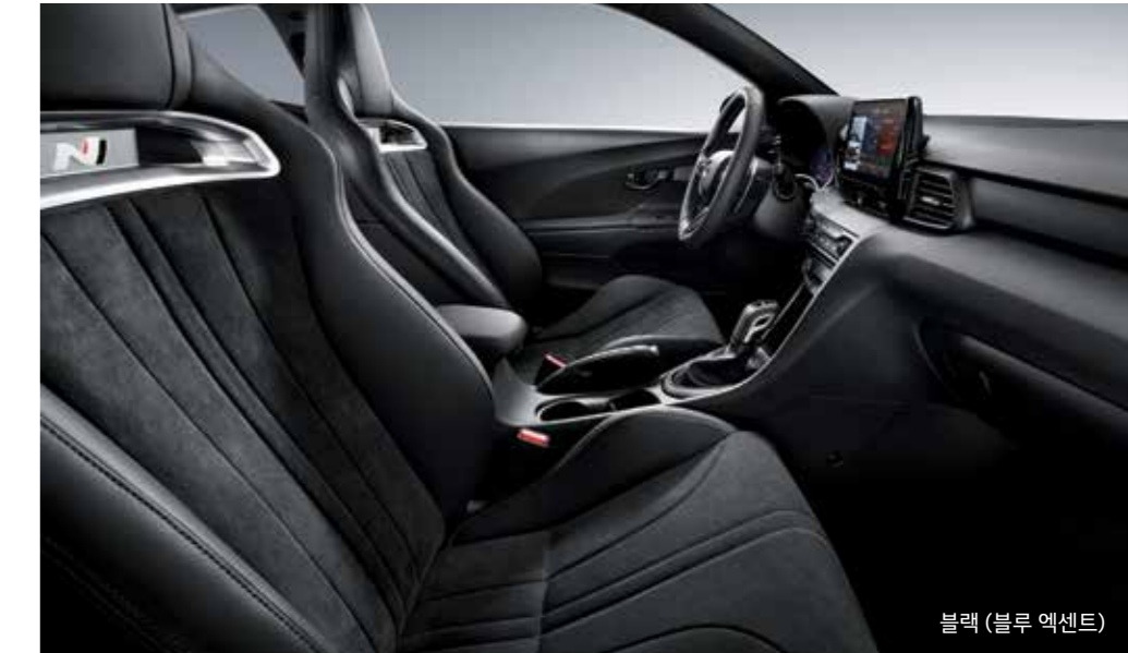
블랙 (블루 액센트)