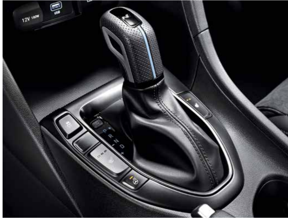
N DCT 기어 노브 & 부츠

탑승하는 순간 운전자와 완벽하게 밀착되는 N 라이트 스포츠 버킷 시트와 뛰어난 그립감의 변속기 노브와 스티어링 휠에서 짜릿한 N의 감성이 시작됩니다.