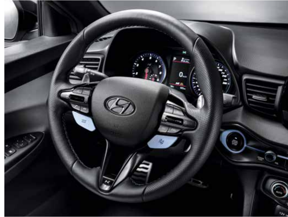
스포츠 스티어링 휠 & 패들 쉬프트