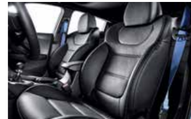
N 전용 스포츠 버킷시트 & 퍼포먼스 블루 컬러 시트벨트