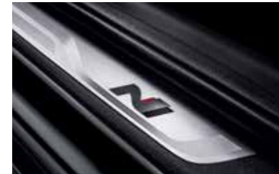
N 전용 메탈 도어 스커프