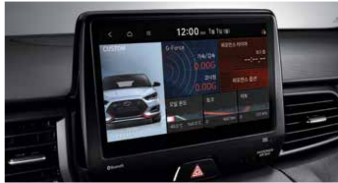
N 그린 컨트롤 시스템 (N Grin Control System) 벨로스터 N의 에코/노멀/스포츠/N/커스텀 드라이빙 모드를 이용하여 상황에 따른 주행특성 컨트롤이 가능합니다.