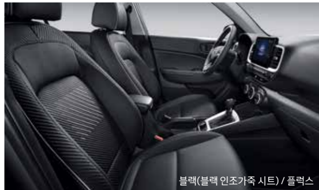
블랙(블랙 인조가죽 시트) / 플렉스