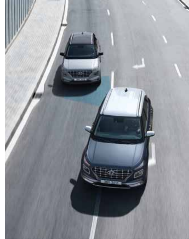
후측방 충돌 경고 아웃사이드 미러로 확인할 수 없는 사각지대 또는 후측방에서 접근하는 차량을 감지해 운전자에게 경고합니다.