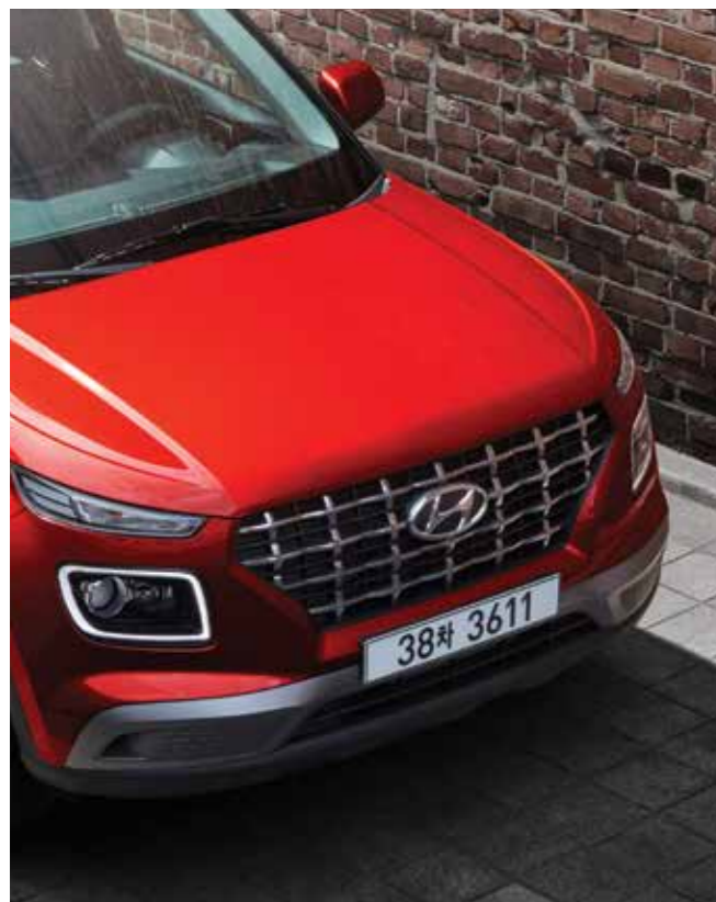
캐스케이딩 그릴 / LED 헤드램프