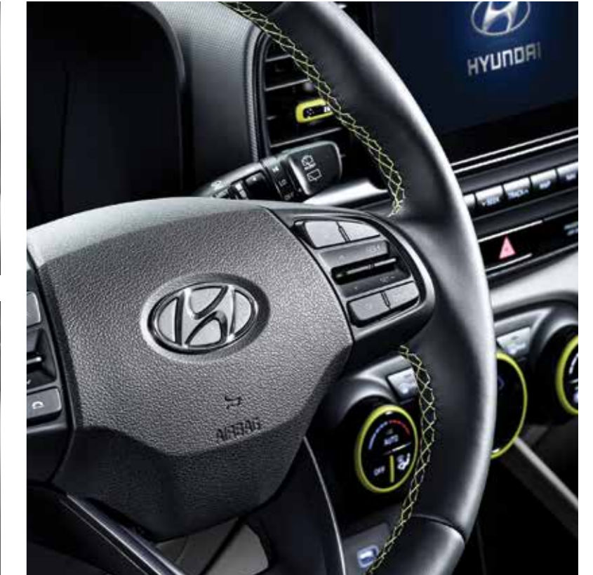
가죽 스티어링 휠(FLUX 전용 스티치 포함)

*그레이 투톤 선택 시 라임컬러 포인트 적용 예시 이미지입니다. (블랙 내장, 메테오 블루 내장 적용 시 화이트, 라이트 실버 컬러 포인트 적용)