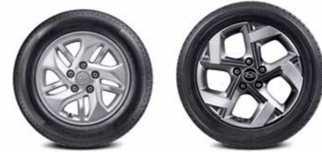
185/65R15 타이어 & 15인치 알로이 휠 205/55R17 타이어 & 17인치 알로이 휠