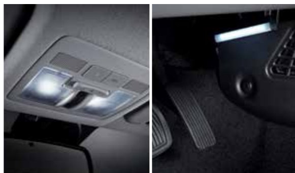
무선충전기 실내 LED 램프(오버헤드콘솔/룸/선바이저/풋우드/러기지)