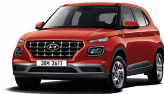
스마트 풀옵선(라바 오렌지)