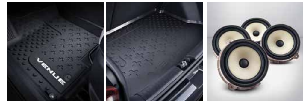
적외선 무릎 워머 프로텍션 매트 패키지(인테리어 매트, 러기지 매트)