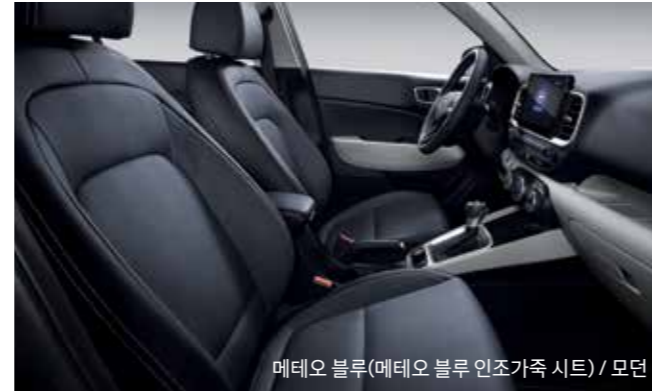
메테오 블루(메테오 블루 인조가죽 시트) / 모던