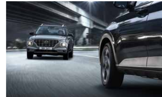
하이빔 보조 야간에 상향등을 켜고 주행하는 중 맞은편 또는 앞쪽에 차량이 있을 경우 헤드램프를 하향등으로 전환하여 잦은 상향등 조작에 따른 불편함을 줄여주고 운전차량 및 상대차량이 안전하게 주행할 수 있도록 도와줍니다.