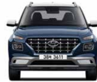
윤거전 1,535 전폭 1,770