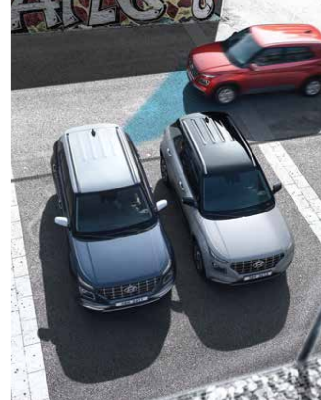
후방 교차 충돌 경고 후진 출차 시 후측방 사각지대에서 접근하는 차량을 감지하여 운전자에게 경고해줍니다.