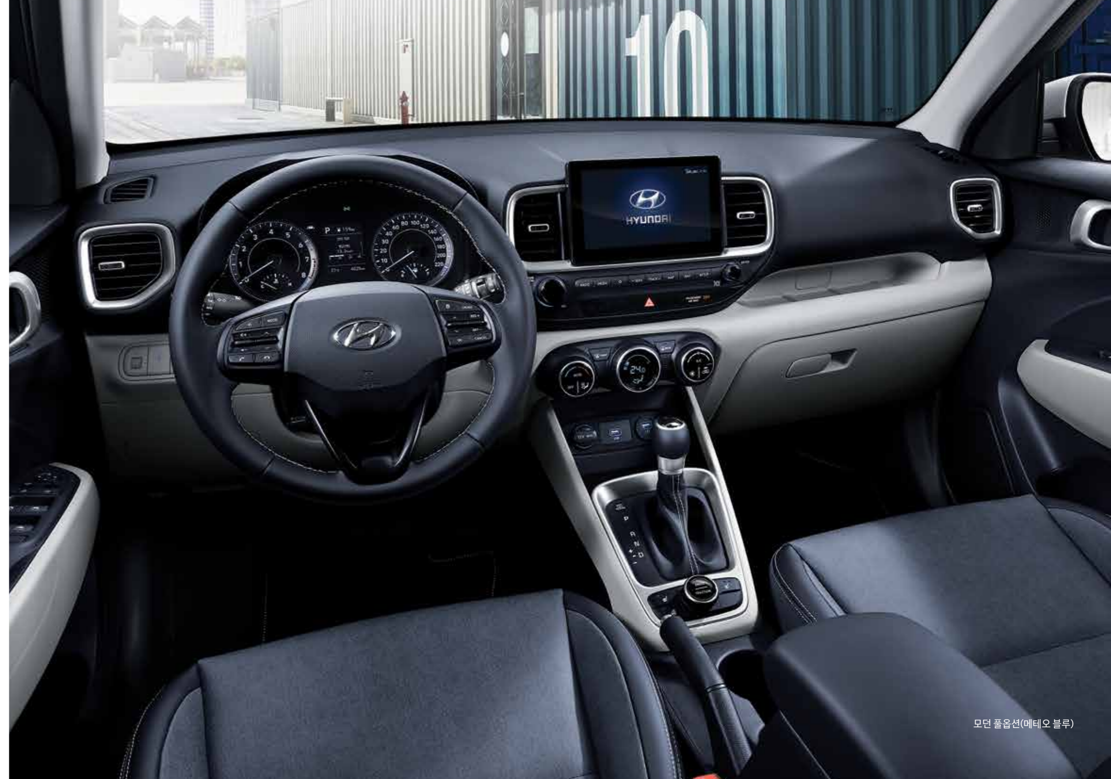
모던 풀옵션(메테오 블루)