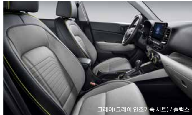
그레이(그레이 인조가죽 시트) / 플렉스