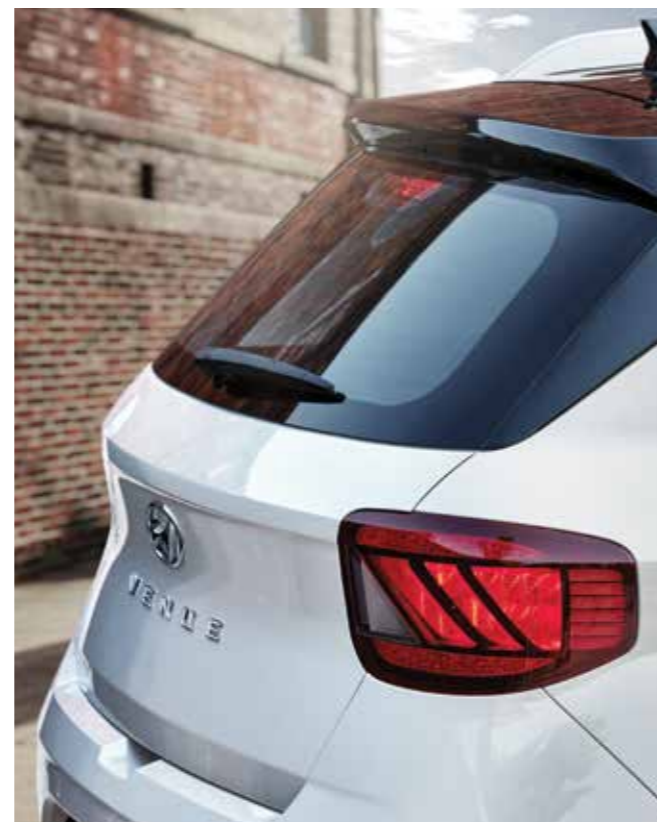
LED 리어 콤비램프