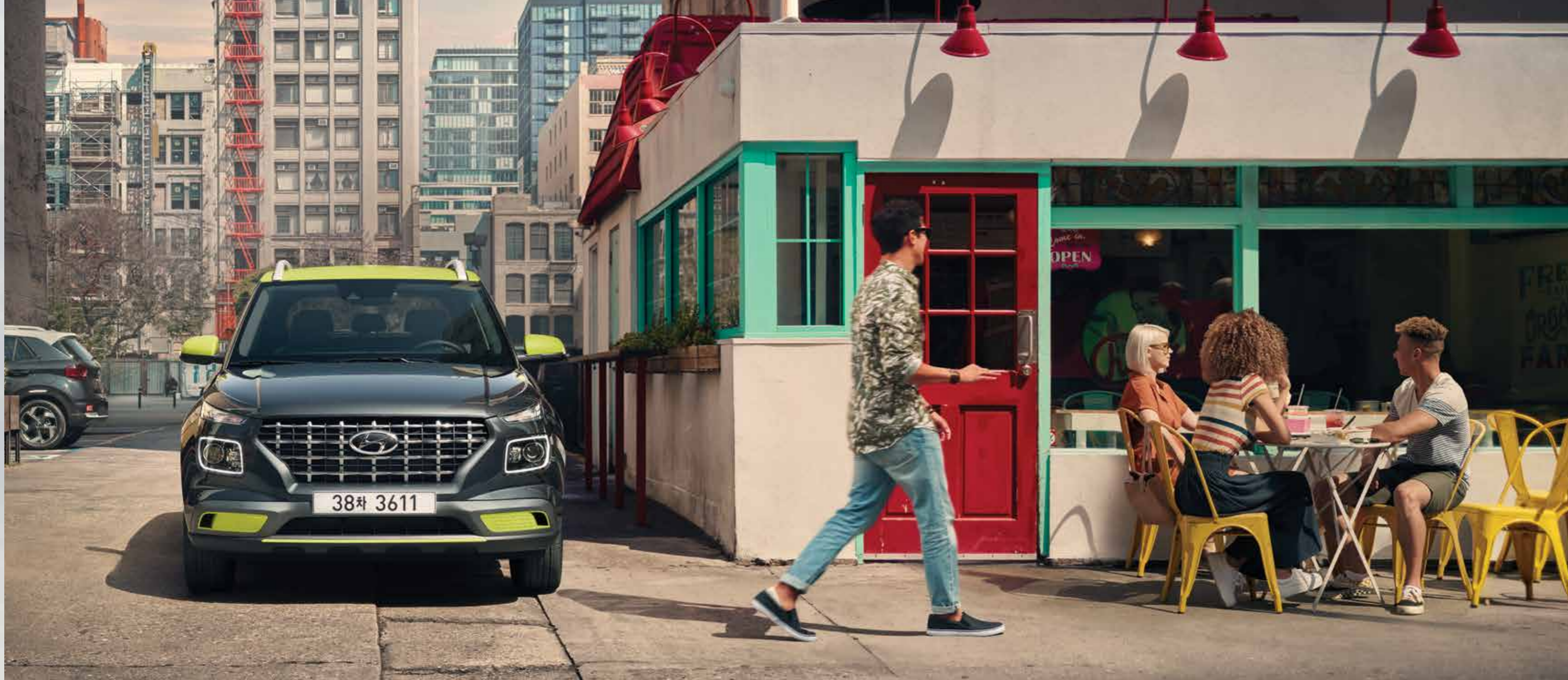
모던 풀옵션(코스믹 그레이/애시드 옐로우 투톤)