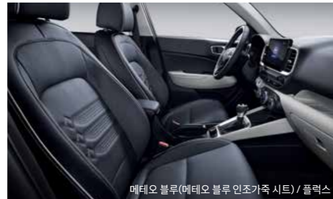
메테오 블루(메테오 블루 인조가죽 시트) / 플렉스

*트림, 패키지별 적용 사양 상이) 모델별 자세한 사양은 해당 월의 가격표를 참고하시기 바랍니다.