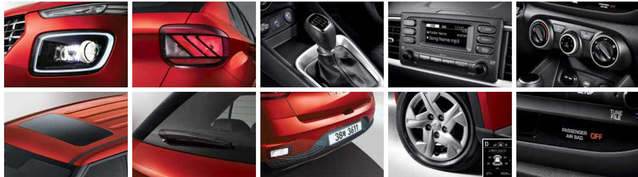
프로젝션 헤드램프(스태틱 벤딩 라이트 포함) & LED 주간주행등(DRL, 포지셔닝 기능 포함) 리어 콤비램프 리어 와이퍼 6단 수동변속기 주차 거리 경고(후방) 오디오(라디오/MP3) 개별 타이어 공기압 경보장치 매뉴얼 에어컨 6에어백 시스템(앞좌석어드밴스드, 앞좌석사이드, 전복대응커튼)