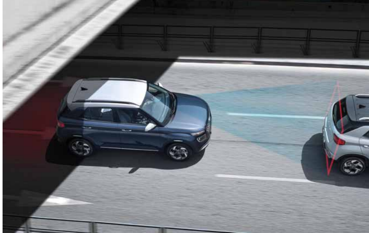
전방 충돌 방지 보조 전방 차량 또는 보행자와의 충돌 위험 상황이 감지될 경우 운전자에게 이를 경고하고, 자동제어를 통해 충돌 속도를 저감하거나 충돌을 방지합니다.