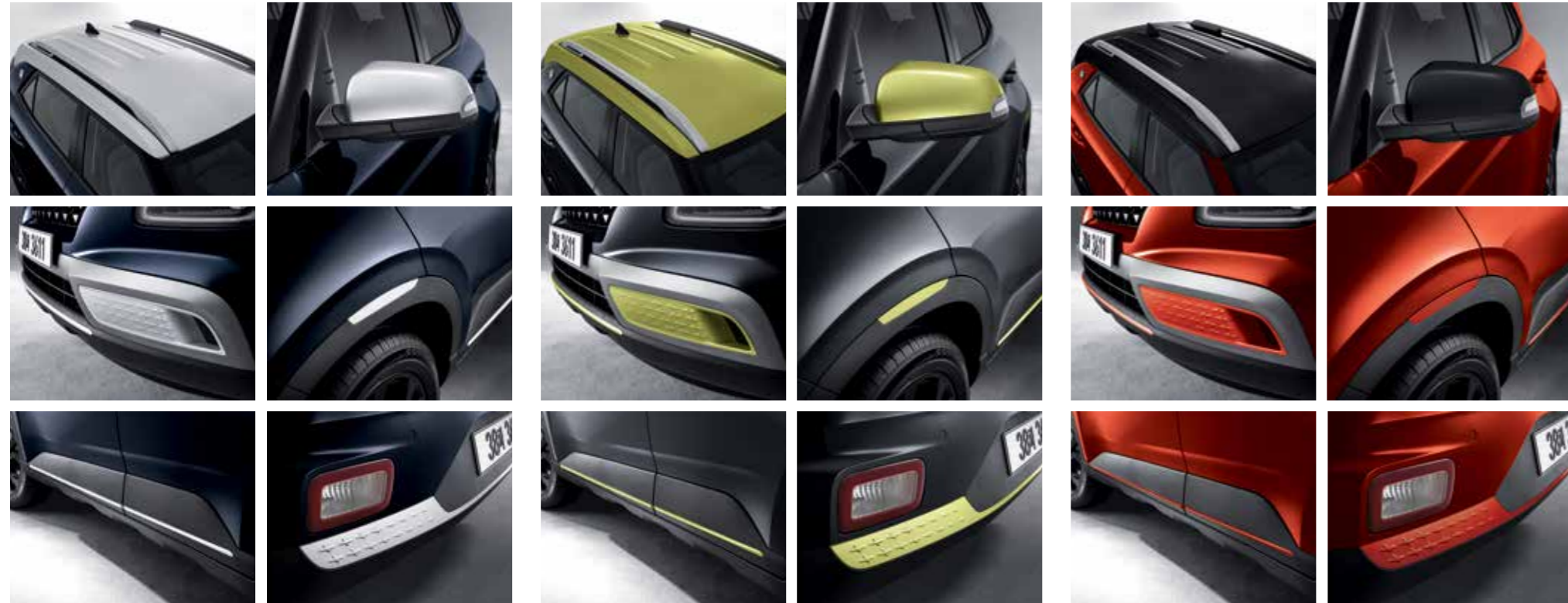
더 데님/초크 화이트 투톤

투톤 루프 컬러는 총 3종(초크 화이트 / 애시드 옐로우 / 팬텀블랙)입니다. 초크 화이트/애시드 옐로우 루프 선택 시, 컬러포인트는 해당 루프 컬러와 동일하게 적용됩니다. 팬텀 블랙 루프 선택 시, 아웃사이드 미러는 팬텀 블랙 컬러로 적용되며 그 외 컬러포인트는 바디 컬러로 적용됩니다.