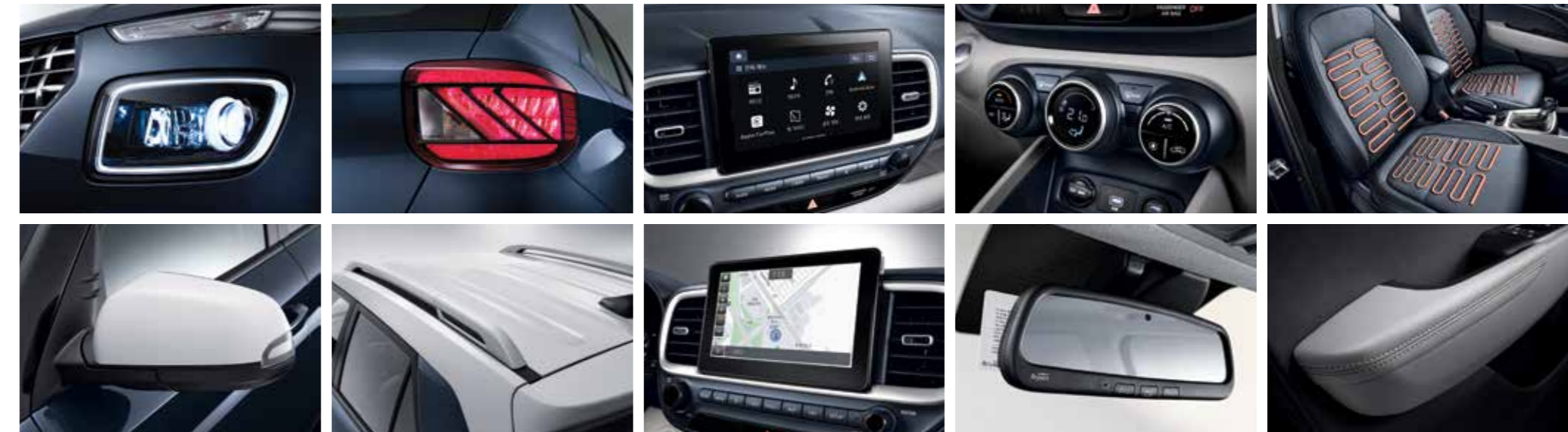
LED 헤드램프 아웃사이드 미러(전동접이, LED방향지시등) LED 리어 콤비램프 루프랙 8인치 디스플레이 오디오 8인치 내비게이션 풀오토 에어컨 하이패스 시스템(ECM 적용) 앞좌석 열선 인조가죽 도어 암레스트 *플렉스 전용