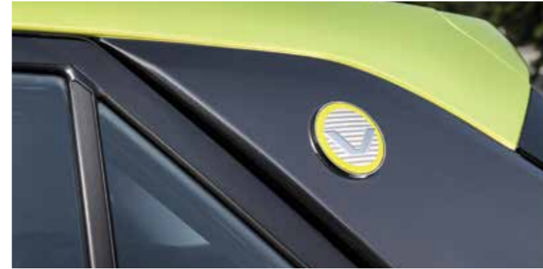
C필러 배지 FLUX 전용 리어스키드