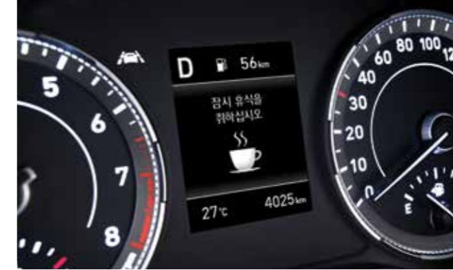
운전자 주의 경고 운전자의 피로나 부주의한 운전 패턴으로 판단되면 팝업 메시지와 경고음을 통해 휴식을 권유합니다.