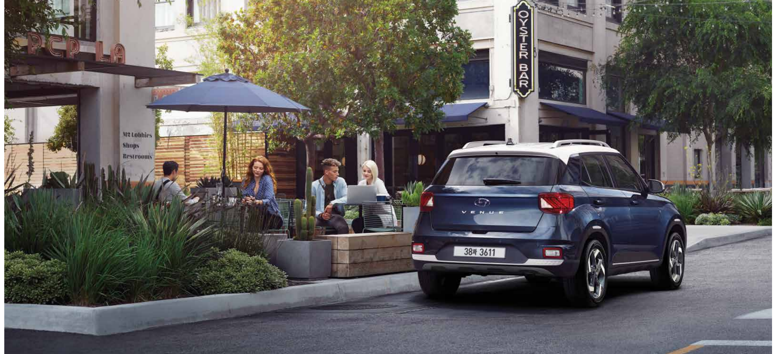
모던 풀업션(더 데님/초크 화이트 투톤)