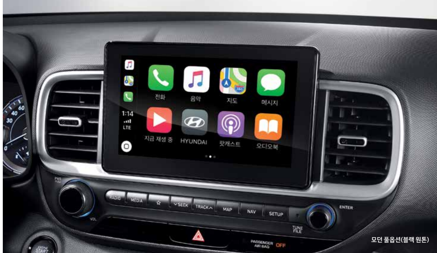
모던 풀옵션(블랙 원톤)

8인치 내비게이션 8인치 심리스 디스플레이로 미래지향적 이미지와 시각적인 안정감을 전달합니다. 스마트폰의 주요 기능을 조작하고 디스플레이에 표시하는 폰 커넥티비티, 카카오톡 음성인식 시스템 등 최신 테크놀로지가 적용된 VENU의 인포테인먼트 시스템은 새롭고 즐거운 경험을 제공합니다.