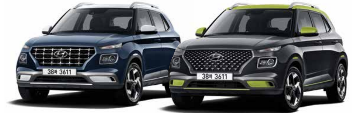
모던 풀옵선(더 데님/초크 화이트 투톤) / 플렉스 풀옵선(코스믹 그레이/애시드 옐로우 투톤)