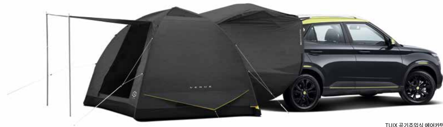
TUIX 공기주입식 에어카텐트

운전자의 허벅지와 무릎에 복사열을 전달하는 적외선 무릎 워머, 반려동물을 가족처럼 생각하는 펫 팬족을 위한 TUIX PET 상품, 트렌디한 아웃도어 라이프를 위한 TUIX 공기주입식 에어카텐트 등 다양한 혼라이프에 맞춘 특별한 아이템으로 풍부하고 다채로운 경험을 제공합니다.