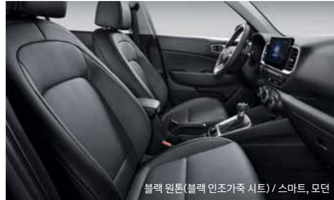
블랙 원톤(블랙 인조가죽 시트) / 스마트, 모던