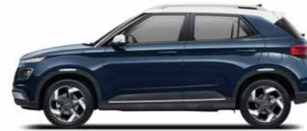
축간거리 2,520 전장 4,040