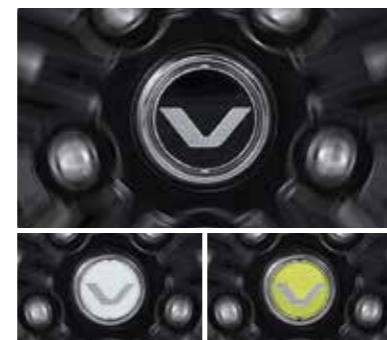
17인치 블랙 알루미늄 스피닝 휠 캡(블랙/화이트/옐로우)