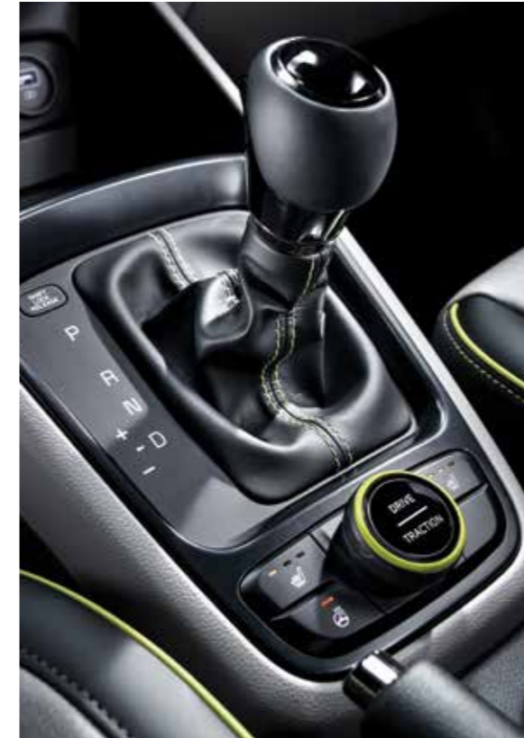
기어노브 & 2WD 험로 주행 모드 스위치