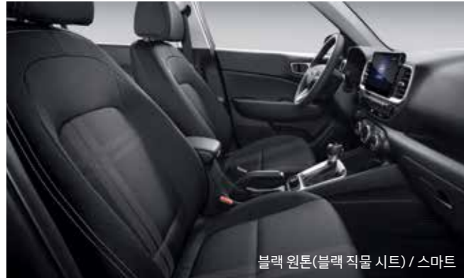
블랙 원톤(블랙 직물 시트) / 스마트