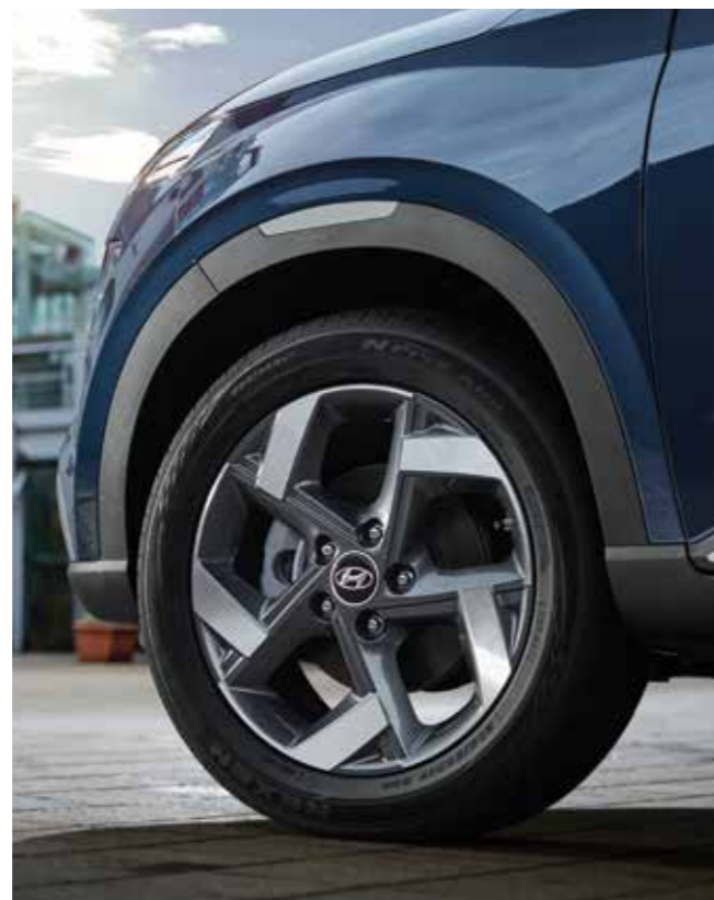
17인치 알로이 휠 & 타이어