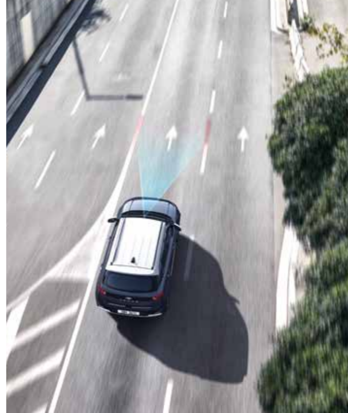
차로 이탈방지 보조 전방 카메라를 이용해 차선을 인식하고 방향지시등 조작 없이 차량이 차로를 이탈하려 할 경우 운전자의 주의 환기를 위해 경고해주며, 필요 시 조향을 보조하여 차로 이탈 상황을 방지해 줍니다.