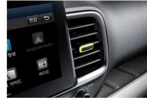
에어벤트 풀오토 에어컨