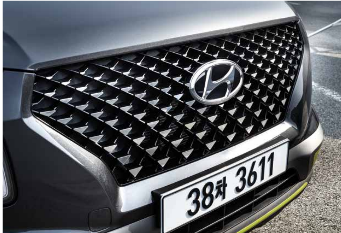
FLUX 전용 핫스탬핑 라디에이터 그릴