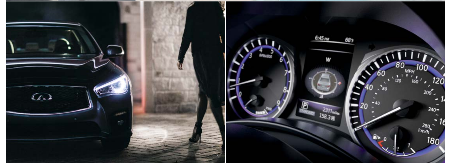
사진의 일부 사항은 실제 판매 모델과 차이가 있을 수 있습니다.