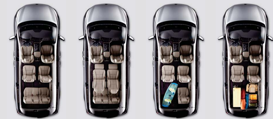
착좌 모드 릴렉스 모드 3열 6:4 분할 싱킹 3열 싱킹