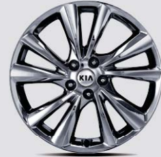
19인치 크롬 스퍼터링 알로이 휠 (7인승 / 9인승)