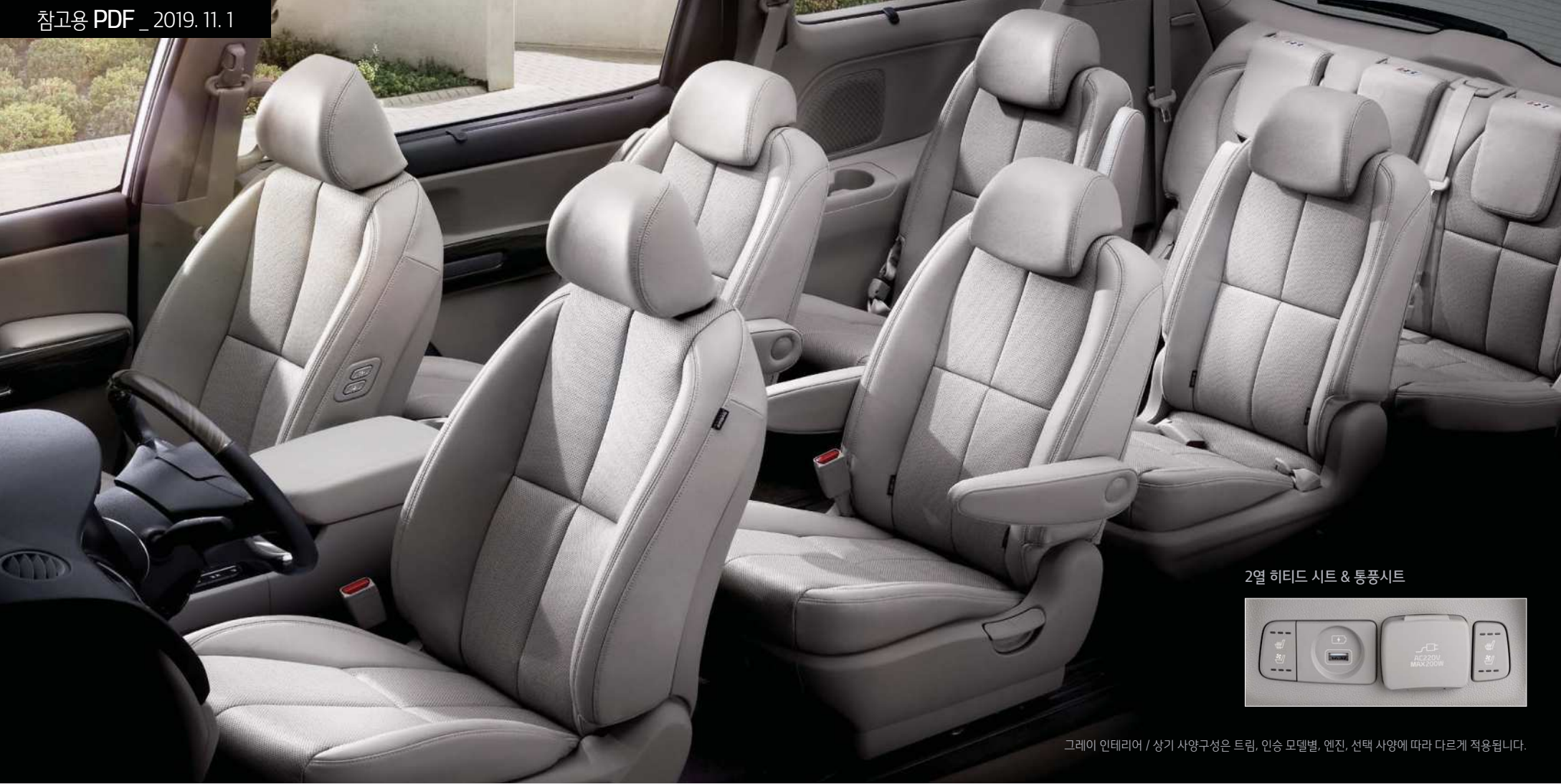
2열 히트드 시트 & 통풍시트