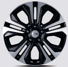
18인치 럭셔리 알로이 휠