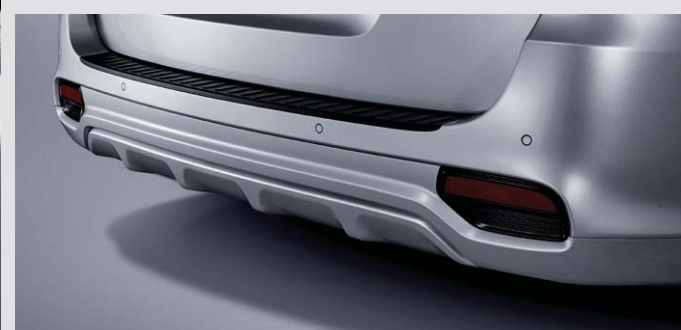
상기 사양구성은 트림, 인승 모델별, 엔진, 선택 사양에 따라 다르게 적용됩니다.