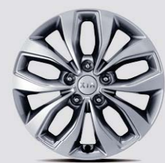
17인치 알로이 휠