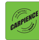
네이버 포스트 카피엔스