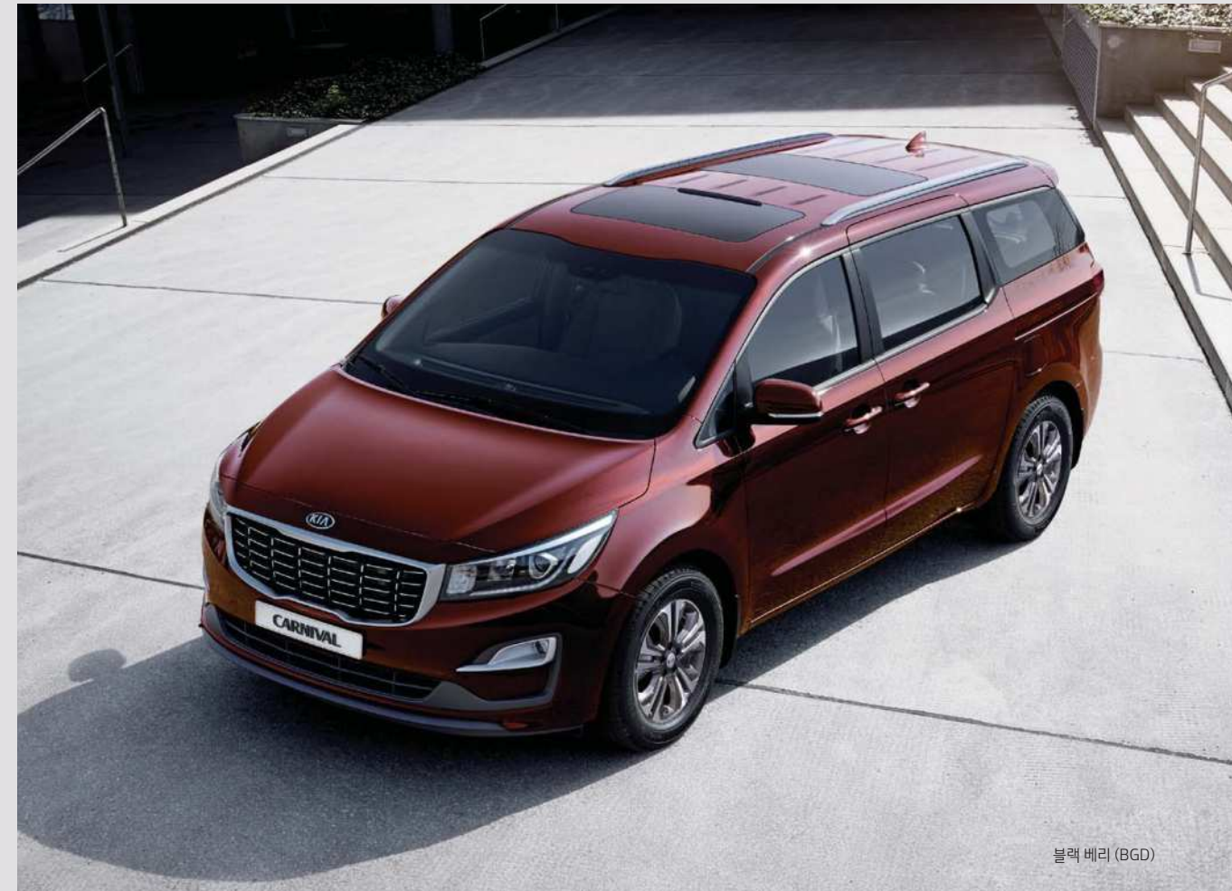
블랙 베리 (BGD)