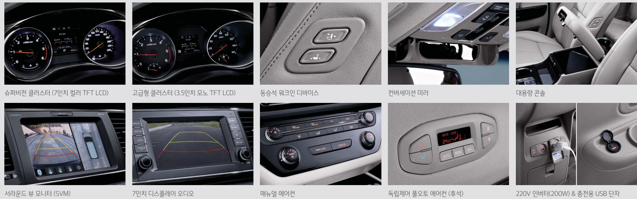
슈퍼비전 클러스터 (7인치 컬러 TFT LCD) 고급형 클러스터 (3.5인치 모노 TFT LCD) 동승석 워크인 디바이스 컨버세이션 미러 대용량 콘솔 서라운드 뷰 모니터 (SVM) 7인치 디스플레이 오디오 매뉴얼 에어컨 독립제어 풀오토 에어컨 (후석) 220V 인버터(200W) & 충전용 USB 단자