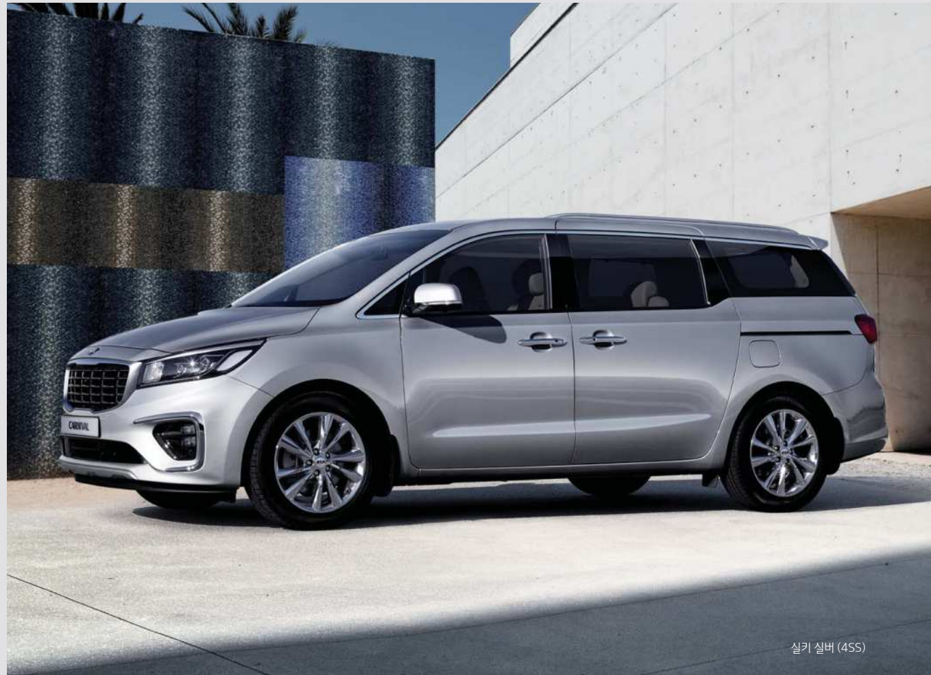
실버 실버 (4SS)