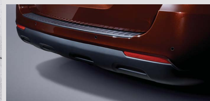
상기 사양구성은 트림, 인승 모델별, 엔진, 선택 사양에 따라 다르게 적용됩니다.