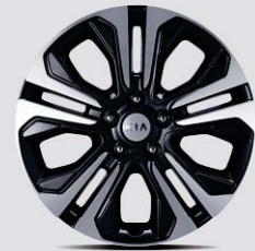
18인치 럭셔리 알로이 휠 (9인승)