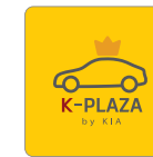
카카오 소통채널 K-PLAZA / King Car