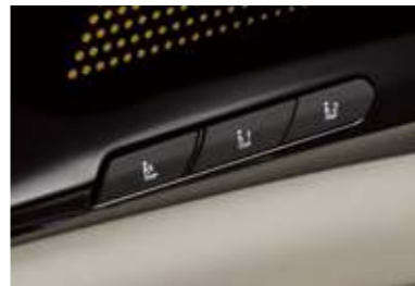
운전자세 메모리 시스템