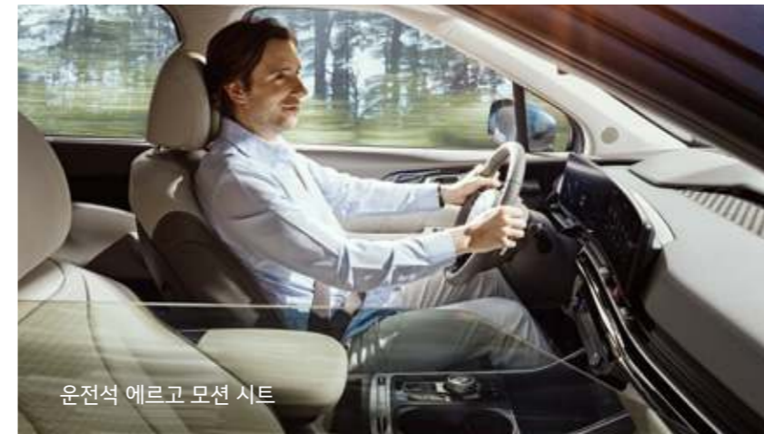
운전석 에르고 모션 시트