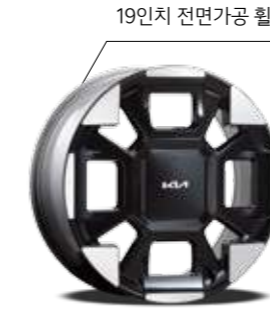
19인치 전면가공 휠