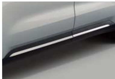
크롬 도어 하단 몰딩