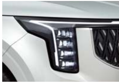
프로젝션 LED 헤드램프