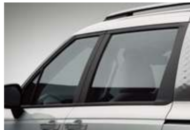
무광 블랙 도어 프레임 가니쉬