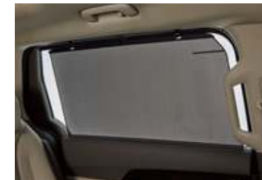
2/3열 측면 수동 선커튼