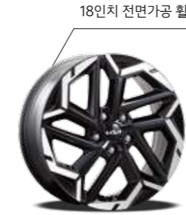
18인치 전면가공 휠