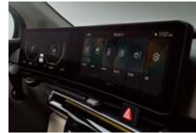
슈퍼비전 클러스터 (12.3인치 풀사이즈 칼라 TFT LCD)