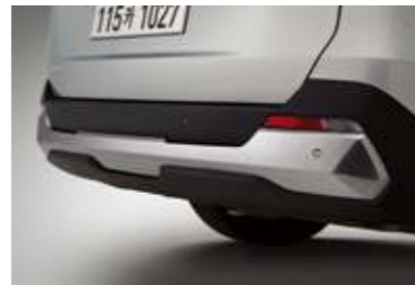
리어 스킵드 플레이트