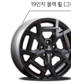
19인치 블랙 휠 (그래비티 전용)