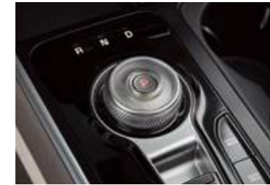
전자식 변속 다이얼