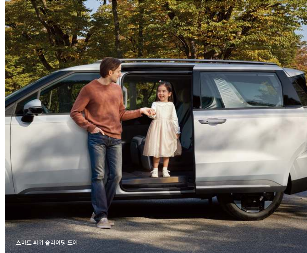
스마트 파워 슬라이딩 도어