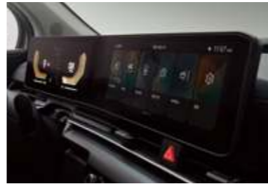
슈퍼비전 클러스터 (4.2인치 칼라 TFT LCD)