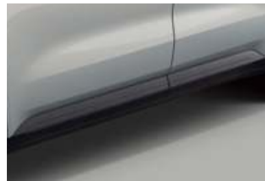
도어 하단 몰딩