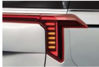
LED 리어 콤비네이션램프