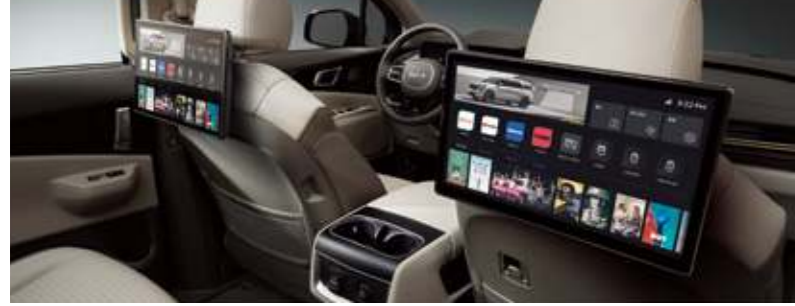
스마트 후석 엔터테인먼트 시스템

※ 스마트 후석 엔터테인먼트 시스템은 추후 별도 출시 예정인 상품입니다. / 냉-온 컵홀더는 1열(2구) 및 2열(2구)에 적용되는 상품입니다.