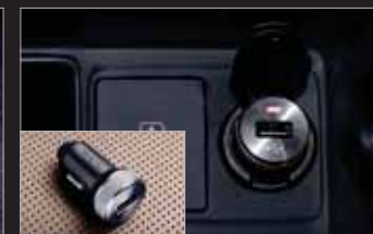
1열 USB 충전기