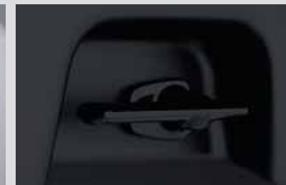
루프박스 유니버설 커넥터