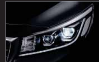
LED 헤드램프 (7/9인승)