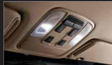
오버헤드 LED 램프