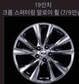
19인치 크롬 스피터링 알로이 휠 (7/9인승)