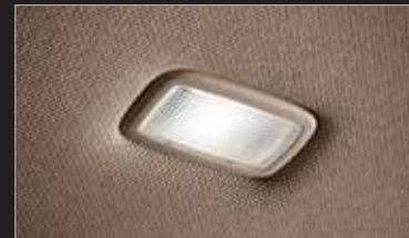
선바이저 LED 램프