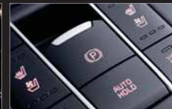
전자식 파킹 브레이크 (EPB)