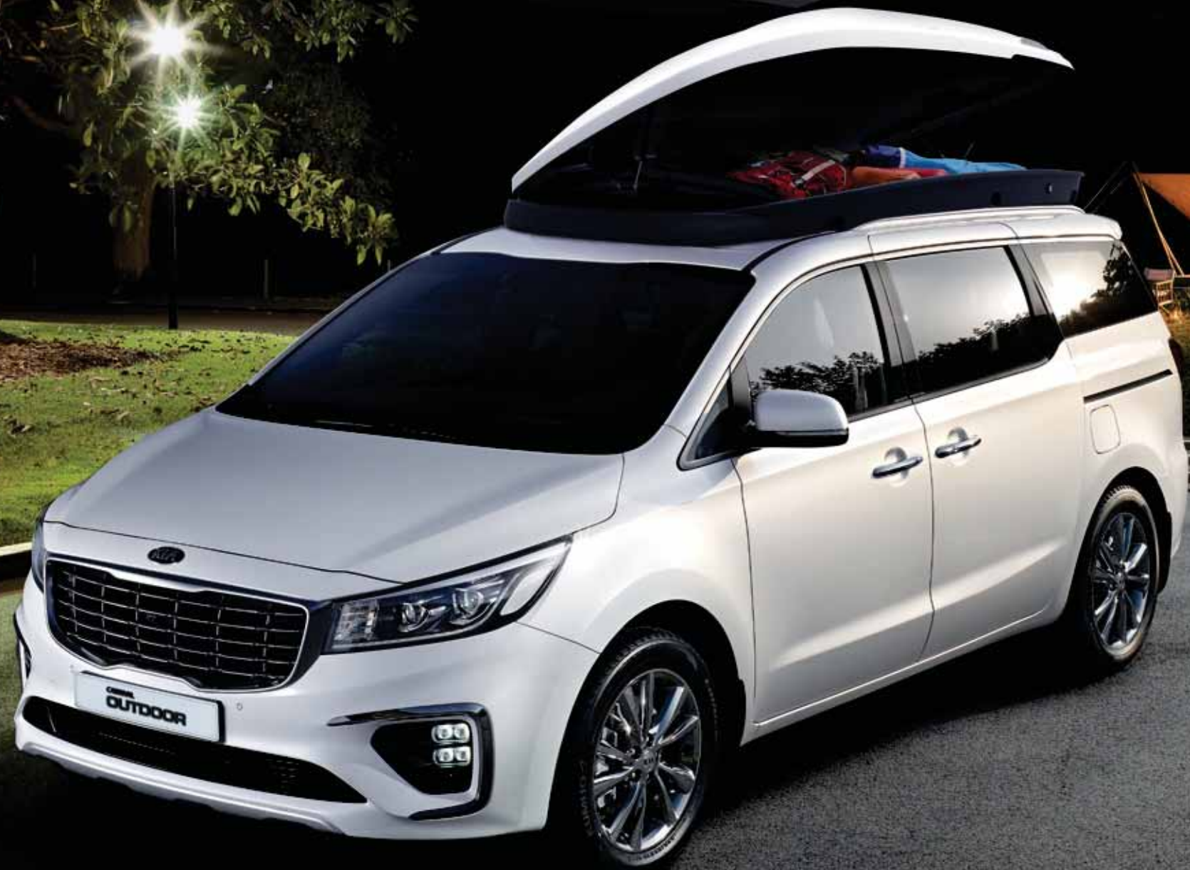
CARNIVAL OUTDOOR 9인승, 스노우 화이트 펠(SWP)