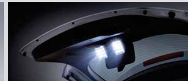
테일게이트 LED 라이트