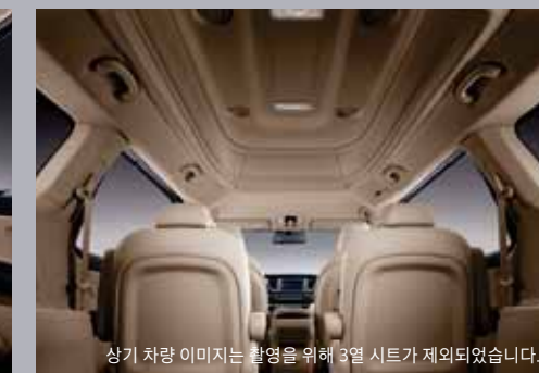
상기 차량 이미지는 촬영을 위해 3열 시트가 제외되었습니다.

상기 사양구성은 트림, 인승 모델별, 엔진, 선택 사양에 따라 다르게 적용됩니다.