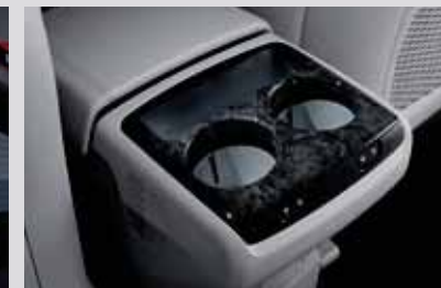
1~2열 냉·온 컵홀더