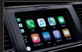
스마트 내비게이션 SmartNav UVO 3.0