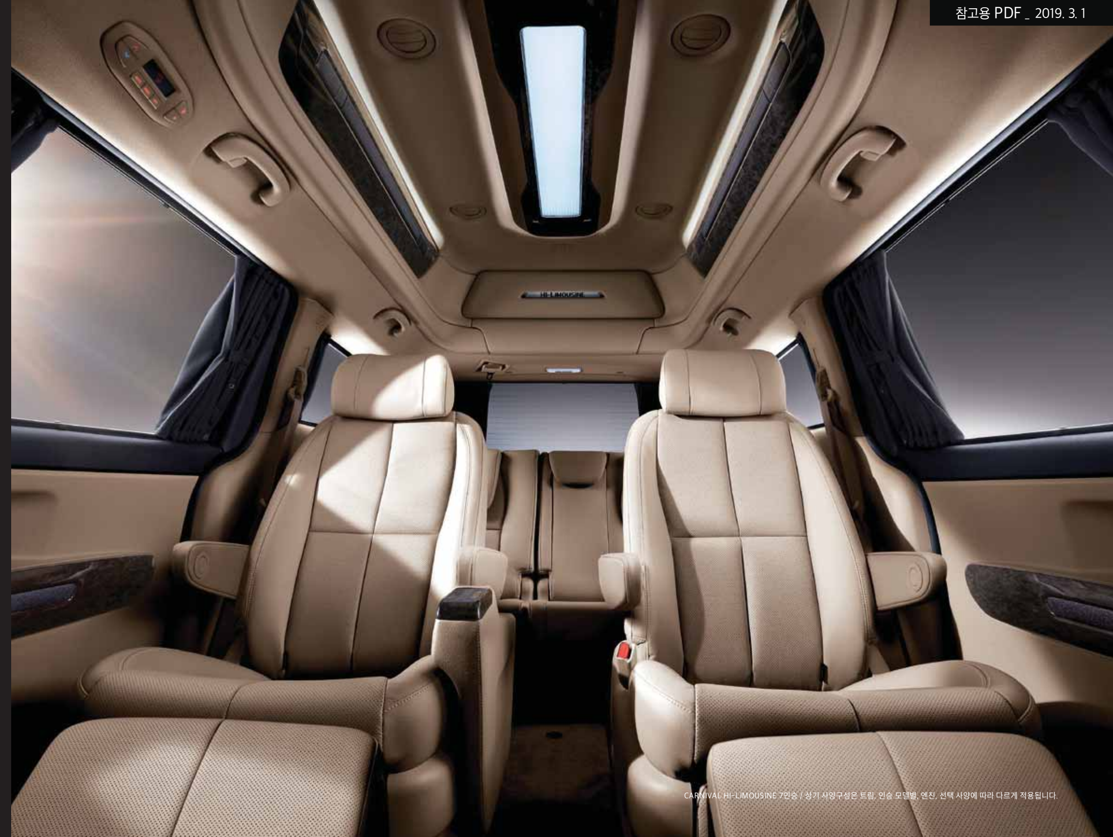
CARNIVAL HI-LIMOUSINE 7인승 / 상기 사양구성은 트림, 인승 모델별, 엔진, 선택 사양에 따라 다르게 적용됩니다.