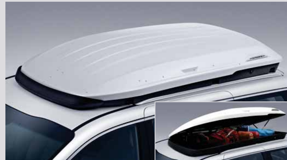
차체 밀착형 루프박스