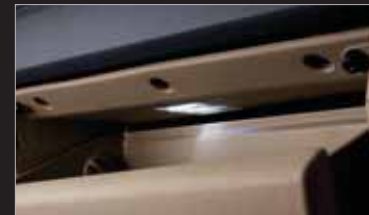
글로브박스 LED 램프