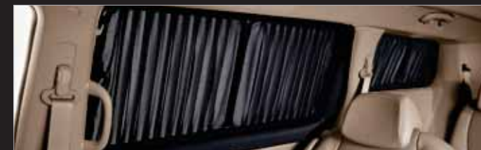
주름식 커튼 (1열 제외)