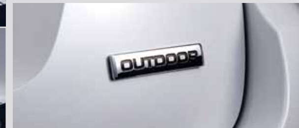
아웃도어 전용 엠블럼