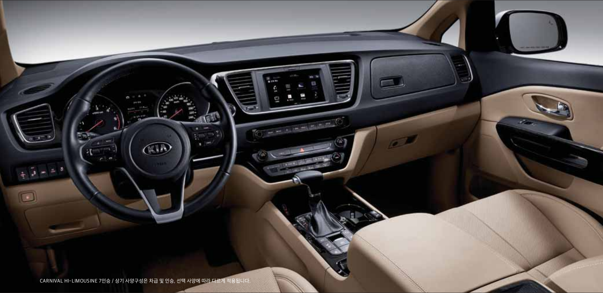
CARNIVAL HI-LIMOUSINE 7인승 / 상기 사양구성은 차급 및 인승, 선택 사양에 따라 다르게 적용됩니다.

운전자를 위한 최적의 공간활용, 모두를 배려한 첨단 사양으로 품격, 그 이상의 만족을 누리실 수 있습니다.