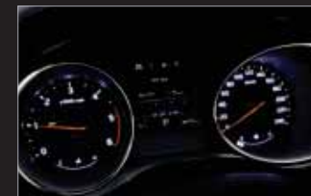
슈퍼비전 클러스터 (7인치 컬러 TFT LCD)