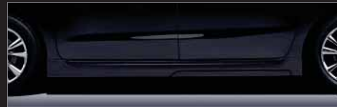
사이드 에어댐 (7/9인승)