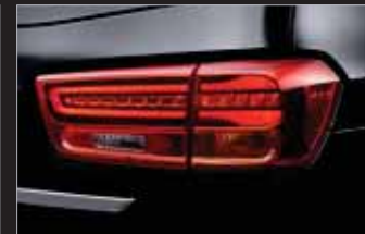
LED 리어컴비네이션 램프