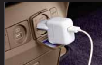
220V 인버터 (200W)