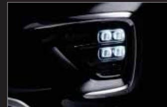
LED 안개등 (7/9인승)