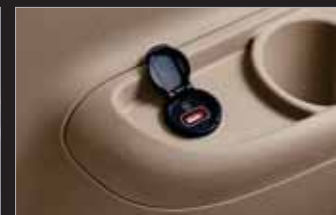
3열 USB 충전기