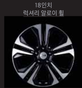
18인치 럭셔리 알로이 휠

*에는 이해를 돕기 위한 가상 이미지가 사용되었습니다. / 상기 사양구성은 트림, 인승 모델별, 엔진, 선택 사양에 따라 다르게 적용됩니다.