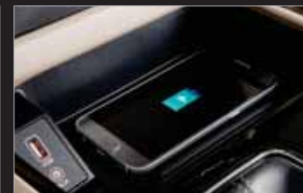
휴대폰 무선충전 시스템