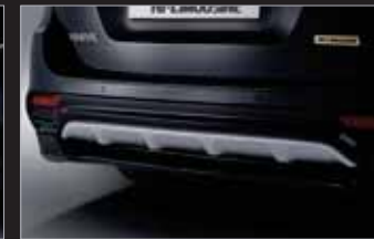
후면 범퍼가드 (7/9인승)