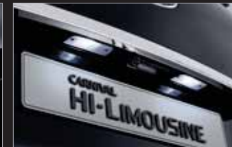
LED 번호판 램프