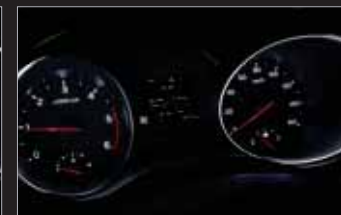
고급형 클러스터 (3.5인치 모노 TFT LCD)