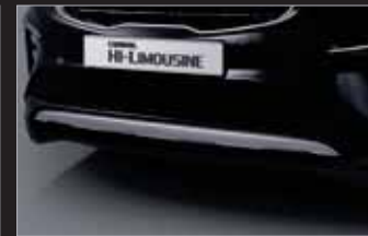
전면 범퍼가드 (7/9인승)