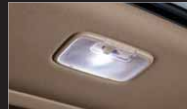
러기지 LED 램프