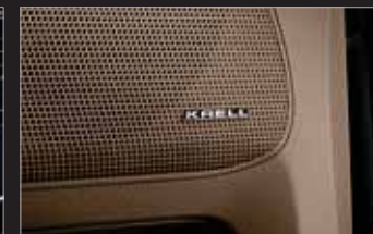
KRELL 프리미엄 사운드