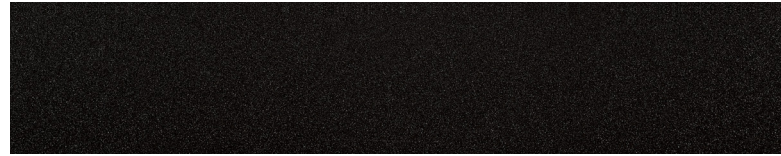
오로라 블랙 펄 (ABP)