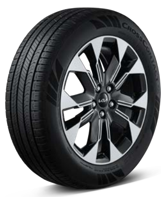
19인치 전면가공 휠