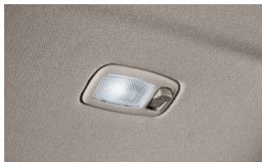
선바이저 LED 램프