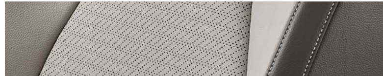
코튼 베이지 (나파가죽)