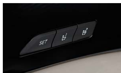
운전 자세 메모리 시스템