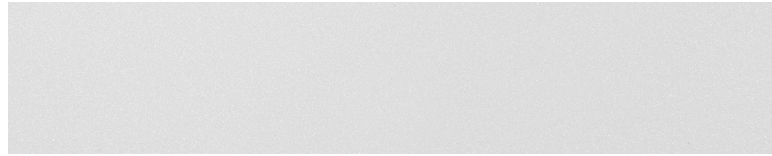
스노우 화이트 펄 (SWP)