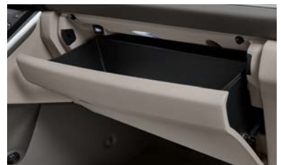
글로브박스 LED 램프