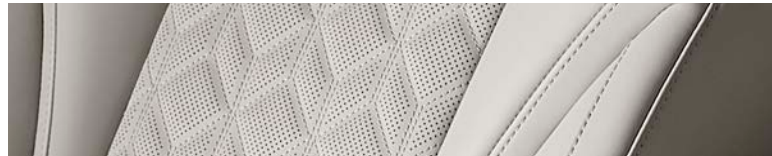
코튼 베이지 (퀵팅 나파가죽 - 4인승 후석 전용)