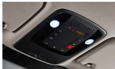
오버헤드콘솔 LED 램프