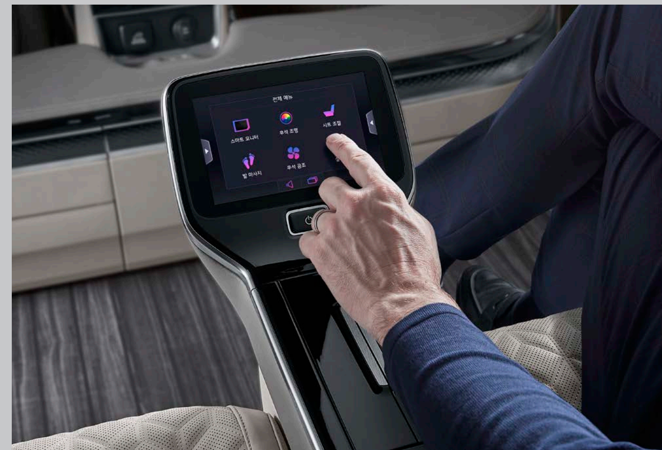
상기 사양구성은 4인승으로 촬영되었으며 트림, 인승모델별, 엔진, 선택 사양에 따라 다르게 적용됩니다.

프리미엄 기능들을 통해 차원이 다른 여유와 함께하는 라이프 스타일을 선사합니다. 7인치 터치식 통합 컨트롤러를 통해 스마트 모니터, 리무진 시트, 발마사지기 등을 간편하게 컨트롤하고, 4인승 전용 후석 리무진 시트에 앉아 바쁜 일상 속 독립된 공간에서의 편안한 휴식을 느껴보세요.