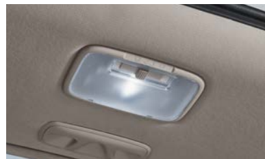
러기지 LED 램프