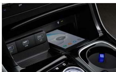
스마트폰 무선충전 시스템