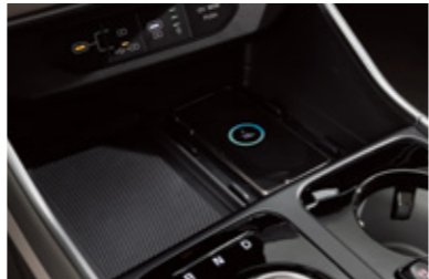
스마트폰 무선 충전시스템