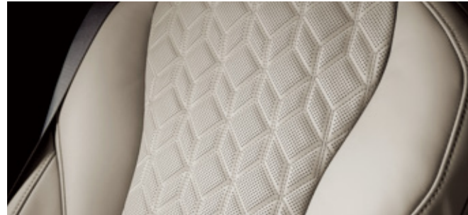
코튼 베이지 (퀵팅 나파가죽 - 4인승 후석 전용)