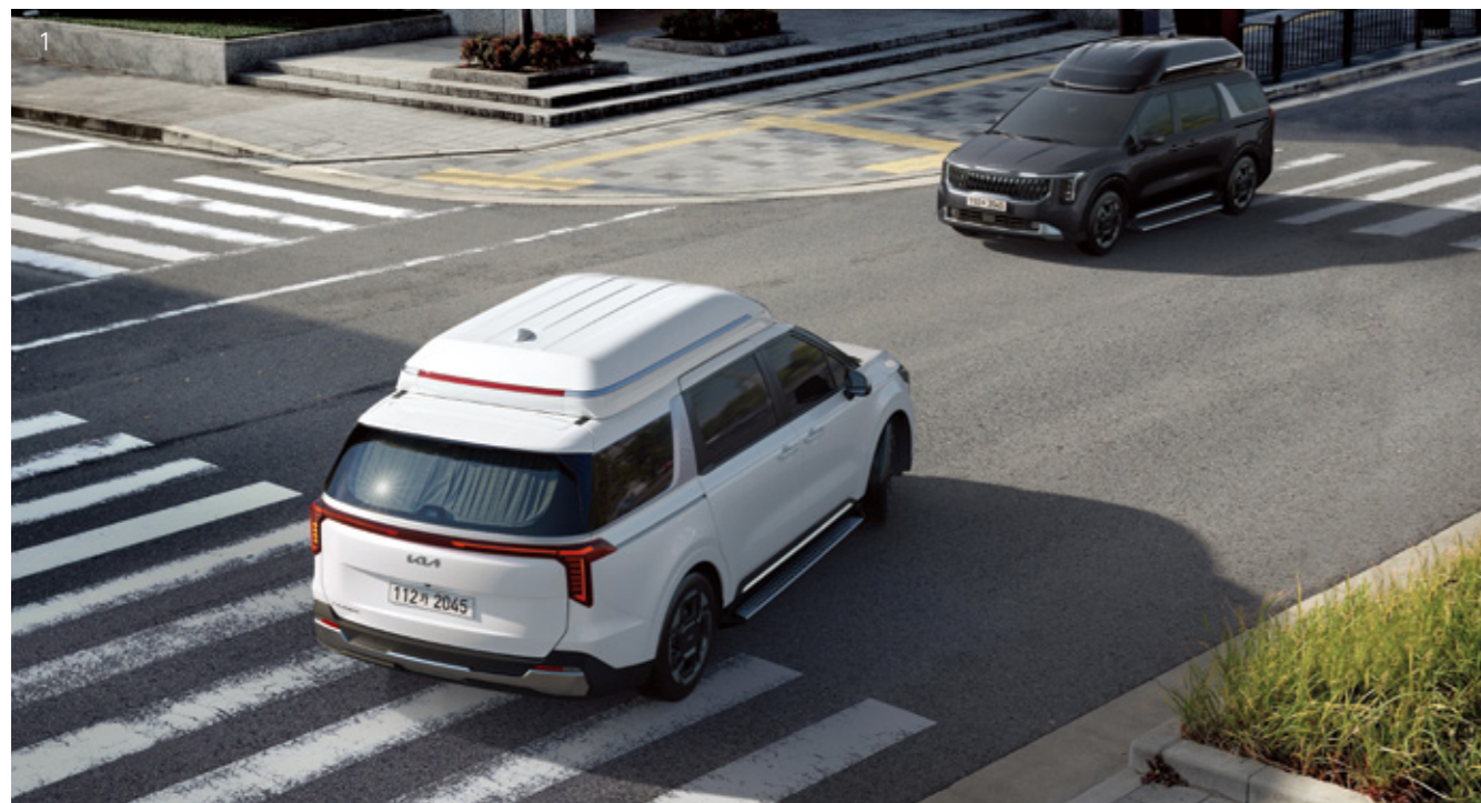
1. 전방 충돌방지 보조

주행 중 주변 상황을 살피고, 충돌 위험 발생 시 경고를 하며, 경고 후 선행 차량이 갑자기 속도를 줄이거나, 전방에 차량, 이륜차, 보행자 및 자전거 탑승자와 충돌 위험이 높아지면 자동으로 제동을 도와줍니다. 교차로에서 방향지시등 스위치를 켜고 좌회전 중, 맞은편에서 다가오는 차량, 이륜차 혹은 교차로에서 직진 중 교차로 좌/우측에서 다가오는 차량과 충돌 위험이 높아지면 자동으로 제동을 도와줍니다. 또한, 차로 내 주행 중, 정면 맞은편에서 다가오는 차량 및 이륜차와 충돌 위험이 높아지면 자동으로 제동을 도와주며, 차로 변경 중, 맞은편에서 다가오는 차량 및 이륜차 혹은 옆 차로의 선행 차량 및 이륜차와 충돌 위험 발생 시 자동으로 회피 조항을 도와줍니다. 전방 차로 가장자리에 있는 차량, 이륜차, 보행자 및 자전거 탑승자 혹은 차로 변경 중 후측방에 있는 차량 및 이륜차와 충돌 위험 발생 시 자동으로 회피 조항을 도와줍니다.