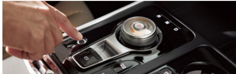
지문 인증 시스템