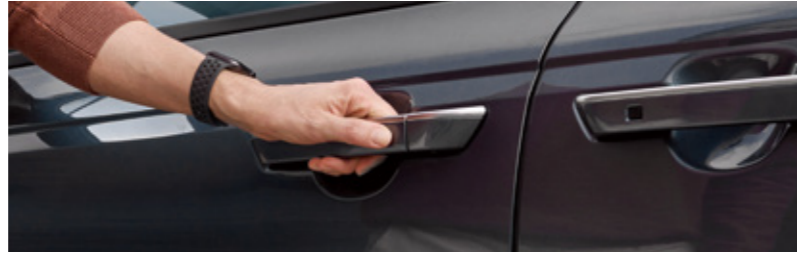
기아 디지털 키 2