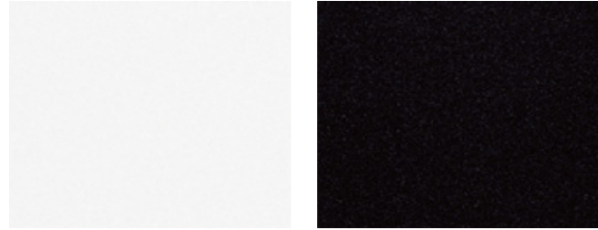
스노우 화이트 펄 (SWP) 오로라 블랙 펄 (ABP)