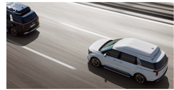
5. 내비게이션 기반 스마트 크루즈 컨트롤

고속도로 및 자동차 전용 도로 주행 시 도로 상황에 맞춰 안전한 속도로 주행하도록 도와줍니다. 안전 속도, 곡선로 및 진출입로 구간에 진입하기 전에 속도를 자동으로 줄여주고, 이후 안전속도, 곡선로 및 진출입 구간을 지나면 원래 설정한 속도로 복귀합니다.