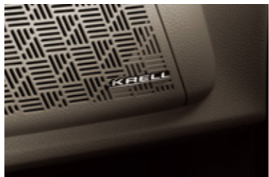
KRELL 프리미엄 사운드