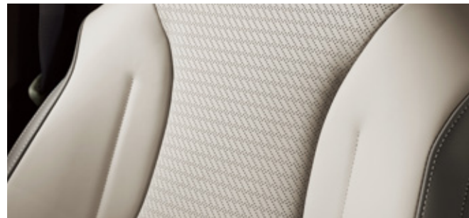
코튼 베이지 (나파가죽)