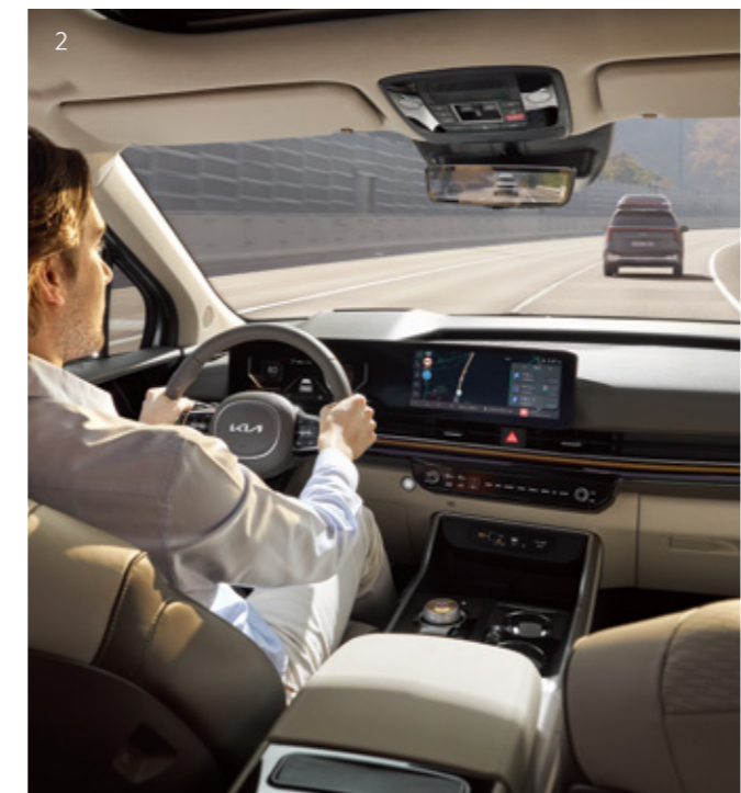
2. 고속도로 주행 보조 2

주행 중 주변 상황을 살피고, 충돌 위험 발생 시 경고를 하며, 경고 후 선행 차량이 갑자기 속도를 줄이거나, 전방에 차량, 이륜차, 보행자 및 자전거 탑승자와 충돌 위험이 높아지면 자동으로 제동을 도와줍니다. 교차로에서 방향지시등 스위치를 켜고 좌회전 중, 맞은편에서 다가오는 차량, 이륜차 혹은 교차로에서 직진 중 교차로 좌/우측에서 다가오는 차량과 충돌 위험이 높아지면 자동으로 제동을 도와줍니다. 또한, 차로 내 주행 중, 정면 맞은편에서 다가오는 차량 및 이륜차와 충돌 위험이 높아지면 자동으로 제동을 도와주며, 차로 변경 중, 맞은편에서 다가오는 차량 및 이륜차 혹은 옆 차로의 선행 차량 및 이륜차와 충돌 위험 발생 시 자동으로 회피 조항을 도와줍니다. 전방 차로 가장자리에 있는 차량, 이륜차, 보행자 및 자전거 탑승자 혹은 차로 변경 중 후측방에 있는 차량 및 이륜차와 충돌 위험 발생 시 자동으로 회피 조항을 도와줍니다.