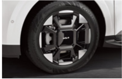
19인치 전면가공 휠