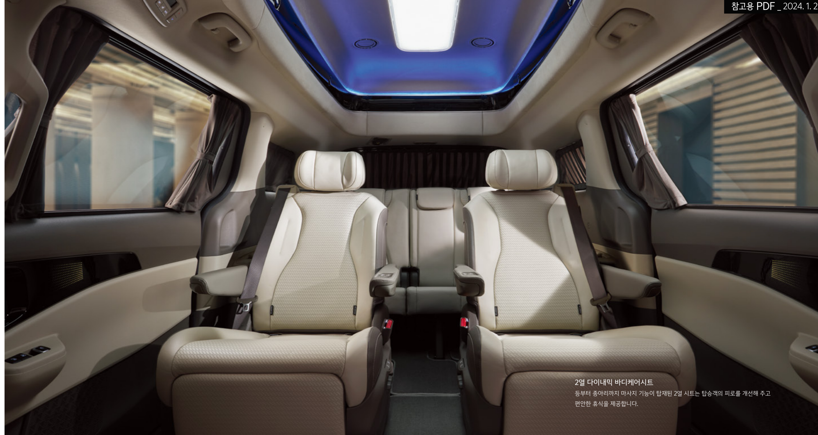
2열 다이내믹 바디케어시트 등부터 종아리까지 마사지 기능이 탑재된 2열 시트는 탑승객의 피로를 개선해 주고 편안한 휴식을 제공합니다.