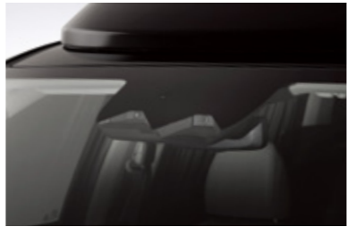
빌트인 캠 2