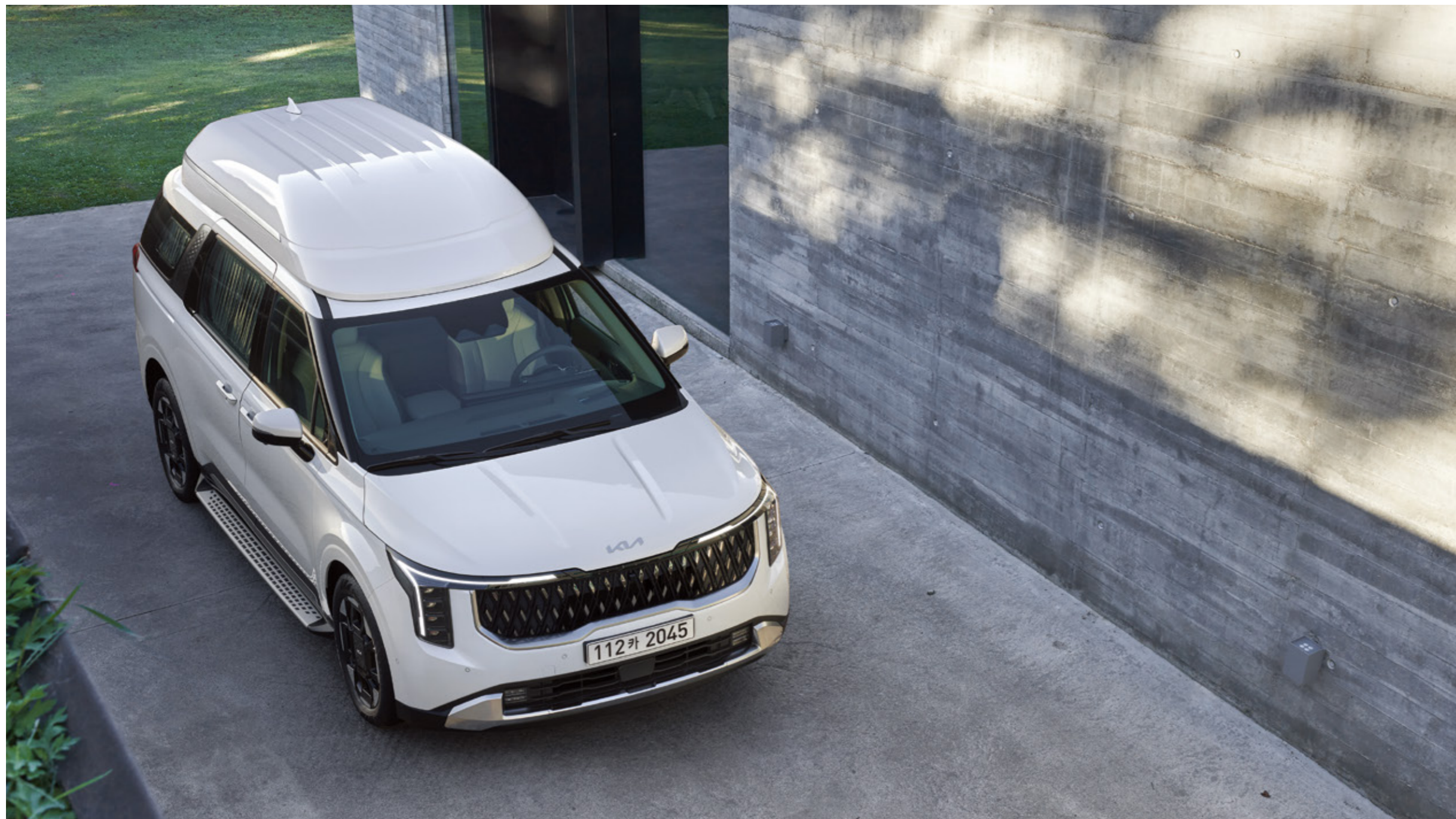
스노우 화이트 펄 (SWP) / 상기 사양구성은 7인승으로 촬영되었으며 트림, 인승 모델별, 엔진, 선택 사양에 따라 다르게 적용됩니다.