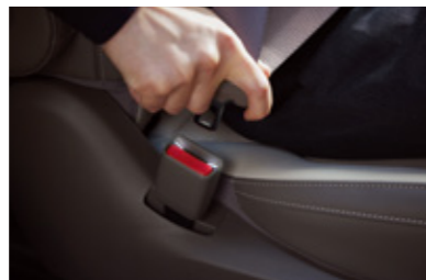
2열 시트벨트 버클 조명