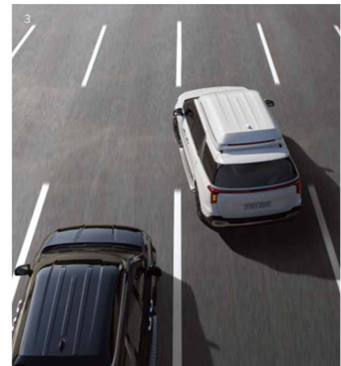
3. 후측방 충돌방지 보조

고속도로 및 자동차 전용 도로 주행 시 앞차와의 거리를 유지하며 운전자가 설정한 속도로 곡선로에서도 차로 중앙을 유지하며 주행하도록 도와줍니다. 주행 중 옆 차량과 가까워지는 경우 위험하지 않도록 차로 내 편향 주행을 합니다. 일정 속도 이상으로 주행 시, 스티어링 휠을 잡고 방향지시등 스위치를 변경하고자 하는 차로 방향으로 움직이면 자동으로 차로를 변경해 줍니다.