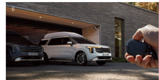
6. 원격 스마트 주차 보조

고속도로 및 자동차 전용 도로 주행 시 도로 상황에 맞춰 안전한 속도로 주행하도록 도와줍니다. 안전 속도, 곡선로 및 진출입로 구간에 진입하기 전에 속도를 자동으로 줄여주고, 이후 안전속도, 곡선로 및 진출입 구간을 지나면 원래 설정한 속도로 복귀합니다.