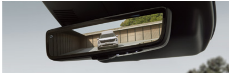
디지털 센터 미러