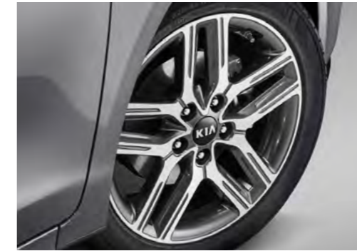
17인치 전면가공 휠