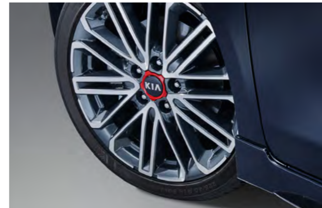
18인치 전면가공 휠

1.6 T-GDI 가솔린 엔진과 7단 DCT로 파워풀한 성능과 다이내믹한 변속, 경쾌한 스피드를 구현하다.