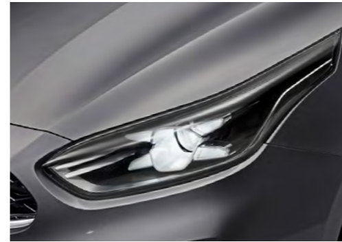
LED 헤드램프, LED DRL