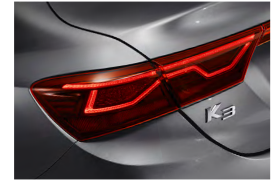
Arrow-Line LED 리어 콤비네이션램프