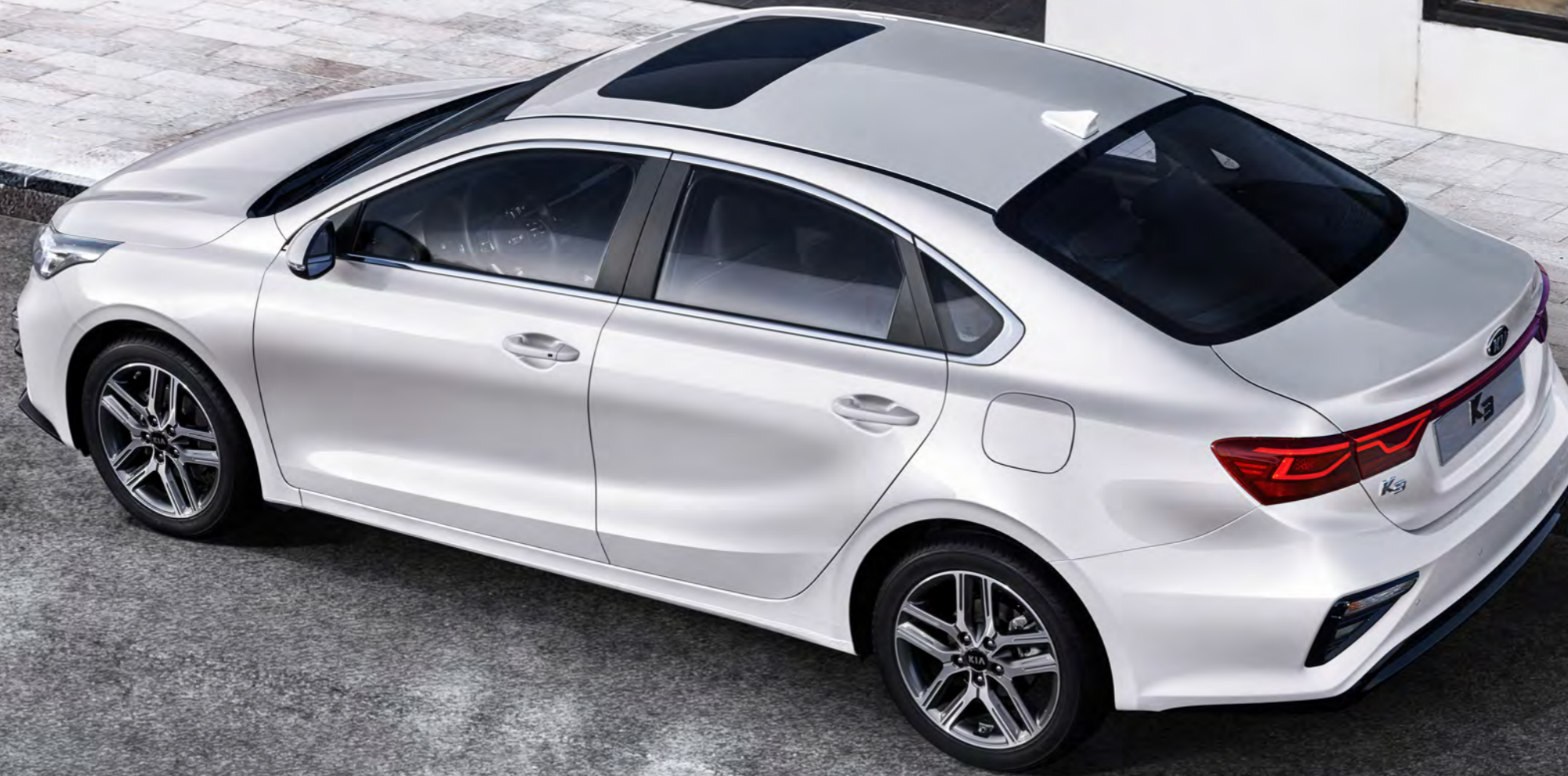
K3 1.6 기솔린 | 스노우 화이트 펄 (SWP)