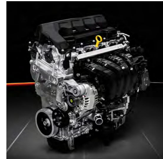
스마트스트림 G1.6 엔진

통합 열관리 시스템, 마찰 저감 엔진 무빙 시스템 적용을 통해 연소 효율 및 연비를 개선시키고 배출 가스량을 감소시킨 친환경 차세대 엔진입니다.