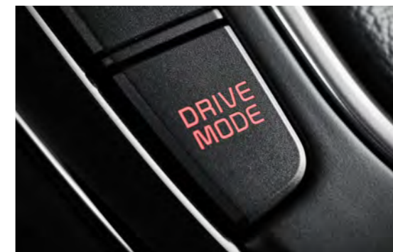
주행모드 통합제어 시스템

새로운 변속 로직을 통해 주행감을 개선시키고, 내구성을 강화한 차세대 변속기입니다.