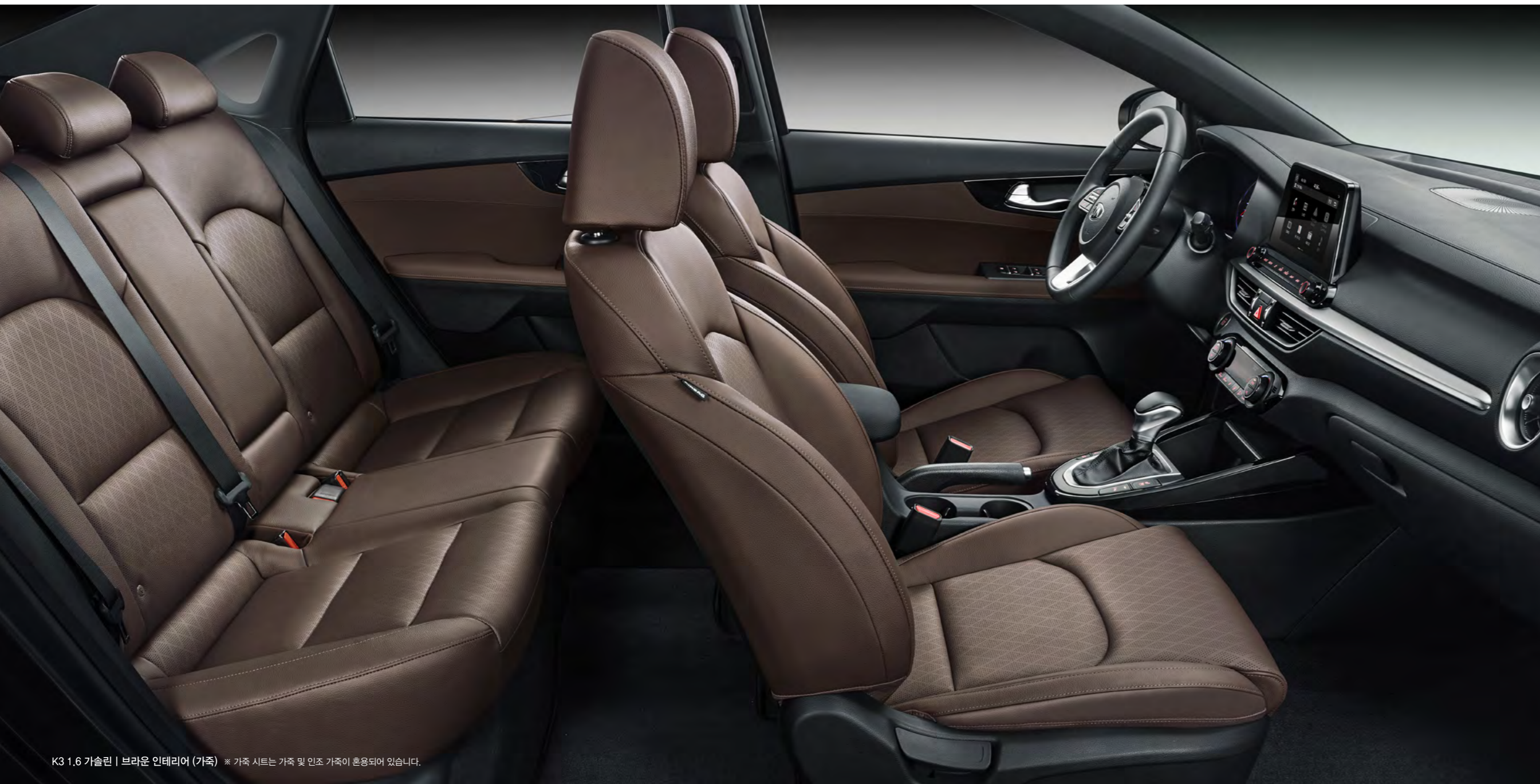
K3 1.6 가솔린 | 브라운 인테리어 (가죽) * 가죽 시트는 가죽 및 인조 가죽이 혼용되어 있습니다.

스마트한 기능과 섬세한 디테일로 이성과 감성이 조화로운 공간을 완성하다.