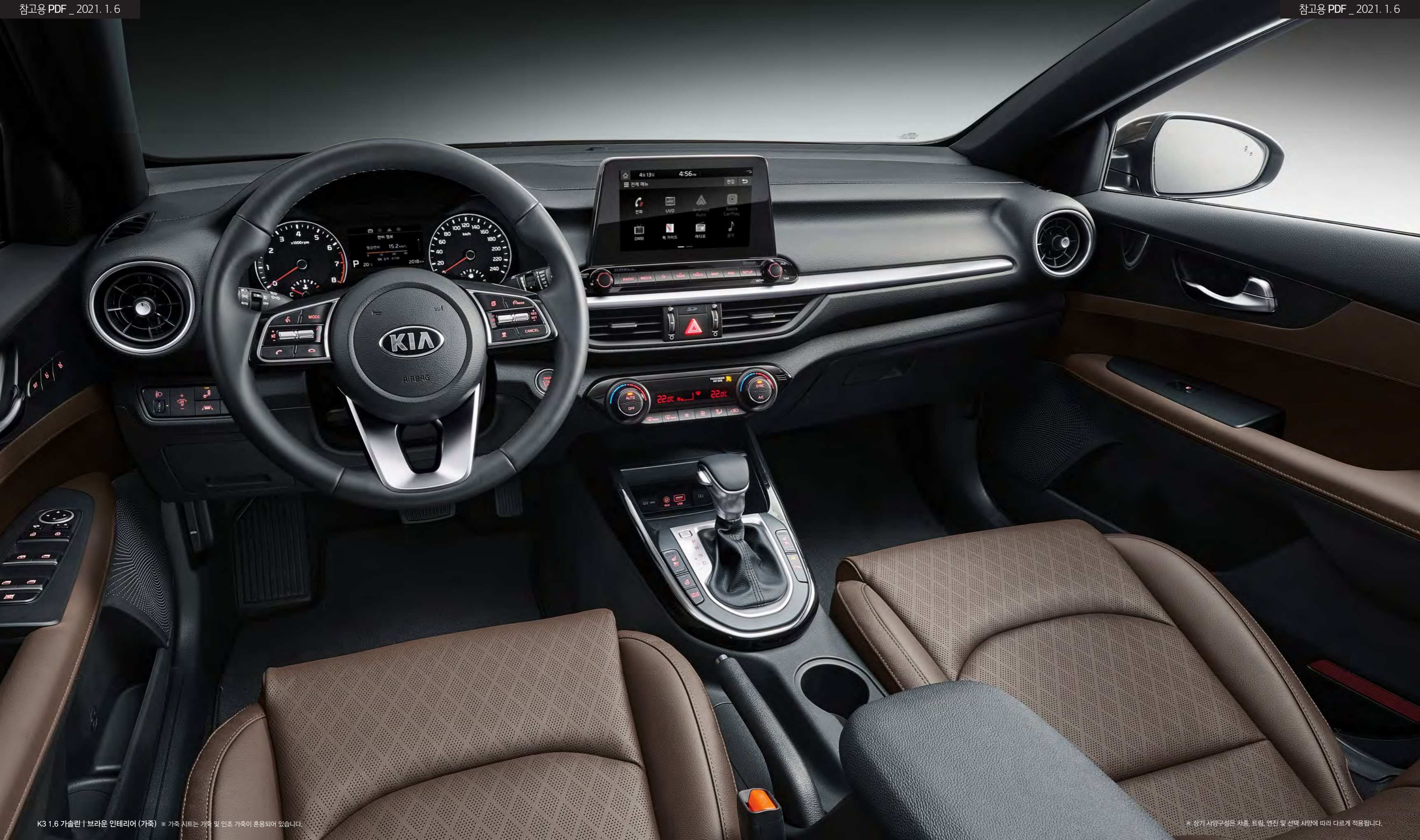
K3 1.6 가솔린 | 브라운 인테리어 (가죽) * 가죽 시트는 가죽 및 인조 가죽이 혼용되어 있습니다.