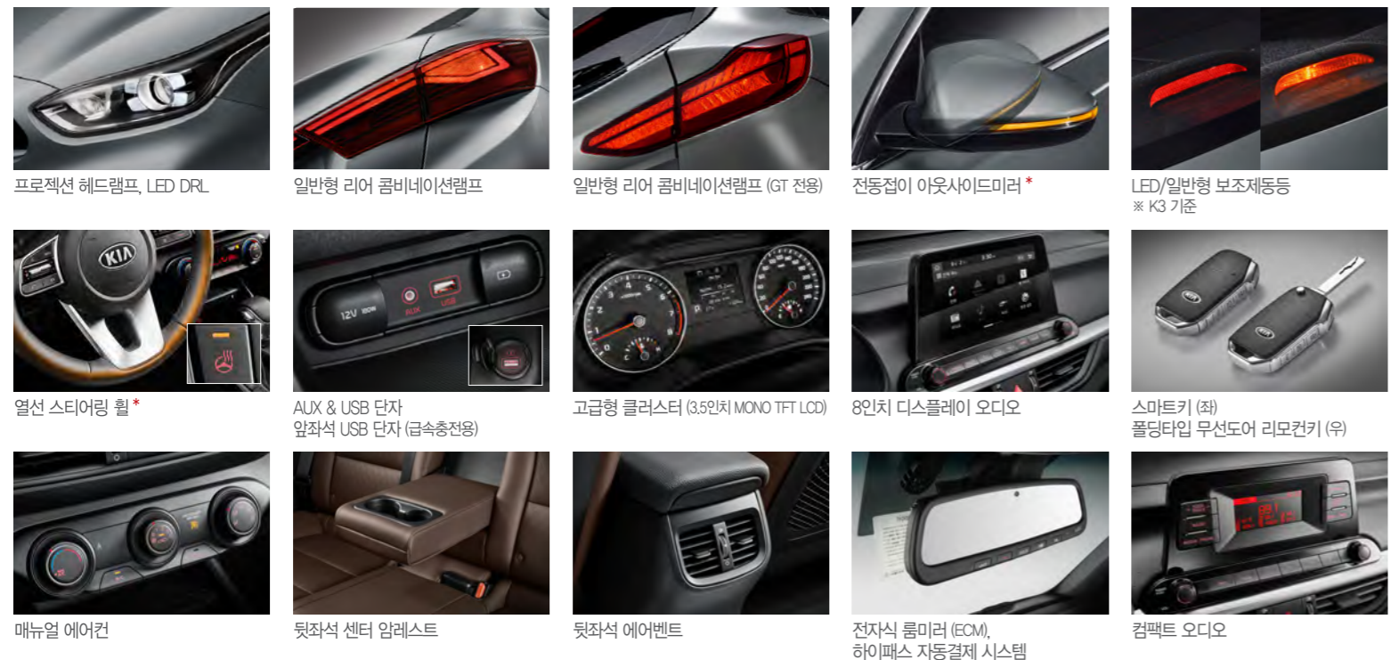
프로젝션 헤드램프, LED DRL