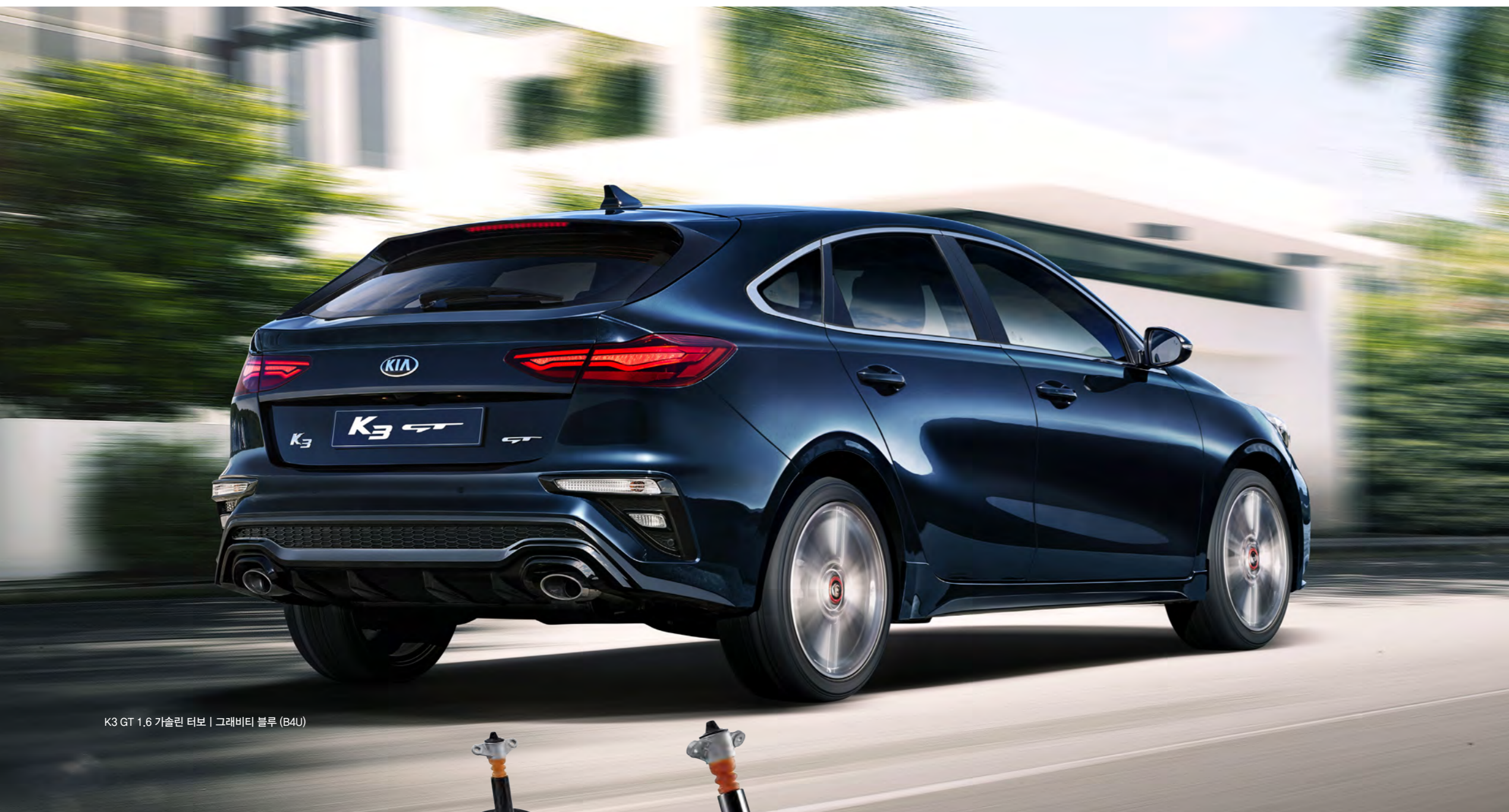
K3 GT 1.6 가솔린 터보 | 그래비티 블루 (B4U)