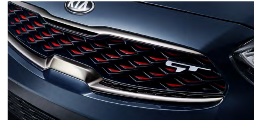
다크 크롬 레드포인트 라디에이터 그릴 & GT 엠블럼