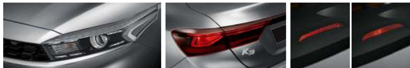
프로젝션 헤드램프, LED DRL 일반형 리어 콤비네이션램프 LED/일반형 보조제동등