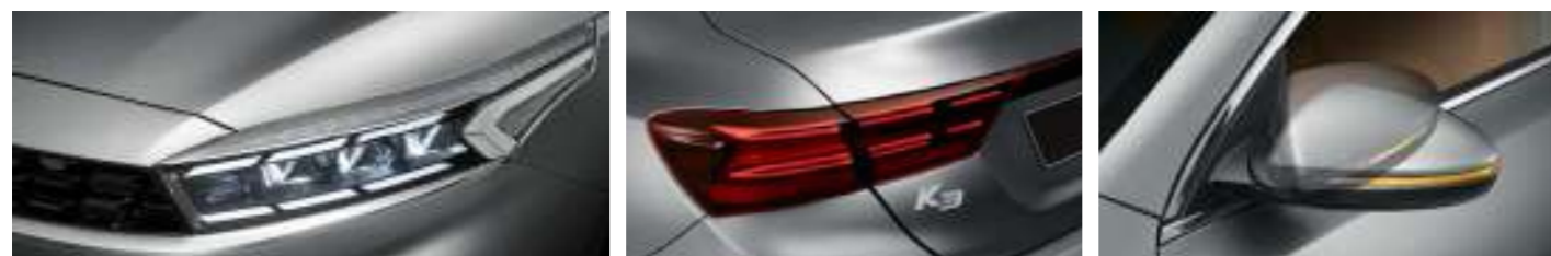
LED 헤드램프, LED DRL LED 리어 콤비네이션램프 전동접이 아웃사이드미러 *