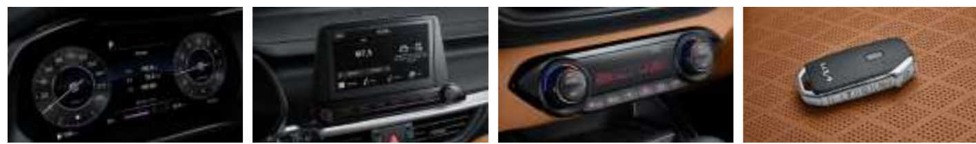
슈퍼비전 클러스터 (10.25인치 칼라 TFT LCD) 8인치 디스플레이 오디오 (GT 전용) 독립제어 풀오토 에어컨 스마트키 (원격시동 포함)