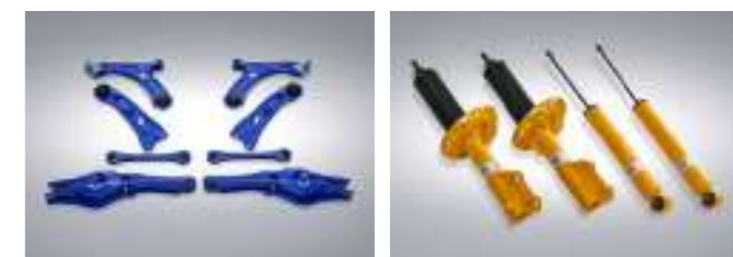
강화부시 컨트롤암 빌스타인 모노튜브 속업소버