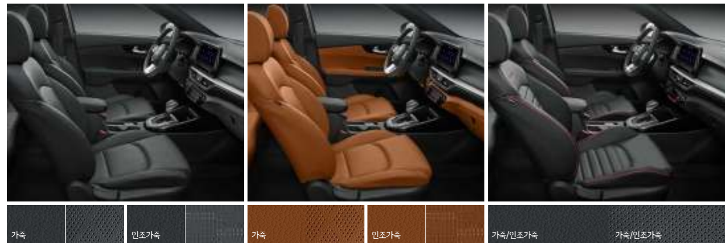
블랙 원톤 인테리어 (가죽/인조가죽) 오렌지 브라운 투톤 인테리어 (가죽/인조가죽) 블랙 인테리어 (가죽/인조가죽) / GT 전용