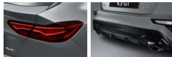
LED 리어 콤비네이션램프 듀얼 머플러