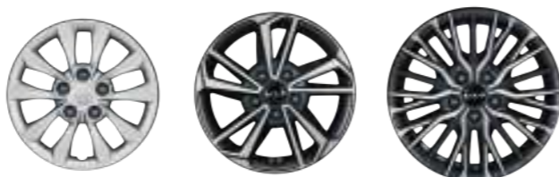
15인치 스틸 휠 (폴사이즈 휠커버) 16인치 전면가공 휠 17인치 전면가공 휠