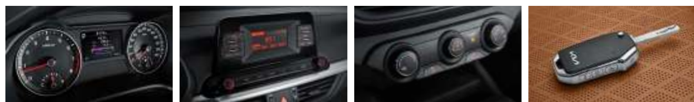
고급형 클러스터 (4.2인치 칼라 TFT LCD) 컴팩트 오디오 매뉴얼 에어컨 풀딩타입 무선도어 리모컨키