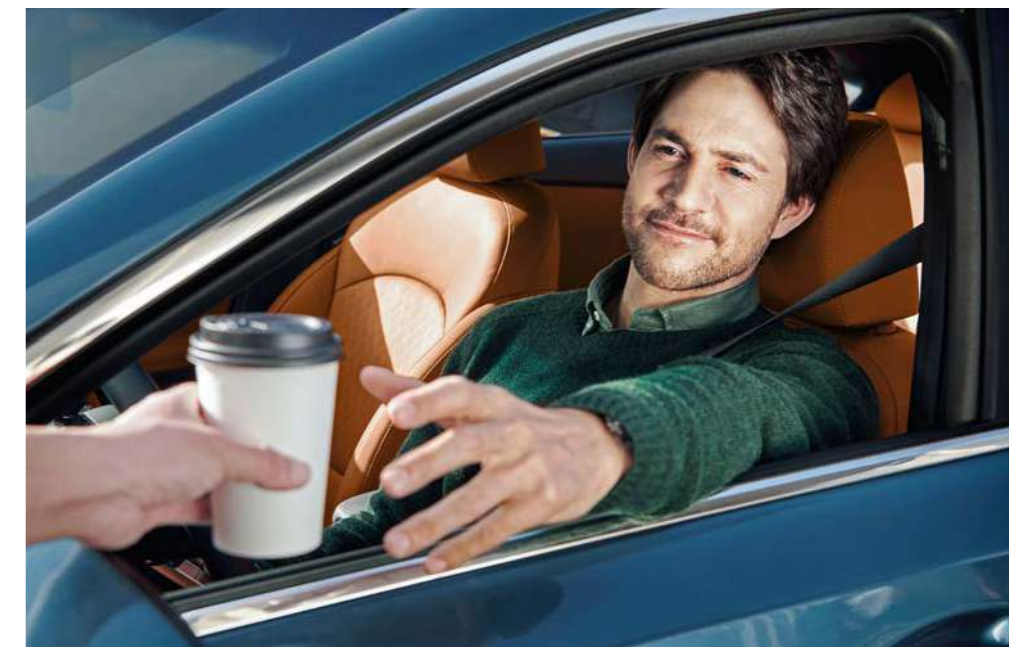
스마트스트림 G1.6 엔진

하루를 시속 100Km로만 달릴 수는 없겠지. 가끔은 느긋하게 멈추고 지금 이 순간만 누릴 수 있는 여유를 만끽한다.