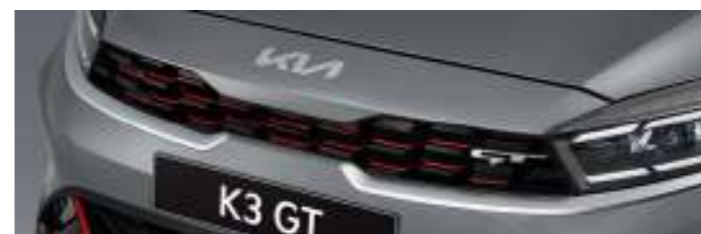
LED 리어 콤비네이션램프 레드포인트 크롬 라디에이터 그릴