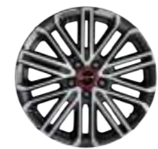
18인치 전면가공 휠