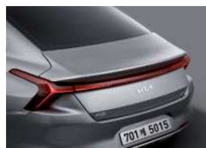
LED 리어 콤비네이션램프