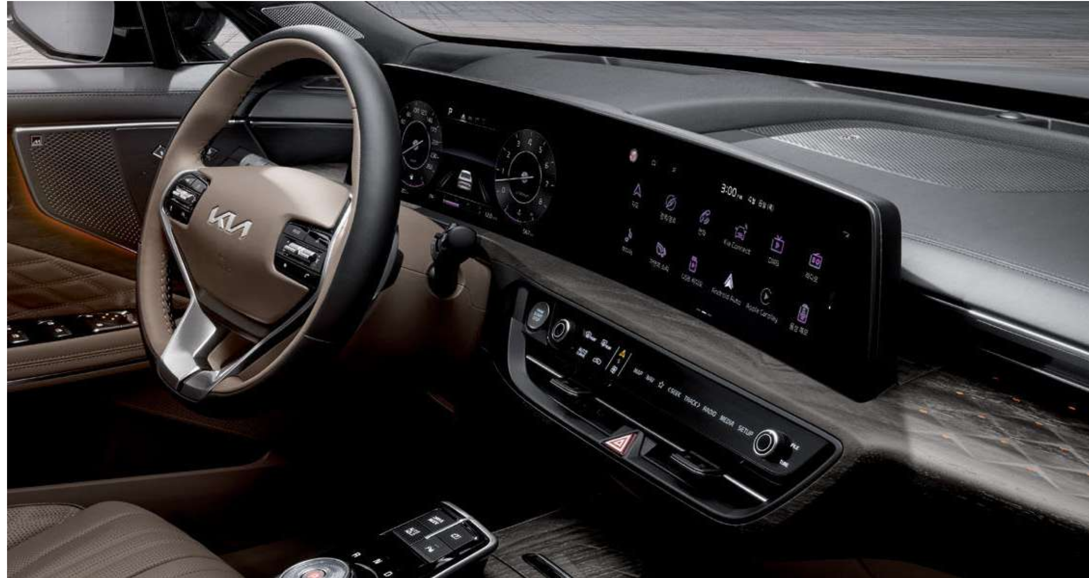
파노라믹 커브드 디스플레이