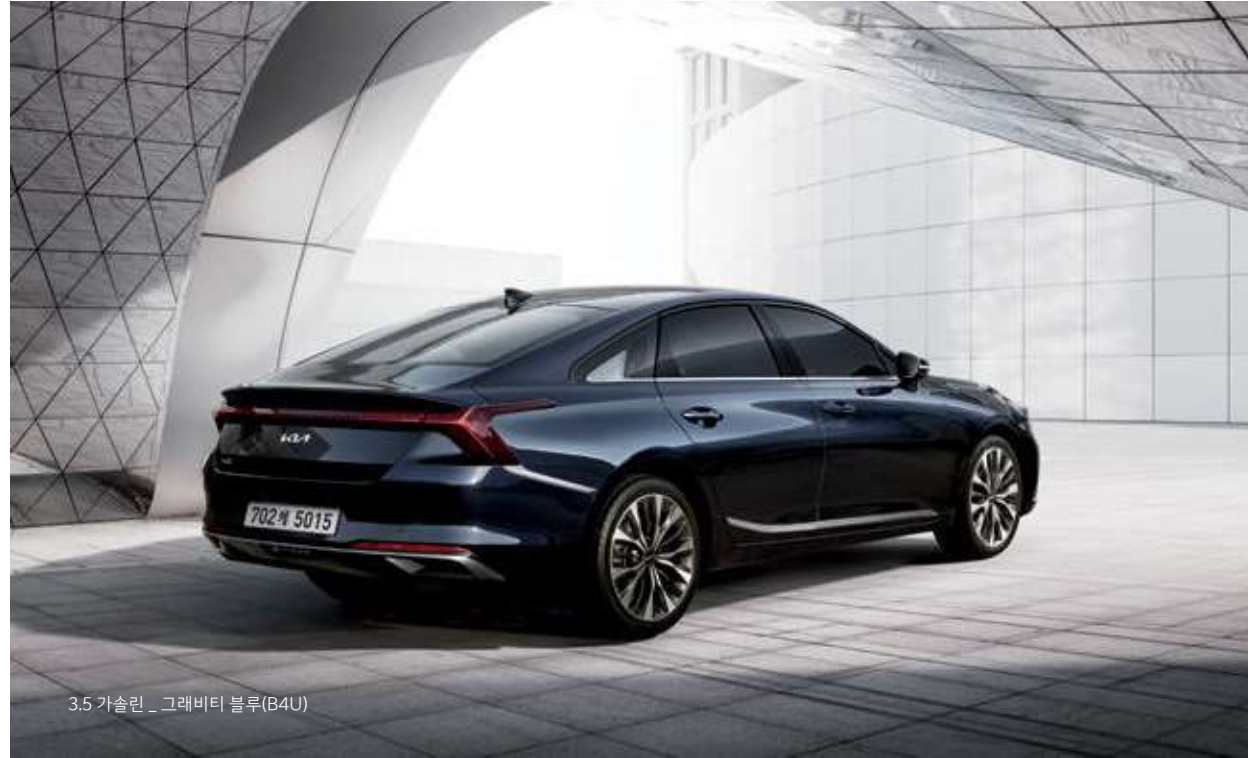
3.5 가솔린 _ 그래비티 블루(B4U)

자동차의 디자인은 그저 아름다워야 하는 것이 아니라 함께 하는 이의 삶을 담아낼 수 있어야 합니다. 물 위를 달리는 고급 요트에서 모티브를 얻은 패스트백 타입 실루엣은 역동적인 인상을 남기고 매끈하게 다듬어진 사이드 캐릭터 라인은 당신의 고급스러운 취향과 감성을 보여줍니다. K8의 혁신적인 아름다움이 디자인을 넘어 하나의 새로운 라이프가 되는 순간입니다.