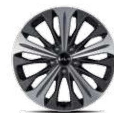
18인치 전면가공 휠