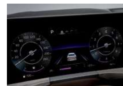
슈퍼비전 클러스터 (12.3인치 칼라 TFT LCD)