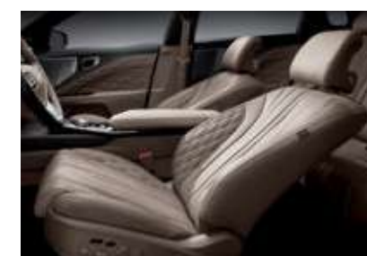
앞좌석 릴렉션 콤포트 시트