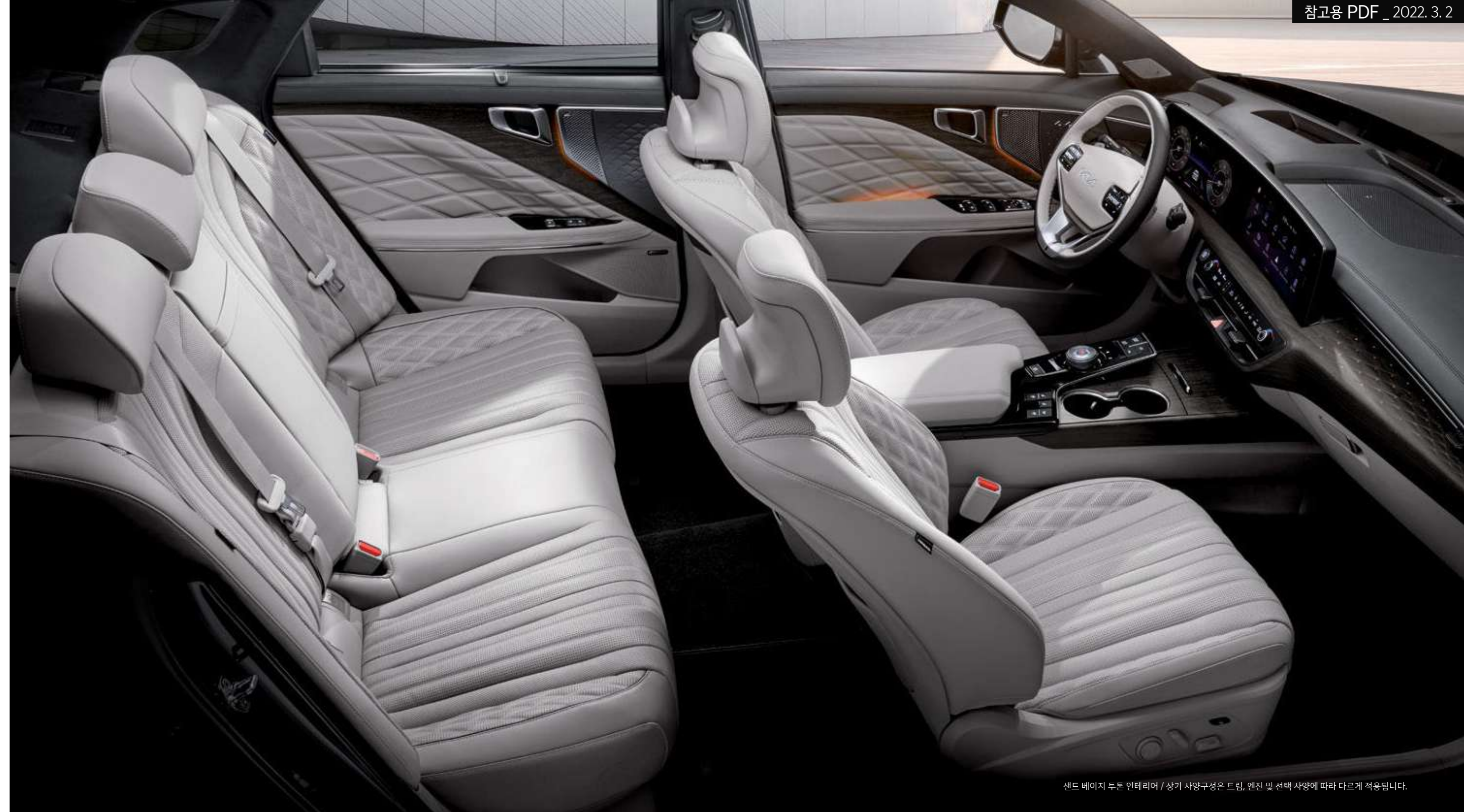
샌드 베이지 투톤 인테리어 / 상기 사양구성은 트림, 엔진 및 선택 사양에 따라 다르게 적용됩니다.