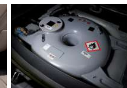
원형 봄베 (3.5 LPI 엔진)