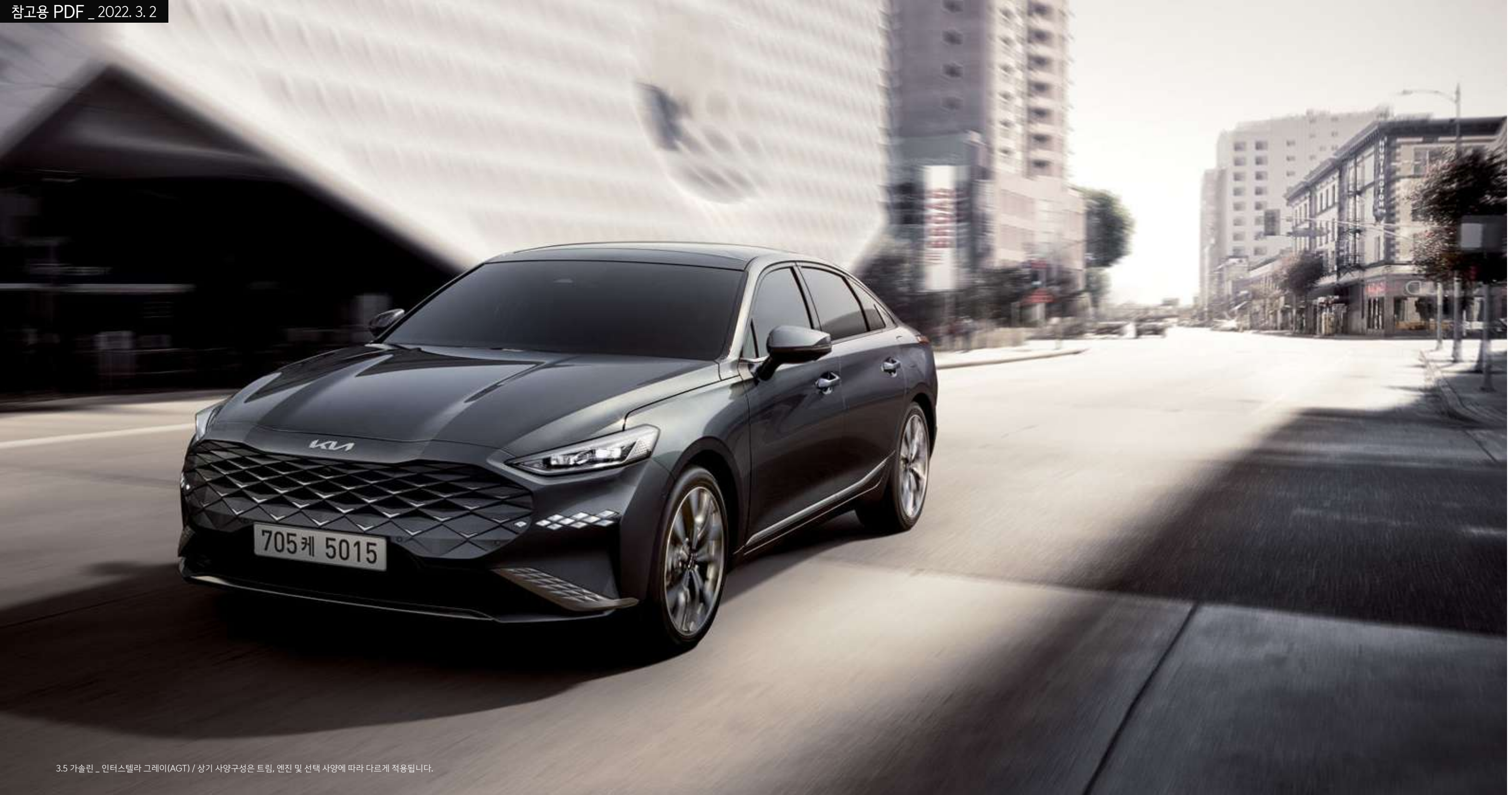
3.5 가솔린 _ 인터스텔라 그레이(AGT) / 상기 사양구성은 트림, 엔진 및 선택 사양에 따라 다르게 적용됩니다.