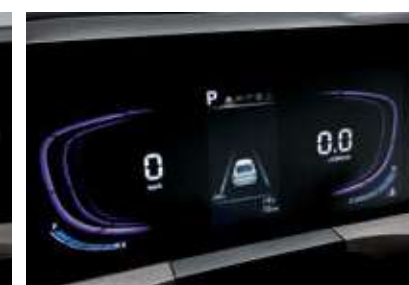
슈퍼비전 클러스터 (4.2인치 칼라 TFT LCD)