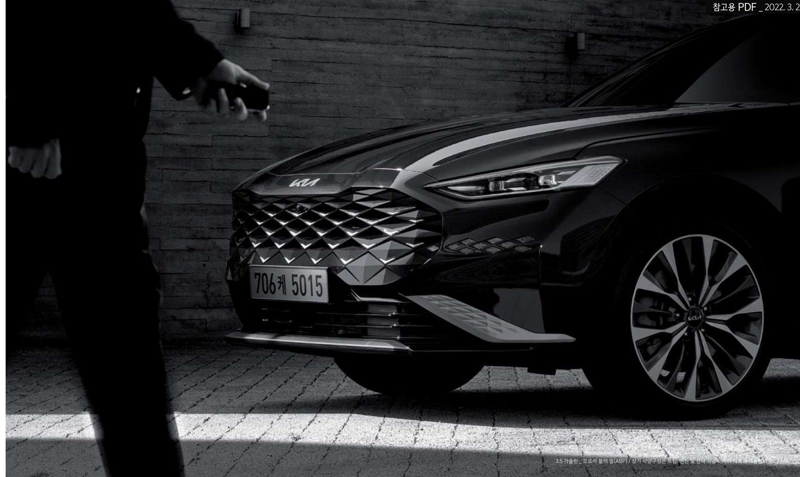
3.5 가솔린 _ 오로라 블랙 펠(ABP) / 상기 사양구성은 트림, 엔진 및 선택 사양에 따라 다르게 적용됩니다.