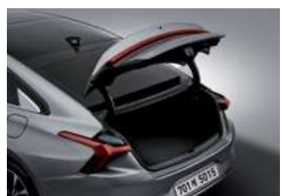
전동식 세이프티 파워 트렁크