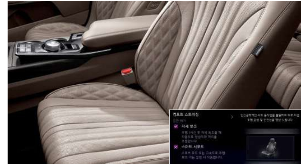
퀼팅 나파가죽시트 에르고 모션 시트