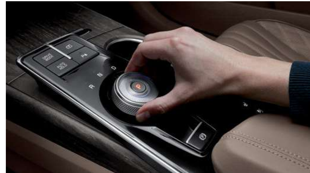
고급 우드그레인 & 앰비언트 라이트 전자식 변속 다이얼