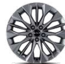
19인치 스포터링 휠