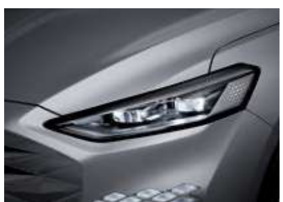
프로젝션 LED 헤드램프