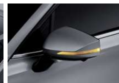
LED 리피터 일체형 아웃사이드 미러