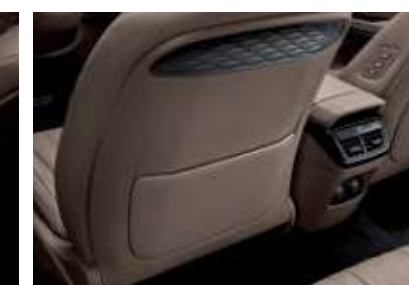
시트백 포켓 (보드타입)