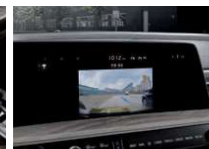
빌트인 캠 (보조 배터리 포함)