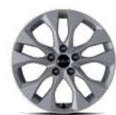
17인치 알로이 휠

볼수록 아름답고 사용할수록 만족스러운 경험들이 평범한 일상 안에서 새로운 즐거움으로 다가옵니다.