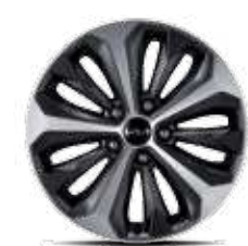
17인치 전면가공 휠 (하이브리드 전용)