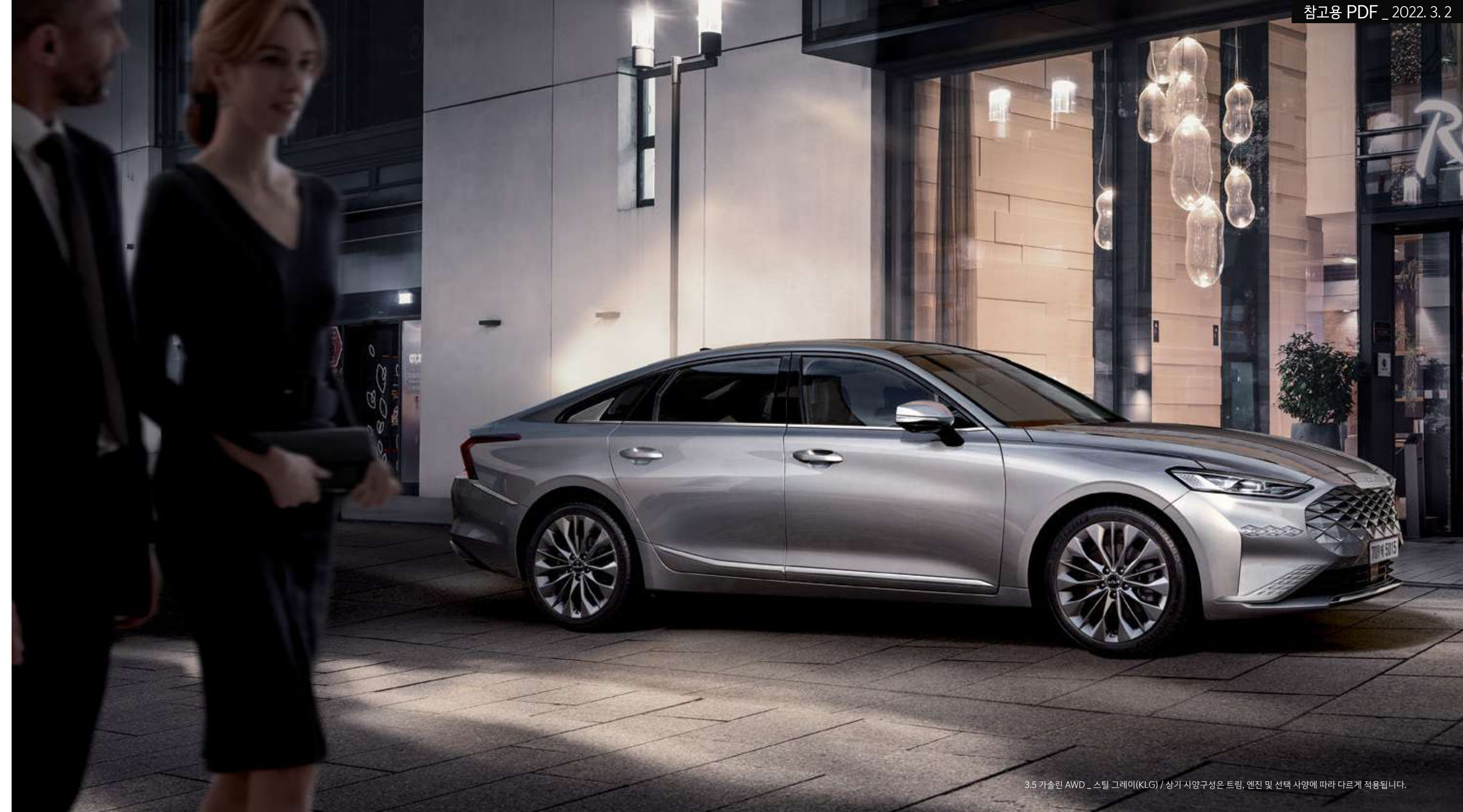
3.5 가솔린 AWD _ 스틸 그레이(KLG) / 상기 사양구성은 트림, 엔진 및 선택 사양에 따라 다르게 적용됩니다.