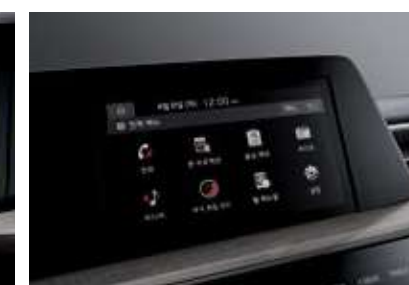
8인치 디스플레이 오디오