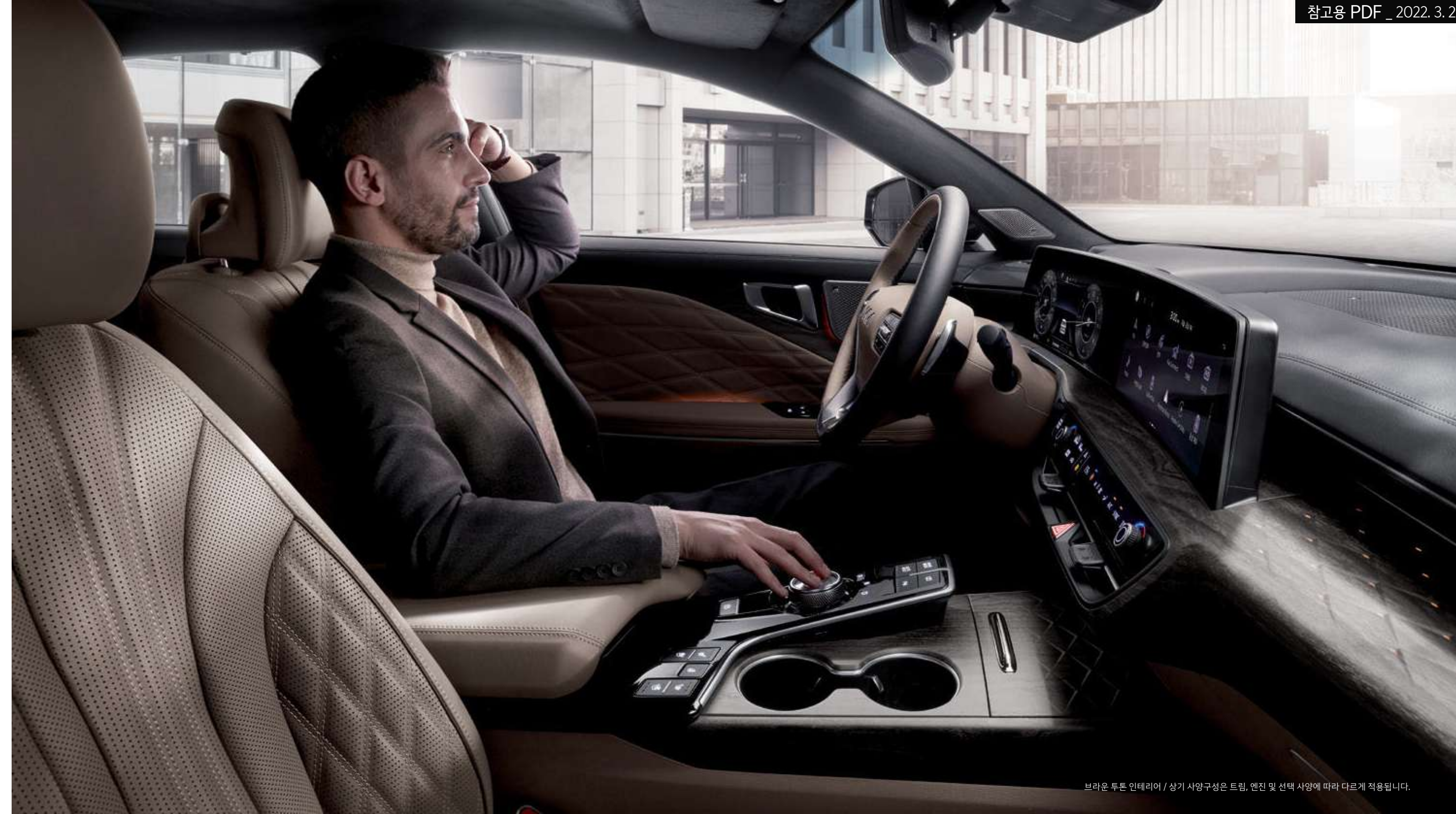
브라운 투톤 인테리어 / 상기 사양구성은 트림, 엔진 및 선택 사양에 따라 다르게 적용됩니다.