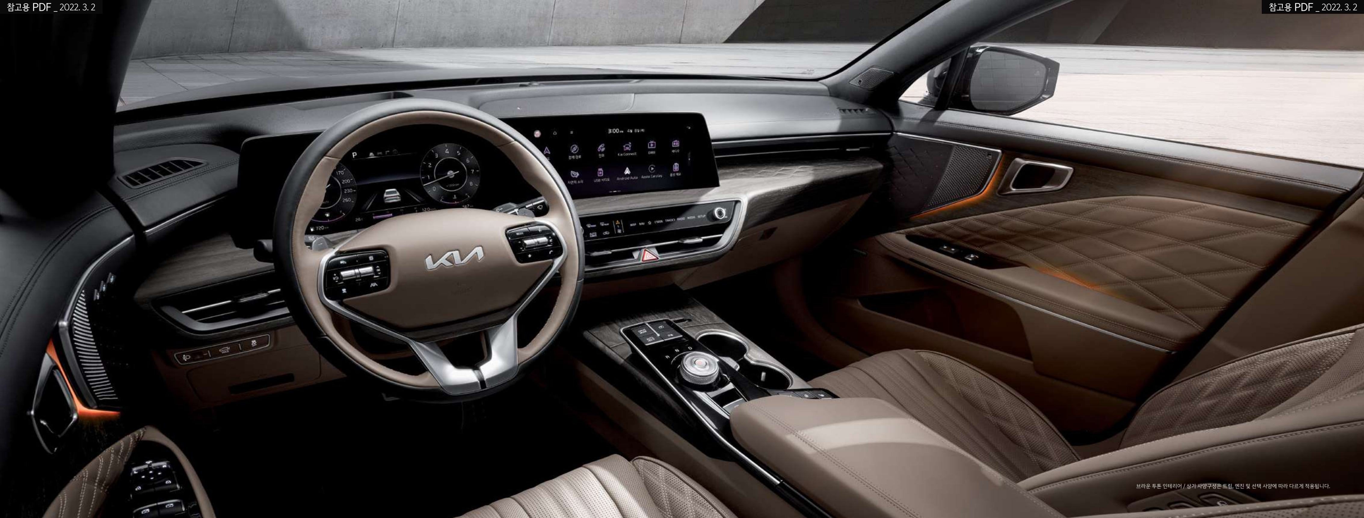
브라운 투톤 인테리어 / 상기 사양구성은 트림, 엔진 및 선택 사양에 따라 다르게 적용됩니다.