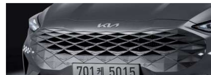
범퍼 일체형 라디에이터 그릴