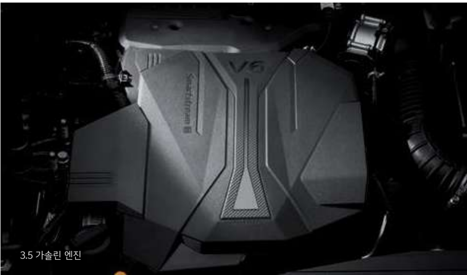
3.5 가솔린 엔진