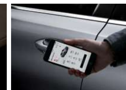
기아 디지털 키