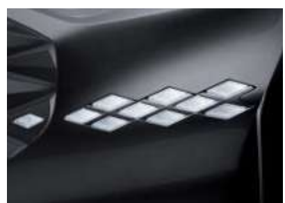
LED DRL / LED 턴 시그널