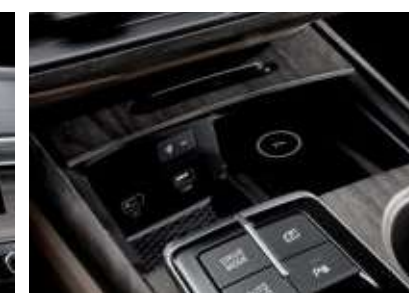
스마트폰 무선충전 시스템