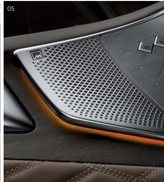
상기 사양구성은 트림, 엔진 및 선택 사양에 따라 다르게 적용됩니다.