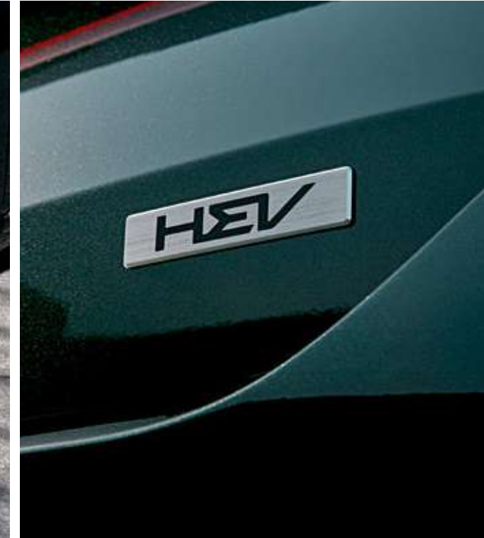
하이브리드 전용 콘텐츠