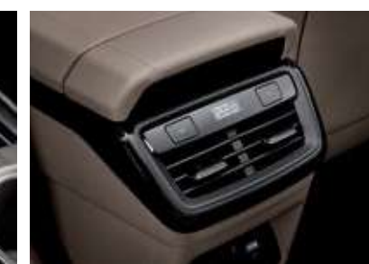
3존 공조 (뒷좌석 온도제어)