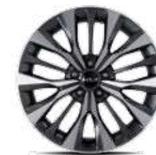
19인치 전면가공 휠