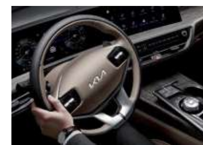
랙 구동형 전동식 파워 스티어링