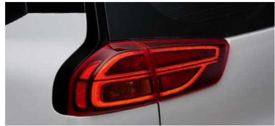
LED 리어 콤비네이션램프