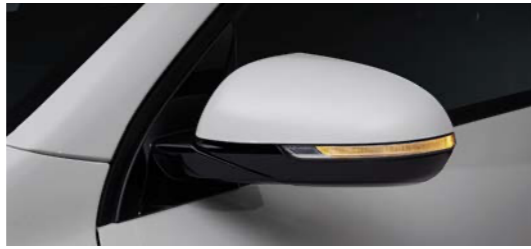
LED 리피터 일체형 아웃사이드 미러 (전동접이, 전동조절, 열선)