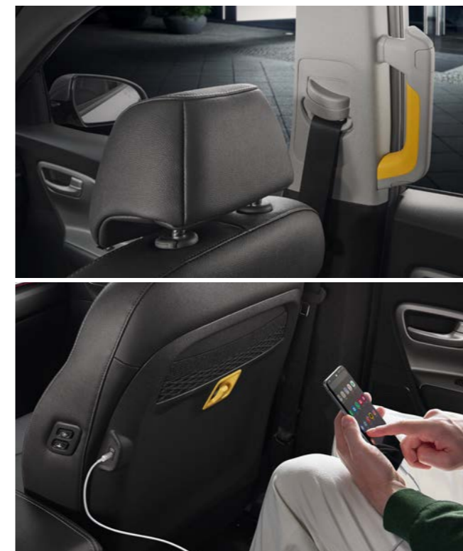
동승석 슬림형 헤드레스트 (택시 모델 限) / B필라 어시스트 핸들 동승석 시트의 헤드레스트를 슬림화하여 2열 탑승객에게 시원한 전방 시야와 공간감을 선사하며, B필라 어시스트 핸들은 탑승객의 편리한 승하차를 도와줍니다.