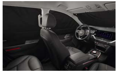
멀티 커튼 (전면/1열/2열)