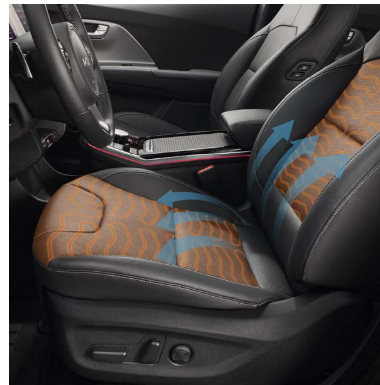
운전석 파워시트 / 운전석 전동식 허리지지대* 운전자의 체형에 맞게 운전석 시트 위치를 편리하게 조절할 수 있으며, 전동식 허리지지대로 운전이 더욱 편안합니다.