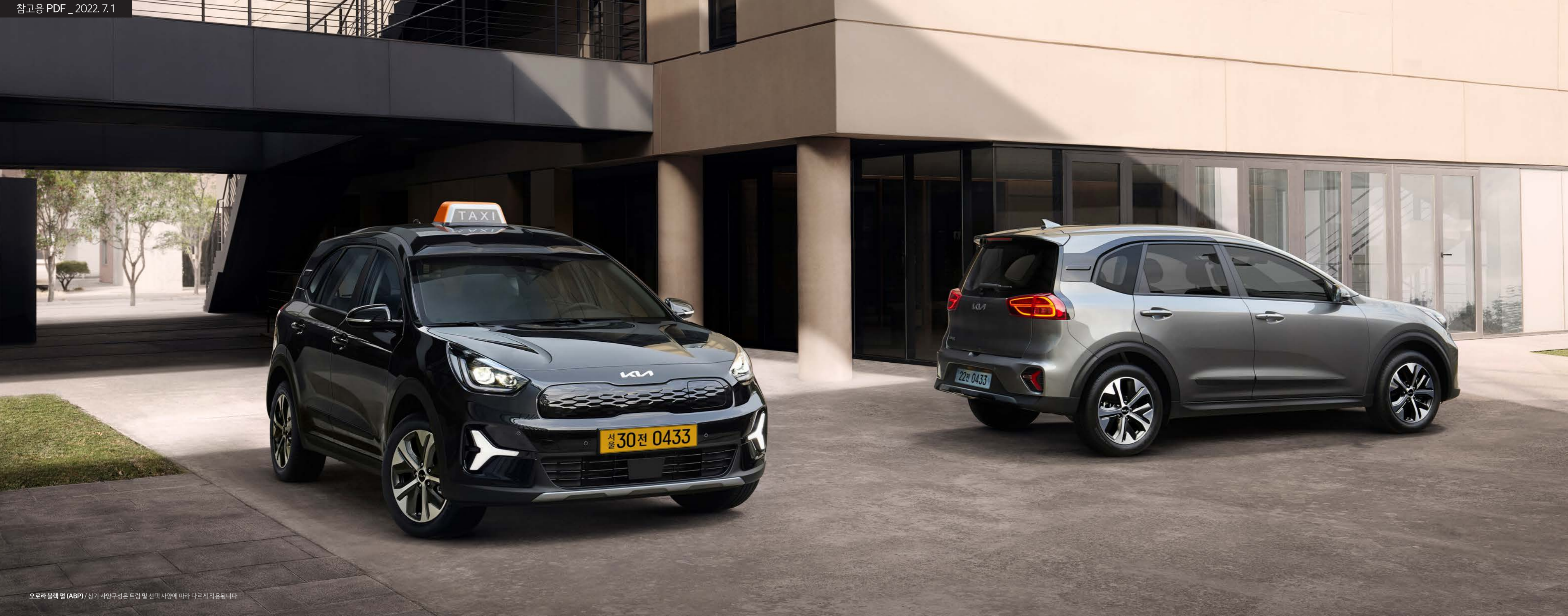
오로라 블랙 펠 (ABP) / 상기 사양구성은 트림 및 선택 사양에 따라 다르게 적용됩니다