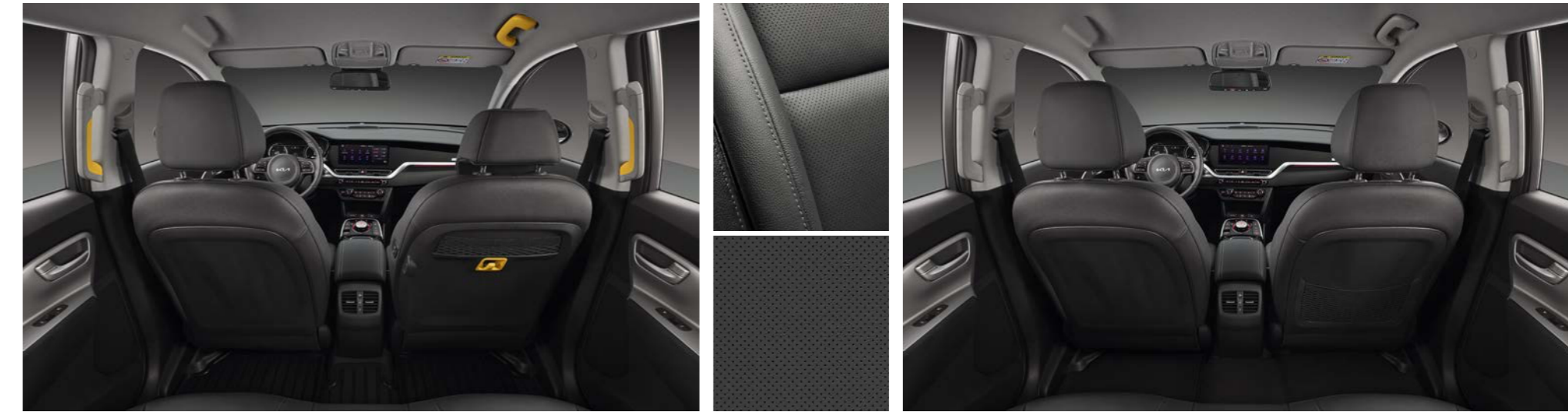
블랙 인테리어 (택시 전용 포인트 칼라 적용)