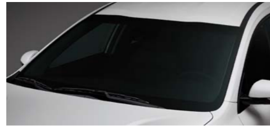
윈드실드 이중접합 차음 글라스