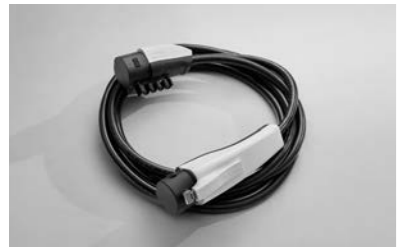
5핀 완속 충전 케이블