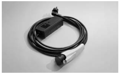
220V 휴대용 완속 충전 케이블