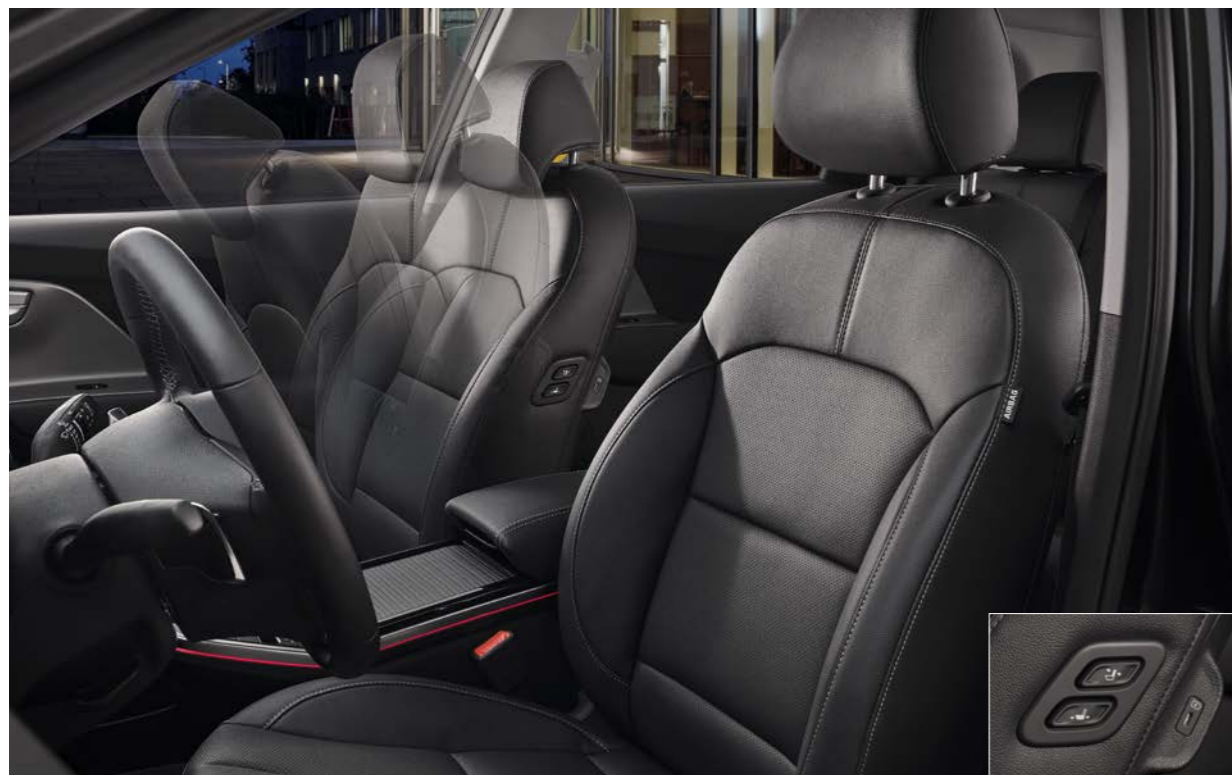
동승석 워크인 디바이스 (택시 모델 限)* 버튼 하나로 동승석 시트 위치와 시트백 각도를 간편하게 조절하여 2열 탑승객의 여유로운 승하차와 공간 활용을 도울 수 있습니다.

손쉽게 조절할 수 있는 동승석 워크인 디바이스는 탑승객에게 더 넓은 공간과 시야를 선사하며, 운전석 통풍/열선시트와 편리한 승하차를 돕는 B필라 어시스트 핸들 등 운전자와 탑승객 모두를 위한 배려가 가득합니다.