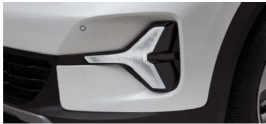
LED DRL (주간 주행등)