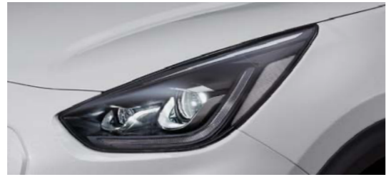
프로젝션 LED 헤드램프