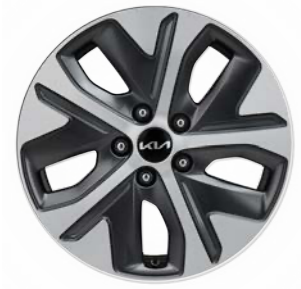
17인치 전면가공 휠