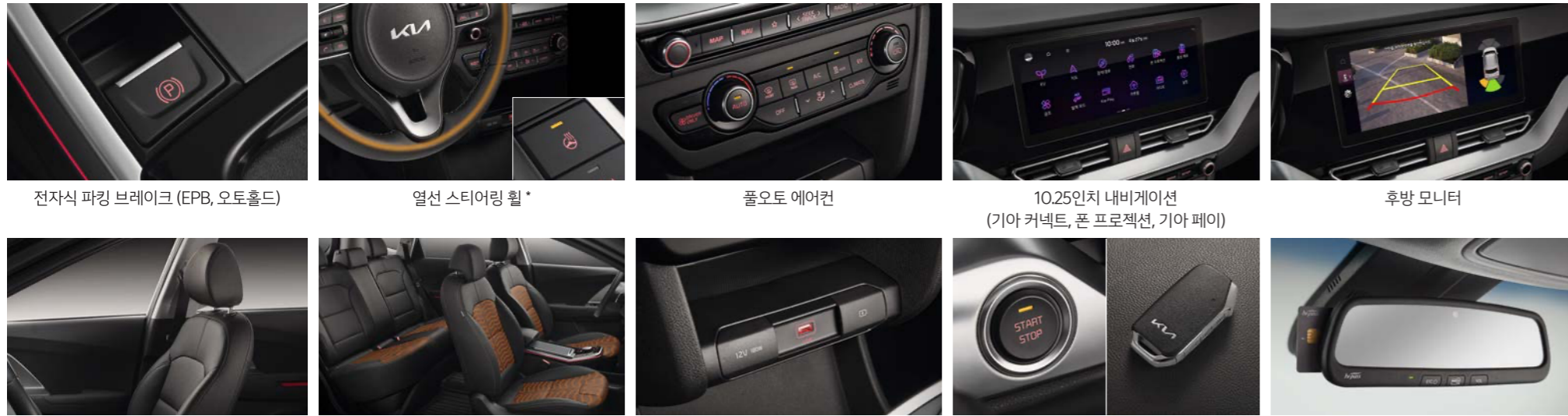
전자식 파킹 브레이크 (EPB, 오토홀드)