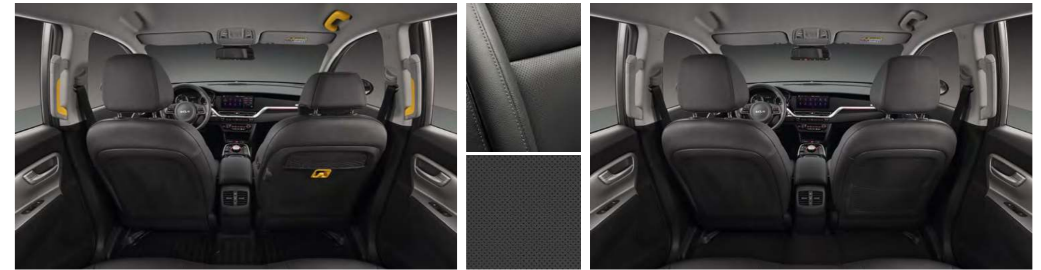
블랙 인테리어 (택시 전용 포인트 칼라 적용)