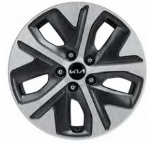
17인치 전면가공 휠