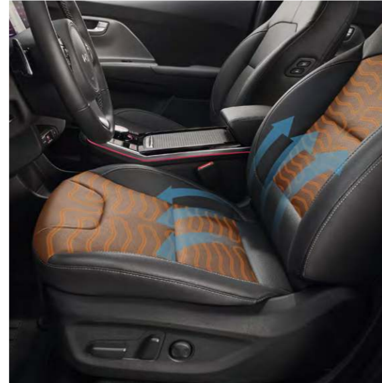
운전석 파워시트 / 운전석 전동식 허리지지대* 운전자의 체형에 맞게 운전석 시트 위치를 편리하게 조절할 수 있으며, 전동식 허리지지대로 운전이 더욱 편안합니다.