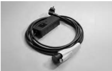
비상용 완속 충전 케이블 (220V ICCB)