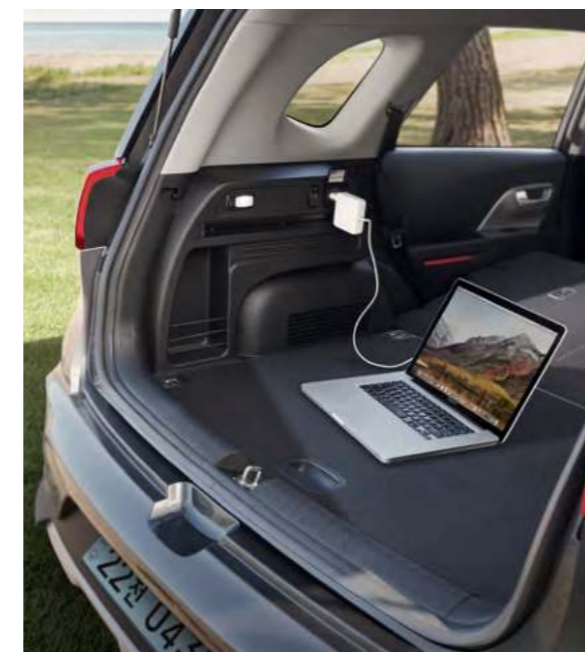
※ V2L 패키지 사양은 Kia Genuine Accessories 품목이며, 택시용/업무용 모델 적용 가능

러기지 멀티 수납트림 (좌) / 실내 V2L 콘센트 러기지 좌측에 멀티 레일, LED램프 등의 기능이 적용된 멀티 수납트림과 220V 전원 연결로 다양한 전자기기를 사용할 수 있는 실내 V2L 콘센트로 최적의 편리함을 드립니다. (콘센트 최대출력 1.5kW) ※ V2L 패키지 사양은 러기지 멀티 수납트림 (우), 평탄화 보드, 캠핑 테이블 미포함