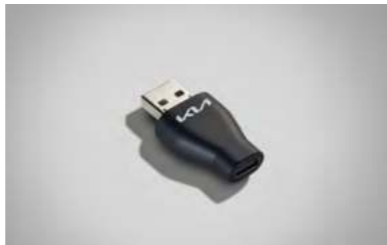
A to USB-C 변환 젠더*