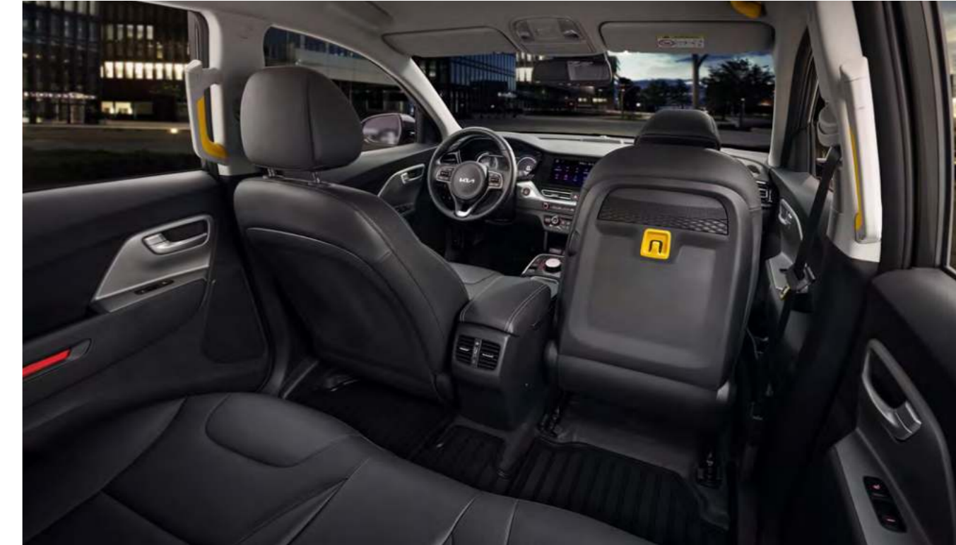
2열 시트벨트 버클 조명 (택시 모델 限) / 2열 도어 리플렉터 시트벨트 버클 주변 LED 조명으로 시인성을 높여 탑승자의 벨트 체결에 도움을 주고, 2열 도어 암레스트에 적용된 리플렉터가 탑승객의 안전한 승하차를 보조합니다.