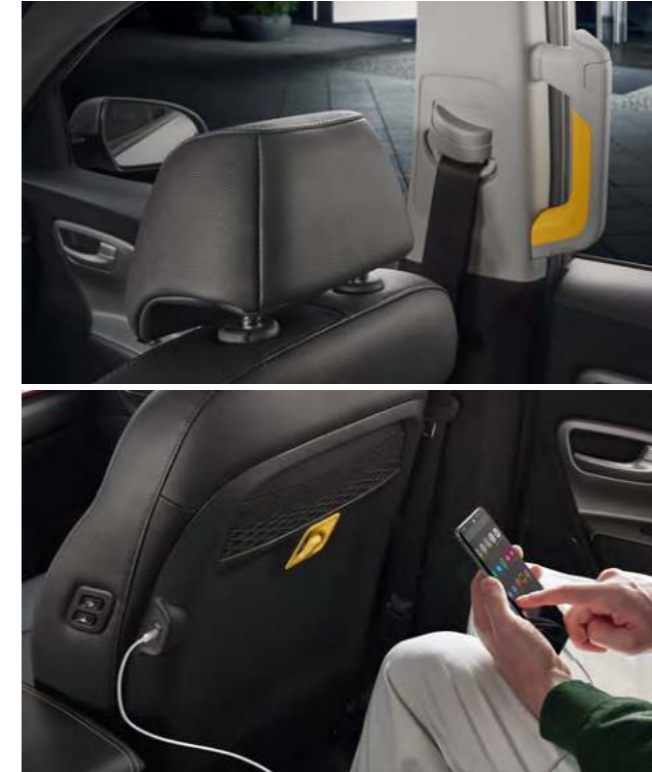
동승석 슬림형 헤드레스트 (택시 모델 限) / B필라 어시스트 핸들 동승석 시트의 헤드레스트를 슬림화하여 2열 탑승객에게 시원한 전방 시야와 공간감을 선사하며, B필라 어시스트 핸들은 탑승객의 편리한 승하차를 도와줍니다.