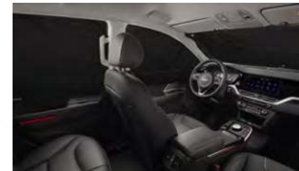
멀티 커튼 (전면/1열/2열)