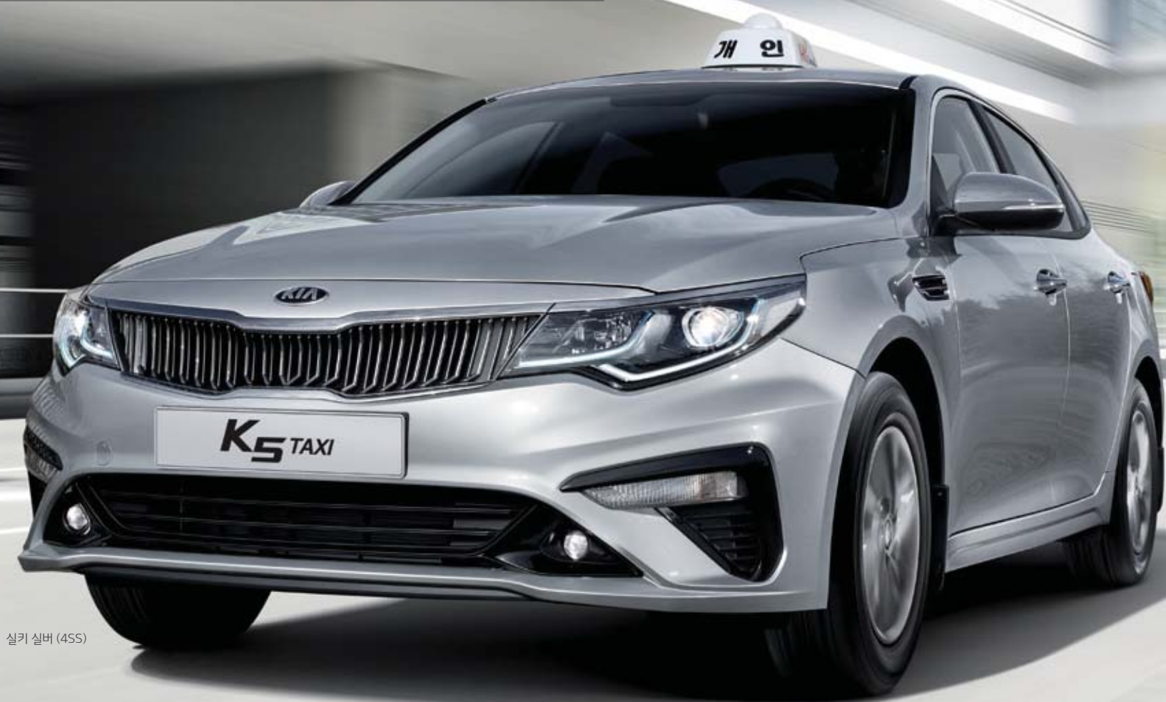
실키 실버 (4SS)