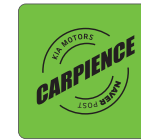
네이버 포스트 카피엔스