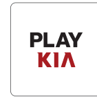
블로그 PLAY KIA