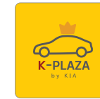
카카오 소통채널 K-PLAZA / King Car