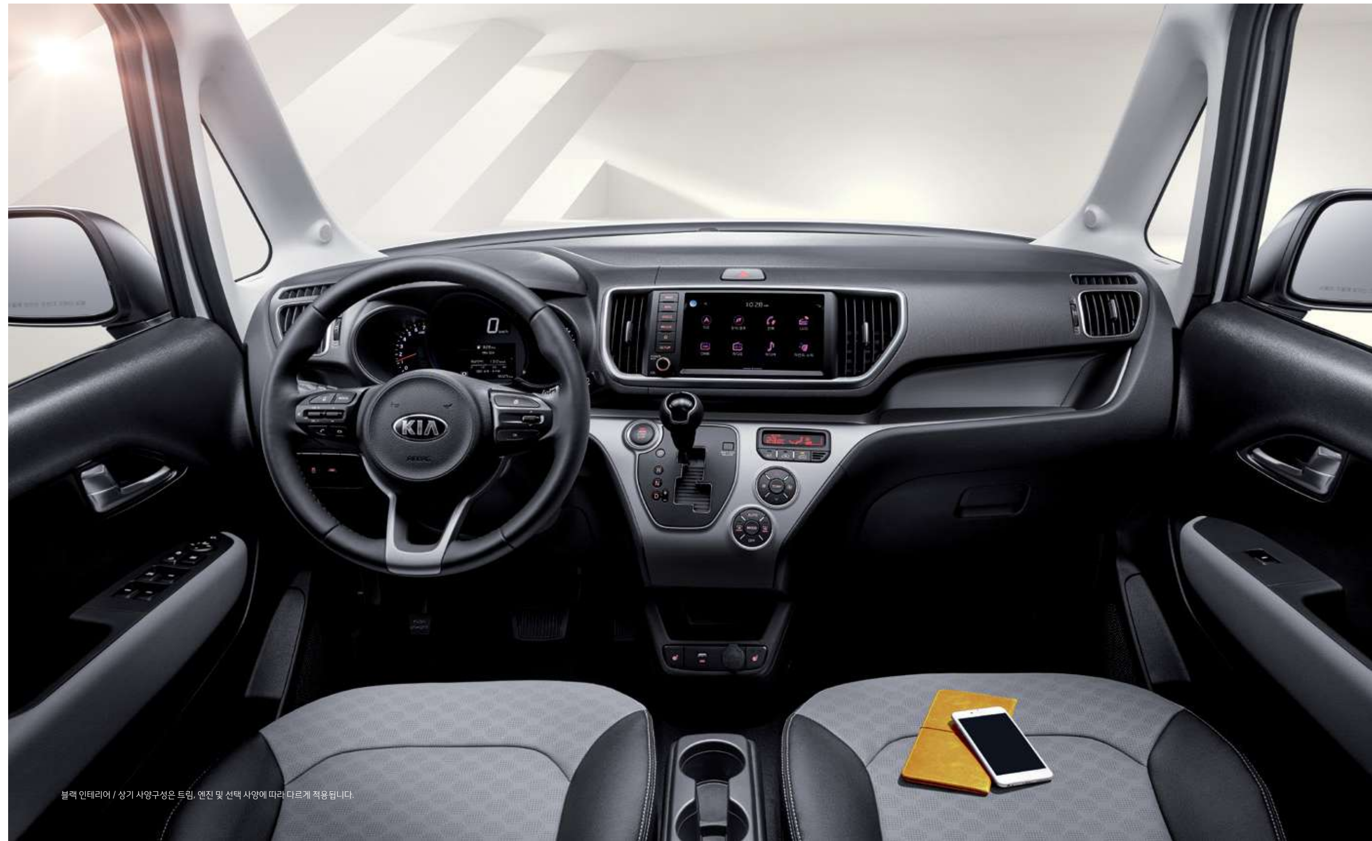
블랙 인테리어 / 상기 사양구성은 트림, 엔진 및 선택 사양에 따라 다르게 적용됩니다.