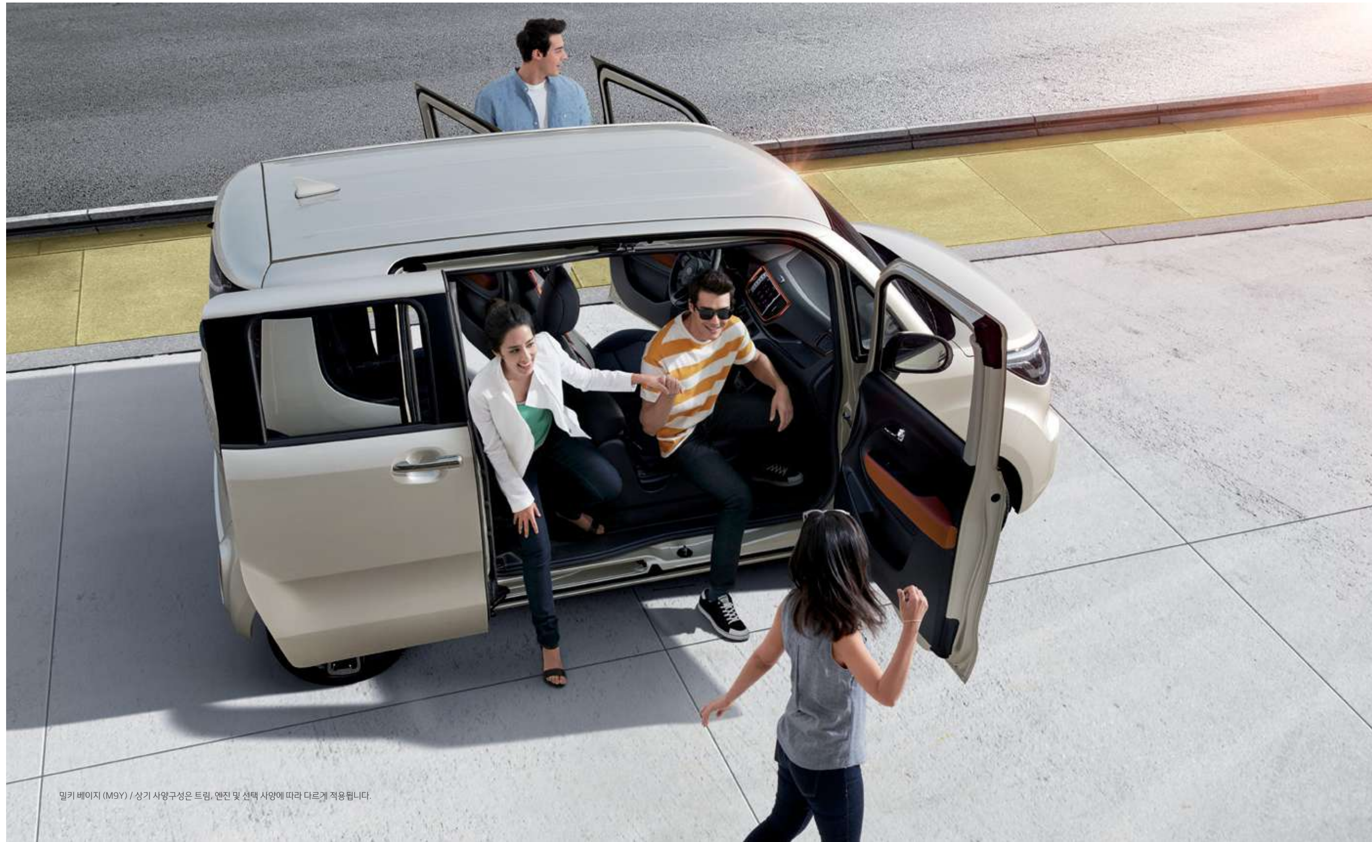
밀키 베이지 (M9Y) / 상기 사양구성은 트림, 엔진 및 선택 사양에 따라 다르게 적용됩니다.