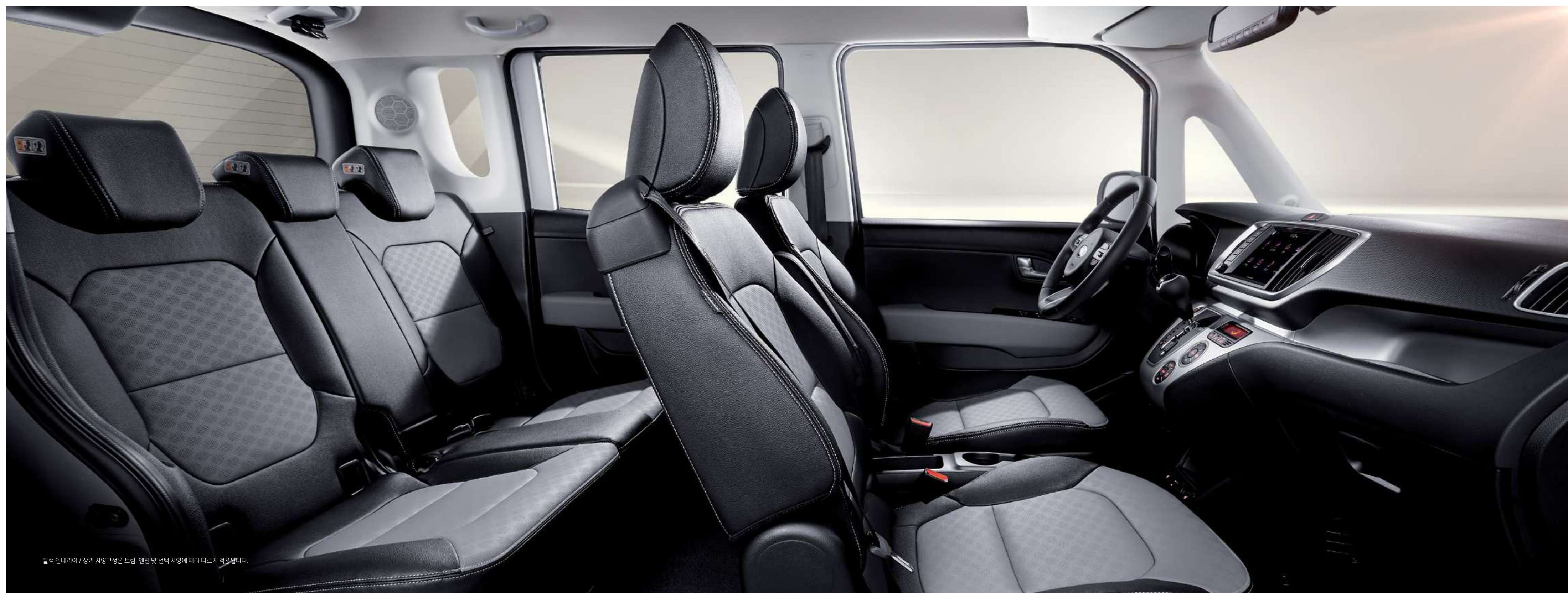
블랙 인테리어 / 상기 사양구성은 트림, 엔진 및 선택 사양에 따라 다르게 적용됩니다.