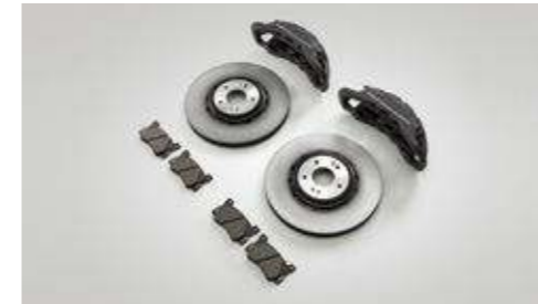
하이브리드 디스크, 대용량 캘리퍼(4P), 로우스틸 패드