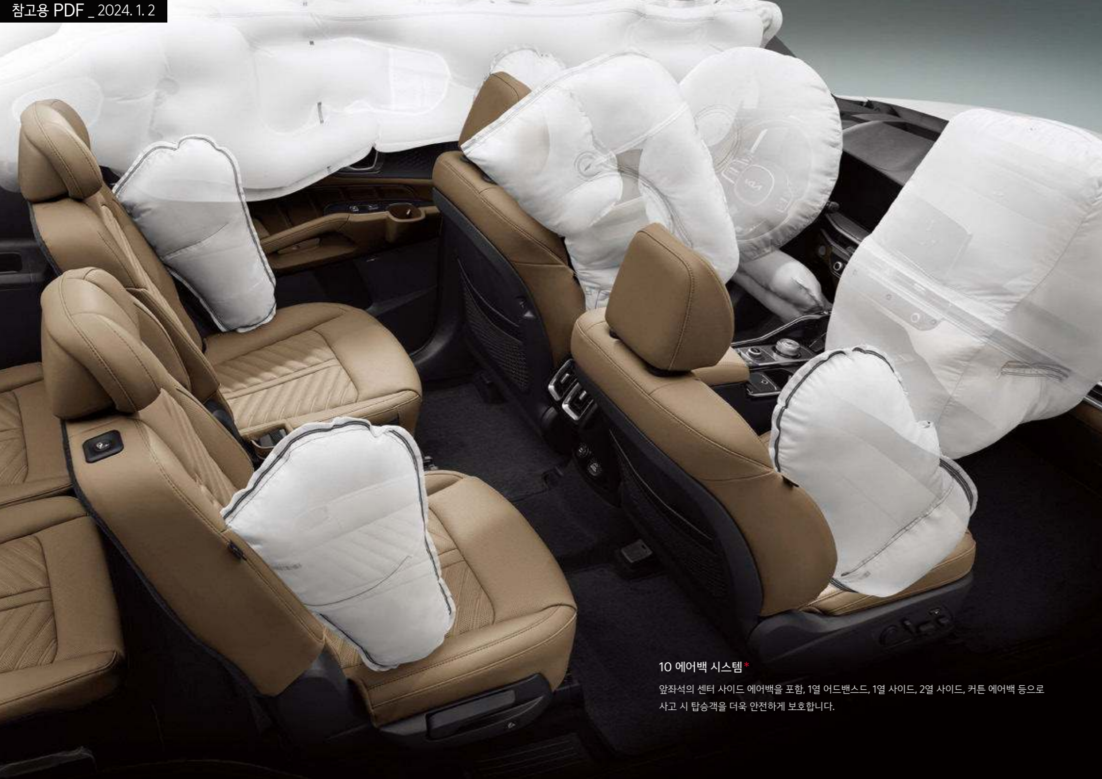
10 에어백 시스템* 앞좌석의 센터 사이드 에어백을 포함, 1열 어드밴스드, 1열 사이드, 2열 사이드, 커튼 에어백 등으로 사고 시 탑승객을 더욱 안전하게 보호합니다.