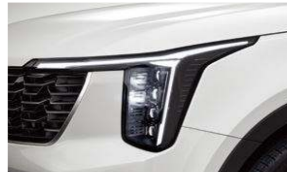
프로젝션 LED 헤드램프