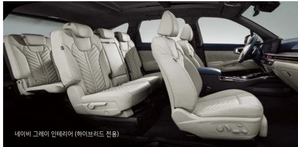
네이비 그레이 인테리어 (하이브리드 전용)