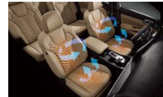
1열 열선 & 통풍시트*