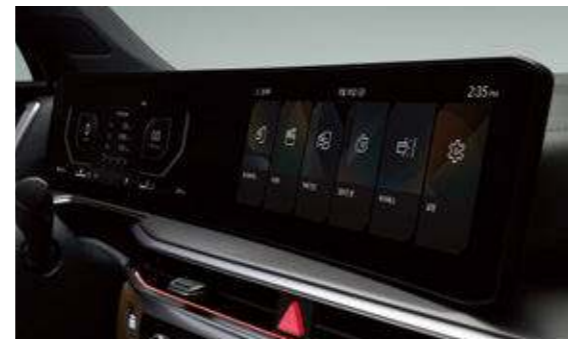
슈퍼비전 클러스터 (12.3인치 풀사이즈 칼라 TFT LCD)