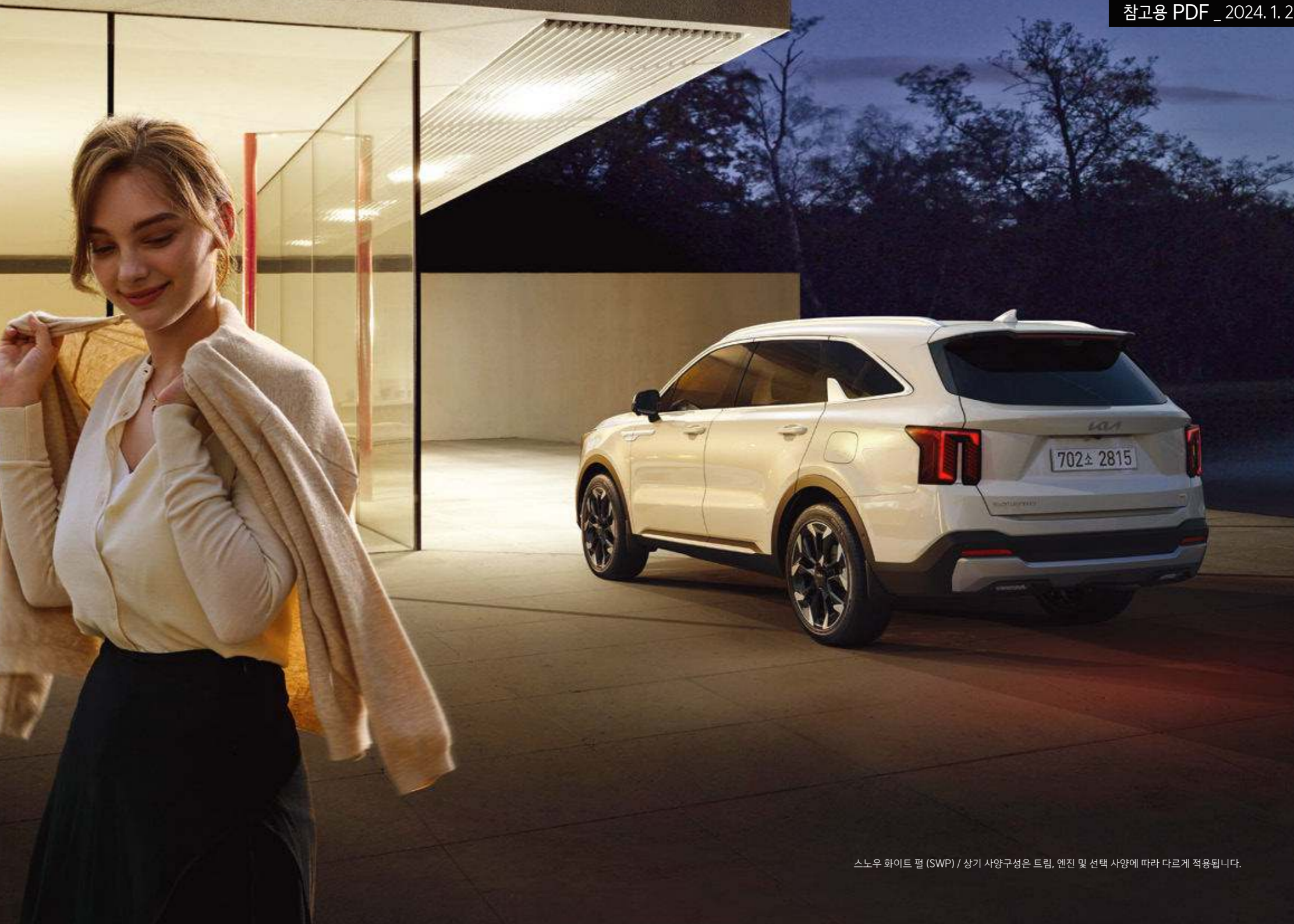
스노우 화이트 펄 (SWP) / 상기 사양구성은 트림, 엔진 및 선택 사양에 따라 다르게 적용됩니다.

※ 차량 구매 후 Kia Connect 최초 가입 시 기본 서비스 5년 무료 제공되며, 이 중 라이드 서비스 (SOS 긴급출동, 에어백 전개 자동 통보, 월간 리포트, 교통정보 제공)는 추가 5년 무료 제공 ※ Kia Connect 스트리밍 서비스 이용 시 구독 중인 스트리밍 서비스의 계정과 연동이 필요합니다. ※ 구독 중인 스트리밍 서비스 이용권이 모바일 기기만 지원할 경우, Kia Connect 스트리밍 서비스와 연동되지 않습니다. ※ 문의: Kia Connect 카카오톡 고객센터 (카카오톡 검색창에서 "기아커넥트" 입력 후 친구 추가)