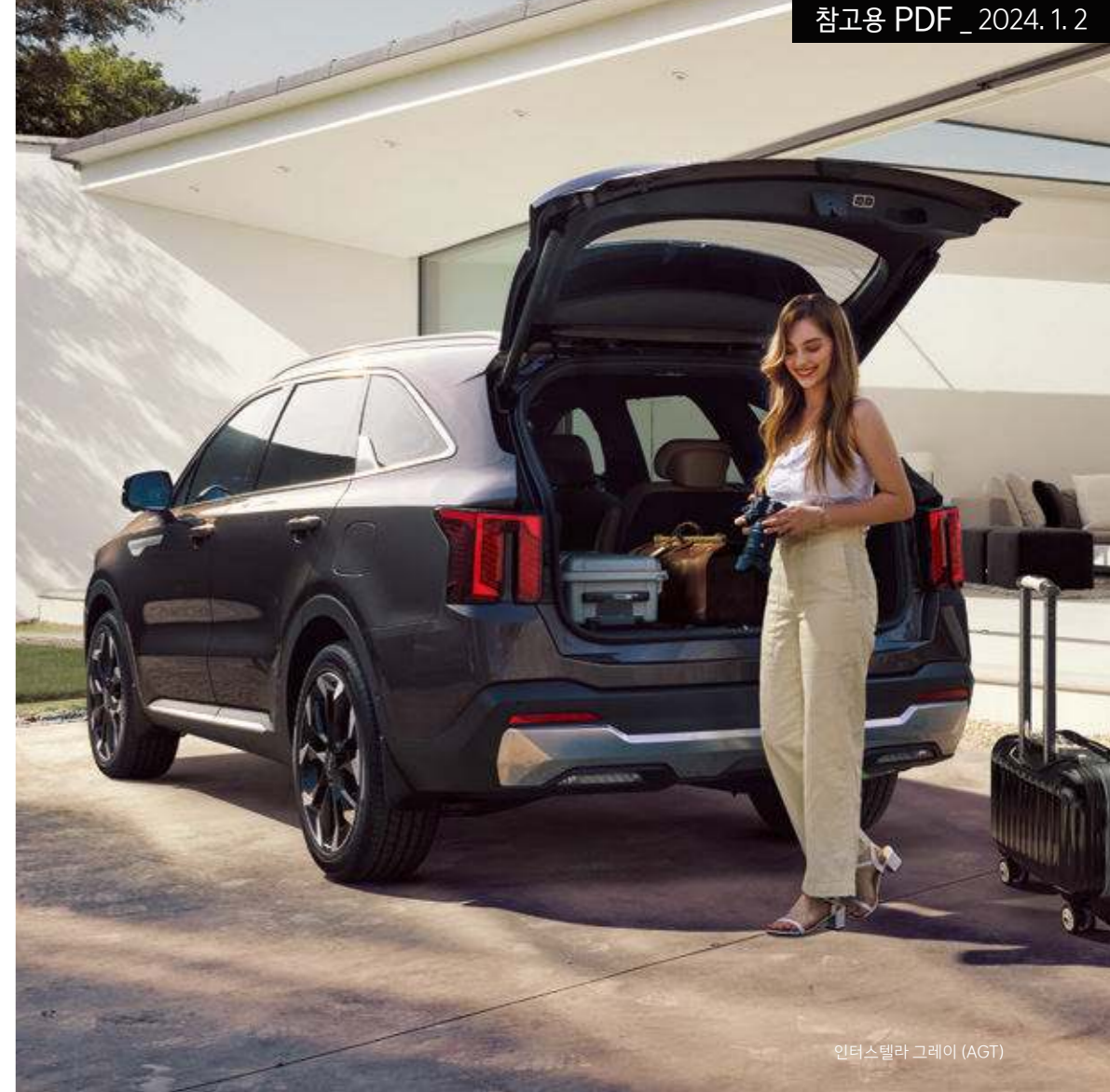
인터스텔라 그레이 (AGT)