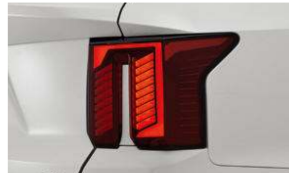
LED 리어콤비네이션 램프