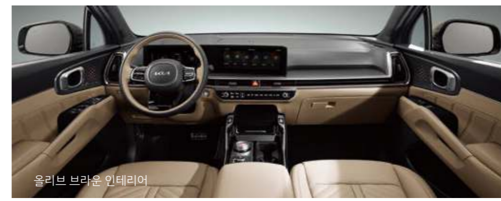
올리브 브라운 인테리어