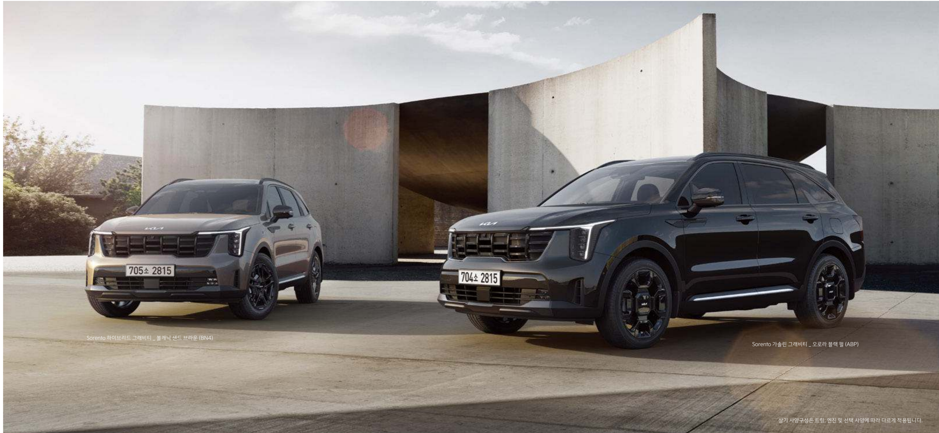
Sorento 하이브리드 그래비티 _ 볼캐닉 샌드 브라운 (BN4)