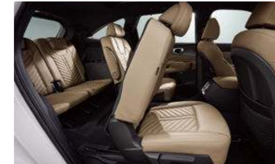
2열 윈터치 워크인