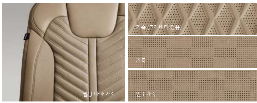
가죽 (그라비티 전용) 가죽 인조가죽