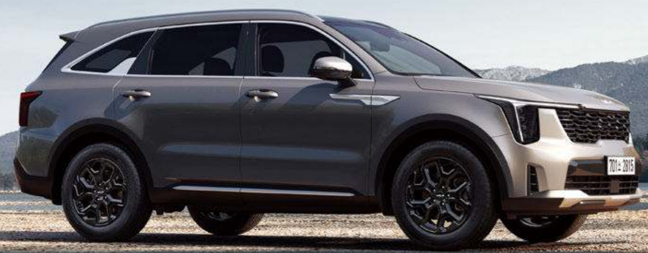
블랙닉 샌드 브라운 (BN4)

하이브리드부터 가솔린과 디젤까지 다양한 라인업의 쏬렌토가 오늘의 라이프스타일과 취향에 꼭 맞는 경험을 선사합니다.