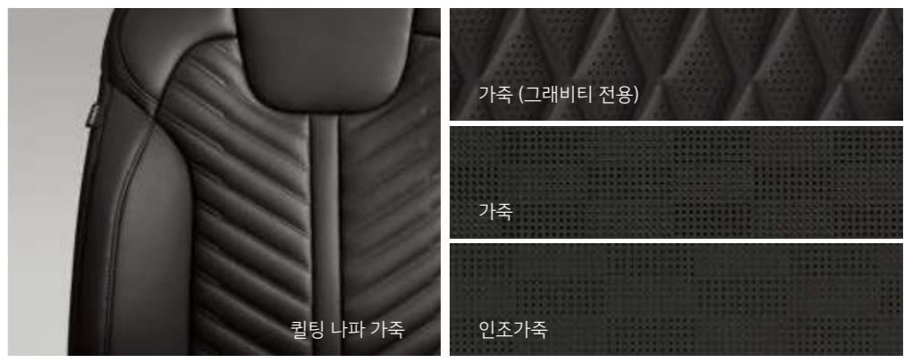
가죽 (그라비티 전용) 가죽 인조가죽