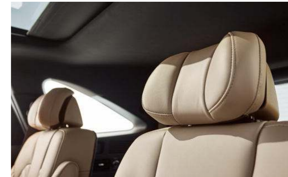
올리브 브라운 인테리어 / 상기 사양구성은 트림, 엔진 및 선택 사양에 따라 다르게 적용됩니다.