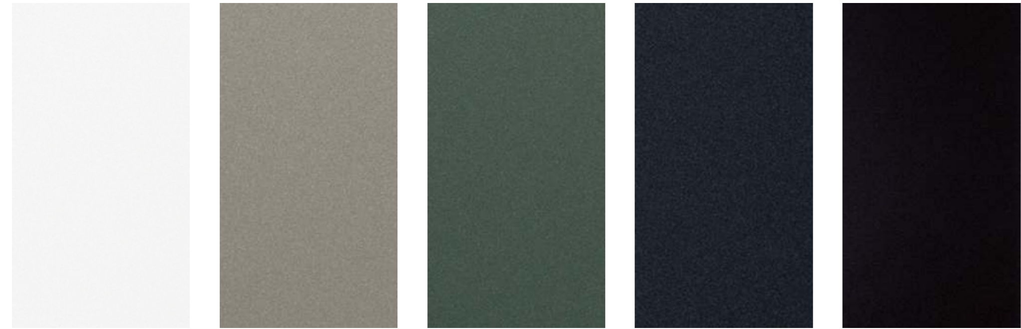
스노우 화이트 펄 (SWP) 볼캐닉 샌드 브라운 (BN4) 시티스케이프 그린 (CGE) 인터스텔라 그레이 (AGT) 오로라 블랙 펄 (ABP)