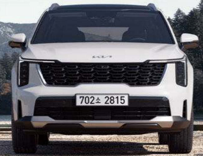
스노우 화이트 펄 (SWP)

235 시스템 최고출력 ps (가솔린 엔진 : 180ps, 전기 모터 : 47.7kW) | 37.4 시스템 최대토크 kgf·m (가솔린 엔진 : 27.0kgf·m, 전기 모터 : 26.4Nm)