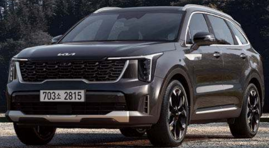
인터스텔라 그레이 (AGT)

281 최고출력 ps (5,800rpm) | 43.0 최대토크 kgf·m (1,700 ~ 4,000rpm)