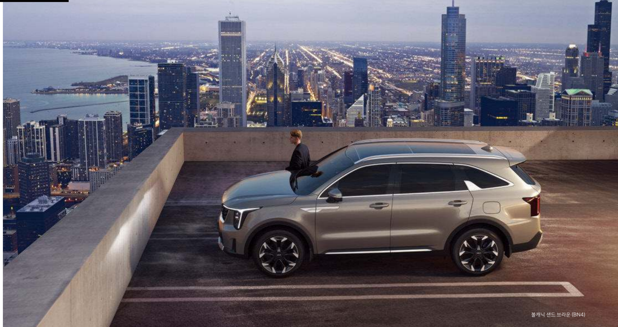
볼케닉 샌드 브라운 (BN4)