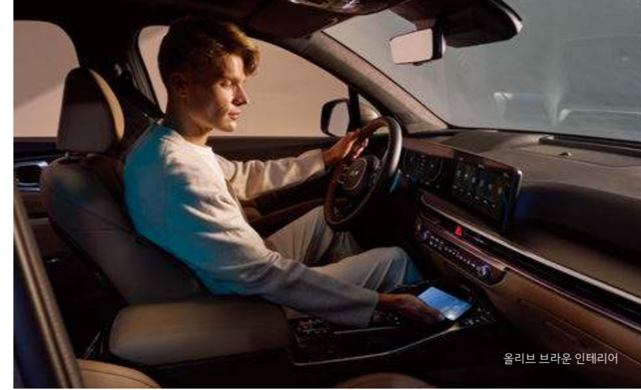
올리브 브라운 인테리어