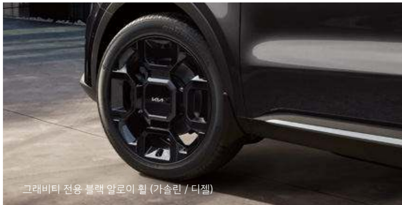
그래비티 전용 블랙 알로이 휠 (가솔린 / 디젤)