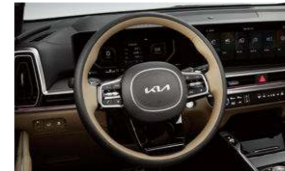
프리미엄 스티어링 휠