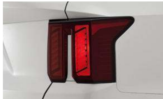
기본형 리어콤비네이션 램프