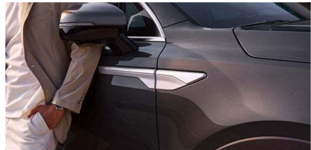
인터스텔라 그레이 (AGT) / 상기 사양구성은 트림, 엔진 및 선택 사양에 따라 다르게 적용됩니다.