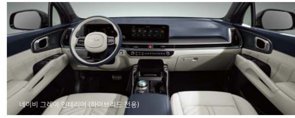
네이비 그레이 인테리어 (하이브리드 전용)