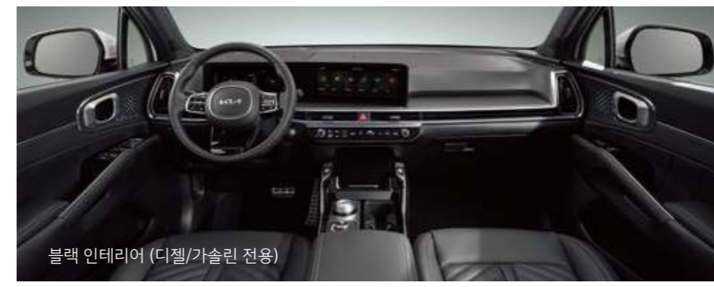
블랙 인테리어 (디젤/가솔린 전용)