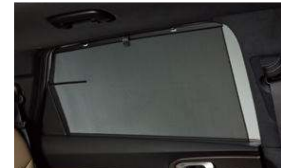
2열 측면 수동 선커튼