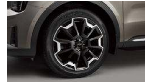
20인치 전면가공 휠