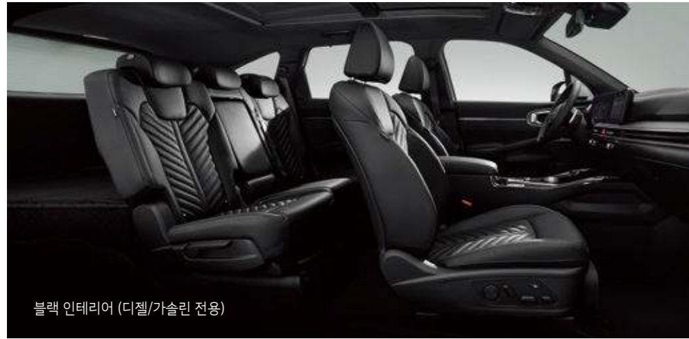
블랙 인테리어 (디젤/가솔린 전용)