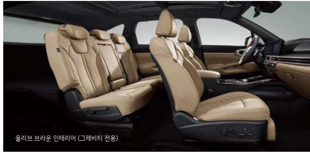
올리브 브라운 인테리어 (그라비티 전용)