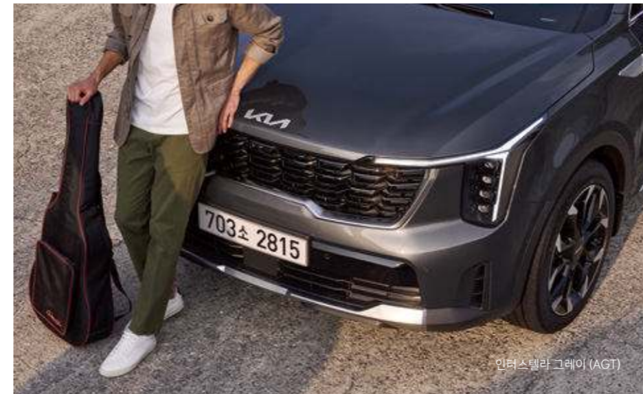
인터스텔라 그레이 (AGT)