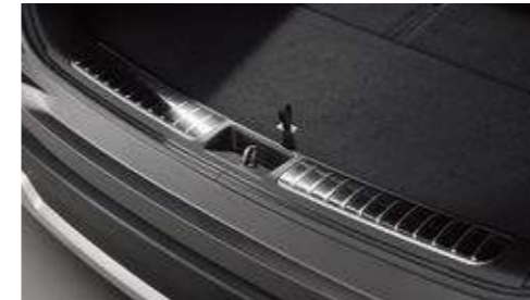
메탈 트랜스 버스 트림