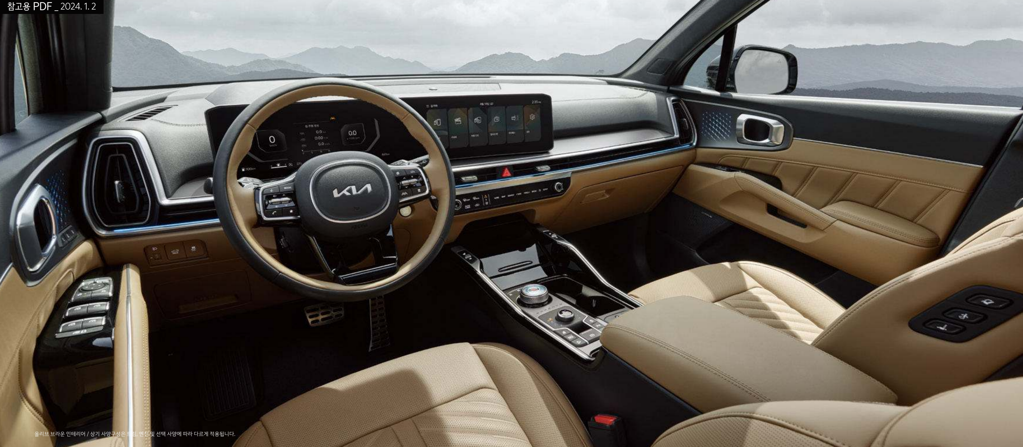
올리브 브라운 인테리어 / 상기 사양구성은 트림, 엔진 및 선택 사양에 따라 다르게 적용됩니다.