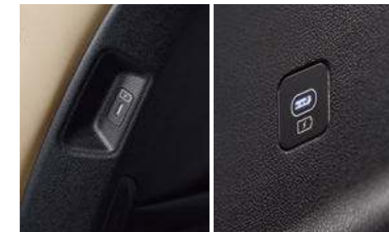
USB C타입 단자 (2열 2개 / 3열 2개)