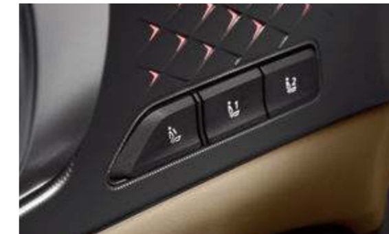
운전자세 메모리 시스템