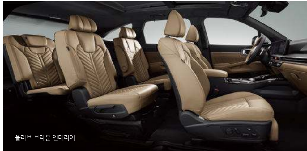
올리브 브라운 인테리어