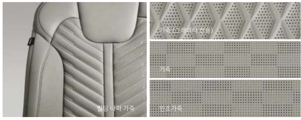
가죽 (그라비티 전용) 가죽 인조가죽