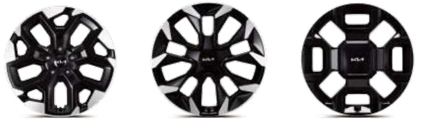
18인치 전면가공 휠 20인치 전면가공 휠 20인치 블랙 알로이 휠 (그라비티 전용)