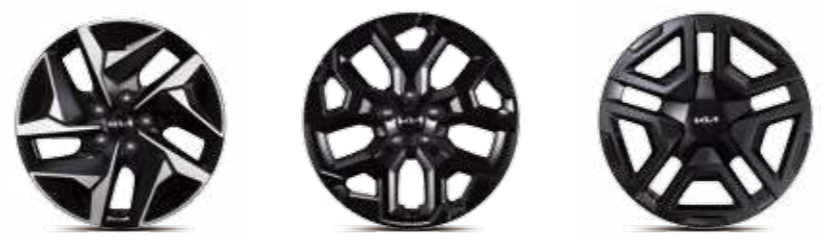
17인치 전면가공 휠 18인치 블랙 알로이 휠 18인치 블랙 알로이 휠 (그라비티 전용)