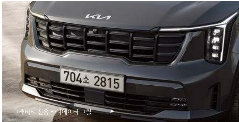
그래비티 전용 라디에이터 그릴

쏘렌토 그래비티는 전용 블랙 알로이 휠과 그릴 디자인, 볼륨감 있는 그래비티 전용 가죽시트를 비롯해 주요 외장 포인트를 유광 블랙, 또는 다크 건메탈로 적용해 한층 더 볼드한 이미지를 연출합니다.