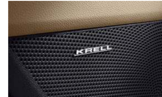
KRELL 프리미엄 사운드 (12스피커, 외장 엠프)