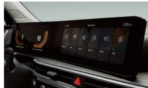
슈퍼비전 클러스터 (4.2인치 칼라 TFT LCD)