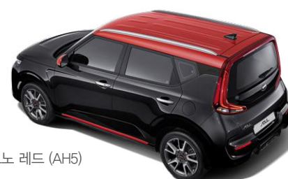
체리 블랙 + 인페르노 레드 (AH5)