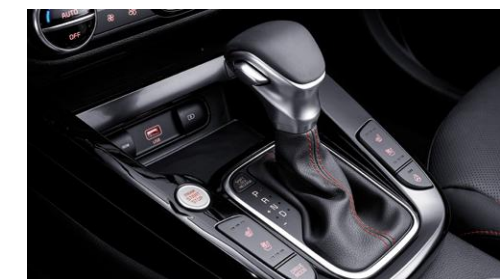
7단 DCT (수동겸용, 부츠타입)

차급을 초월하는 강력한 터보 엔진의 성능과 드라이빙 시스템의 최적화로 스릴 넘치는 파워가 정교하게 펼쳐집니다.