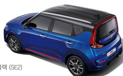
넵튠 블루 + 체리 블랙 (SE2)