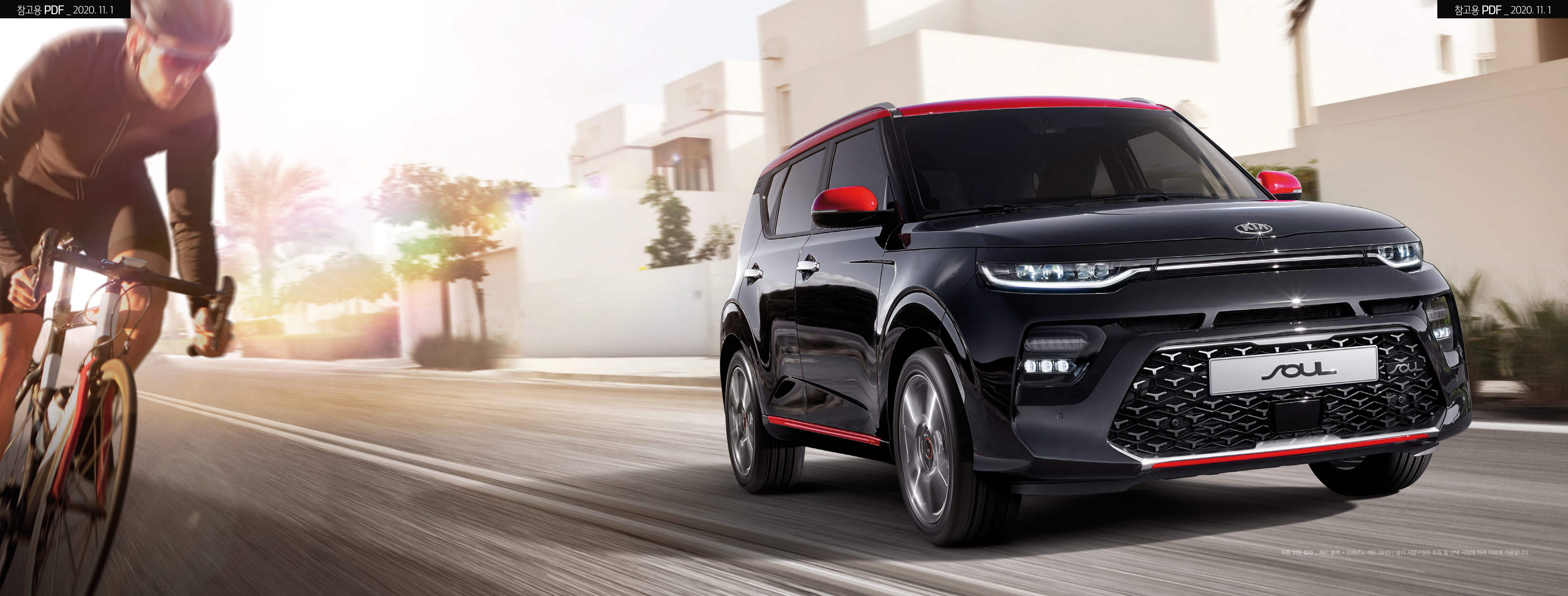
두톤 외장 컬러 ... 체리 블랙 + 인페르노 레드 (사6) / 상기 사양구성은 트림 및 선택 사양에 따라 다르게 적용됩니다.