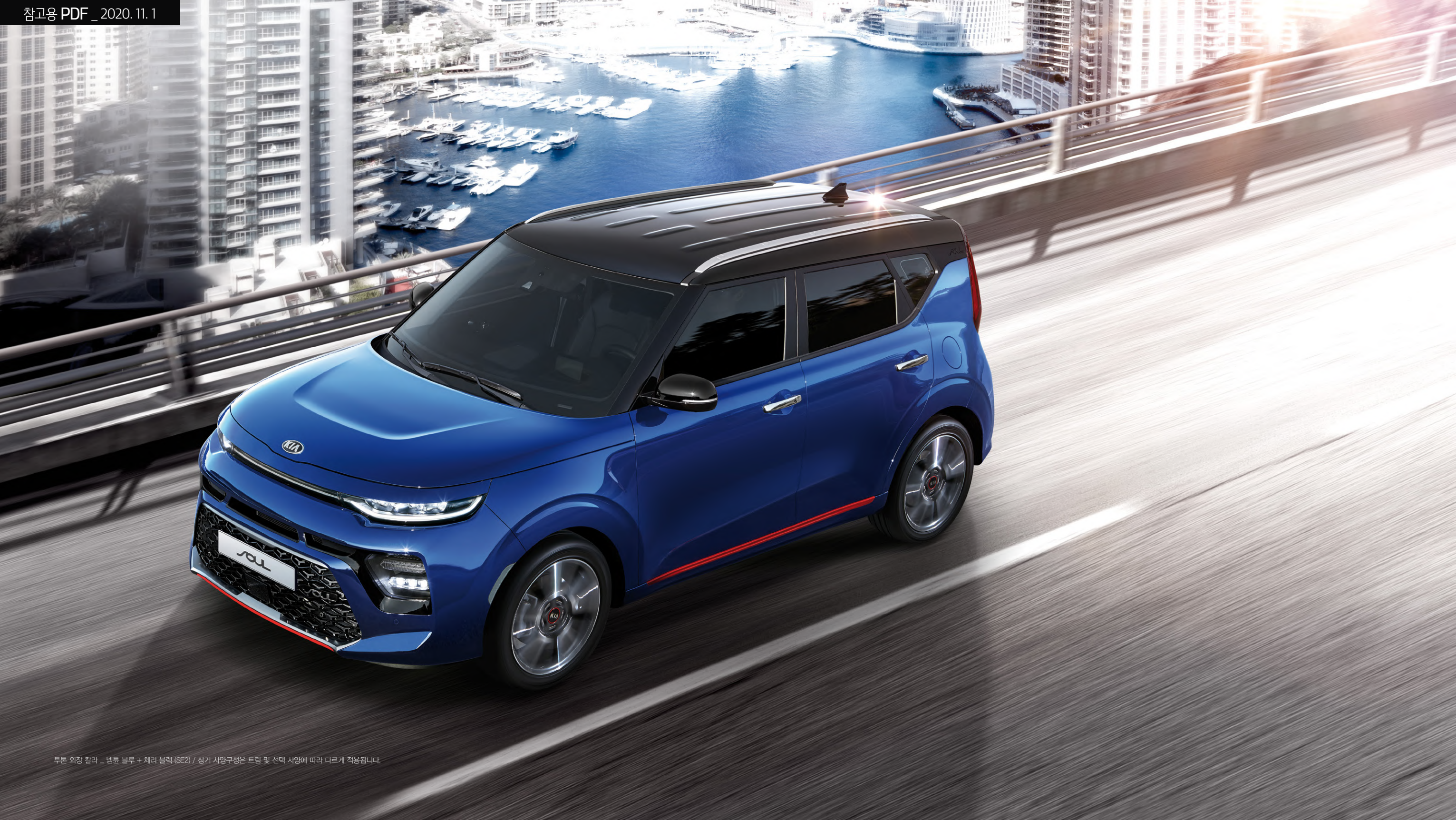
두톤 외장 컬러 ... 벤틀 블루 + 체리 블랙 (SE2) / 상기 사양구성은 트림 및 선택 사양에 따라 다르게 적용됩니다.

첨단 감각의 램프 레이아웃과 강인한 핫스탬핑 크롬 인테이크 그릴, 랩 어라운드 스타일의 볼륨감 넘치는 리어 디자인까지 고성능의 스포티한 이미지로 완벽하게 재탄생하였습니다.