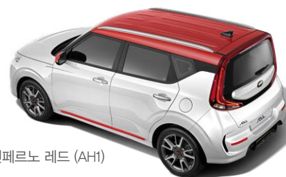
클리어 화이트 + 인페르노 레드 (AH1)