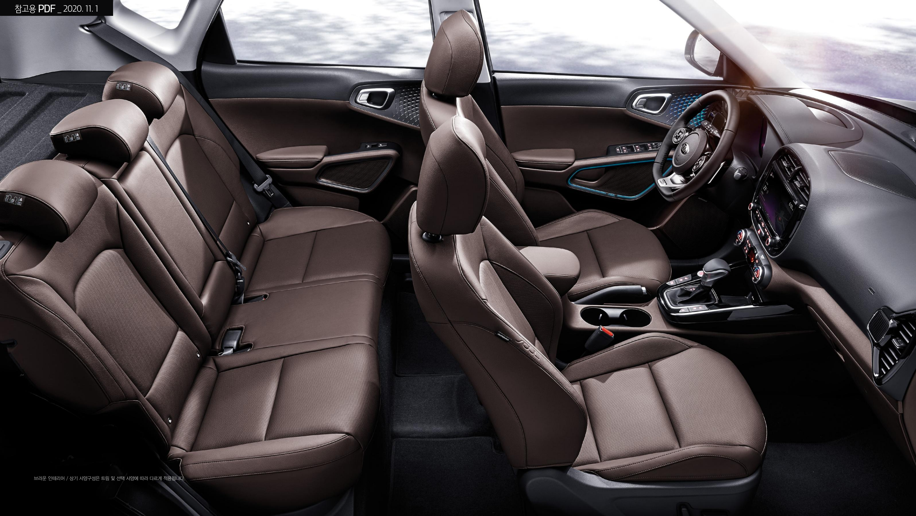
브라운 인테리어 / 상기 사양구성은 트림 및 선택 사양에 따라 다르게 적용됩니다.