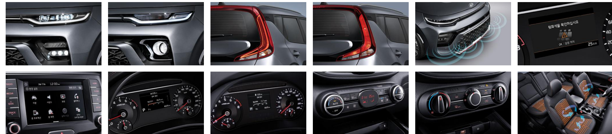
프로젝션 LED 헤드램프 7인치 디스플레이 오디오