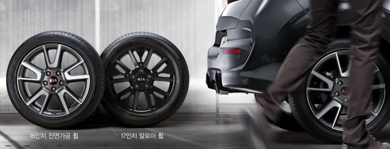
18인치 전면가공 휠