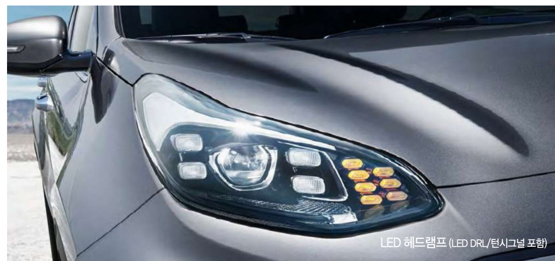
LED 헤드램프 (LED DRL/턴시그널 포함)