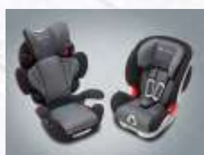
카시트 2종 (좌: 아동용 / 우: 유아용)