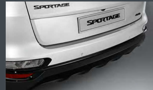
블랙 프론트 스킵드 플레이트 / 블랙 범퍼 가니쉬 블랙 리어 스킵드 플레이트 / 블랙 범퍼 가니쉬