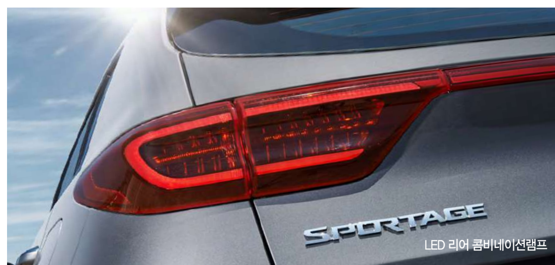
LED 리어 콤비네이션램프

스틸 그레이 (KLG) * 상기 사양구성은 트림, 엔진 및 선택 사양에 따라 다르게 적용됩니다.