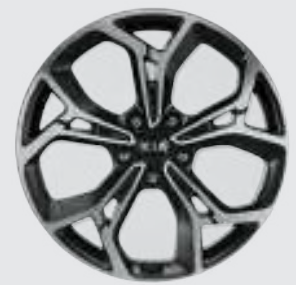
19인치 전면가공 휠