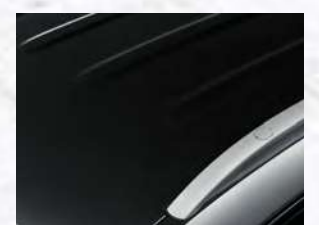
루프 스킨 (블랙)