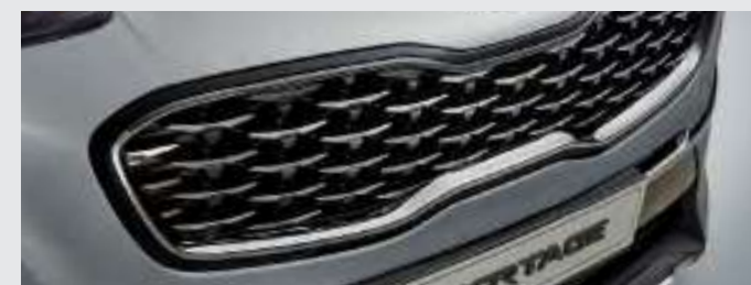
핫 스탬핑 라디에이터 그릴