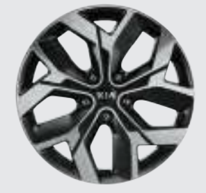
18인치 전면가공 휠