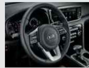
라운드 스티어링 휠