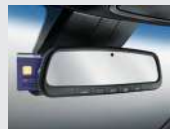
전자식 룸미러 (ECM, 하이패스 자동결제 시스템) * UV-C 사양 기준