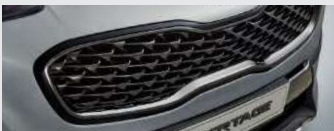
일반형 라디에이터 그릴