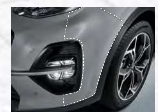
차량 보호 필름*