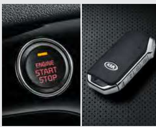
버튼시동 스마트키 시스템