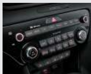
독립제어 풀오토 에어컨 (운전석/동승석)