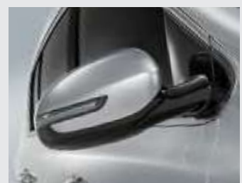
LED 리피터 일체형 아웃사이드미러