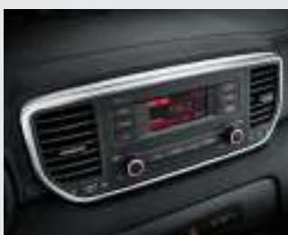
컴팩트 오디오 (MP3 재생)