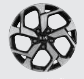
17인치 전면가공 휠