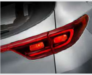
일반형 리어 콤비네이션램프