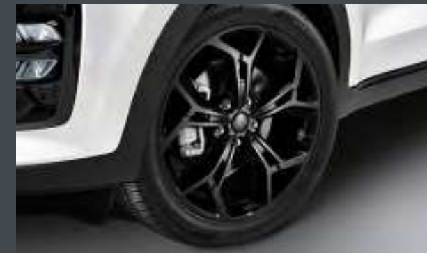
그래비티 전용 라디에이터 그릴 19인치 블랙 휠