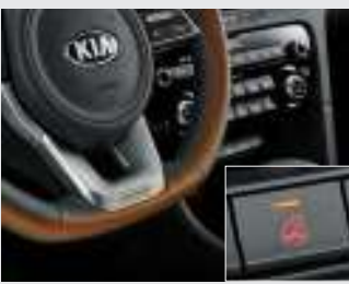
열선 스티어링 휠*