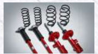
속업소버 & 스프링