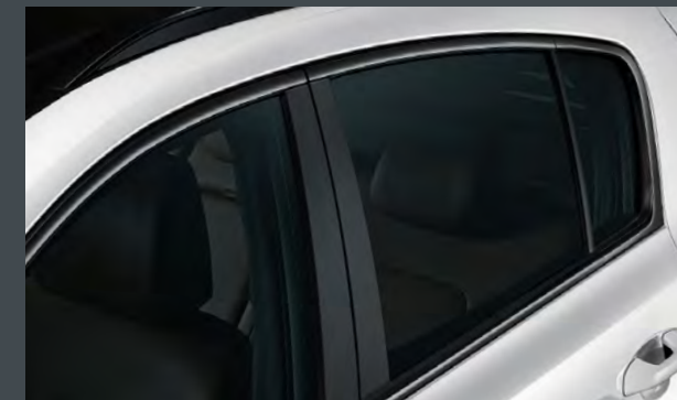
블랙 사이드실 몰딩 다크 크롬 서라운드 몰딩