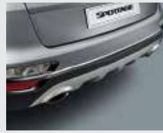
리어범퍼 머플러 가니쉬