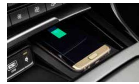
휴대폰 무선충전 시스템