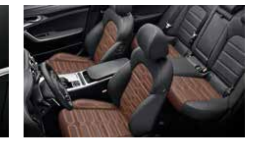
1, 2열 히트드 시트 *