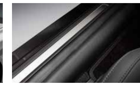
SUS 도어 스커프