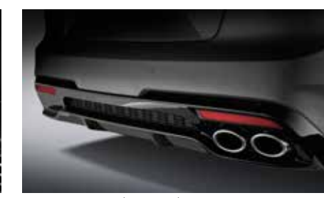
싱글 트윈 머플러 (디젤 전용)