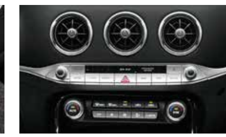
3존 에어컨 시스템