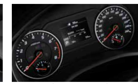
일반형 클러스터 (3.5인치 모노 TFT LCD)