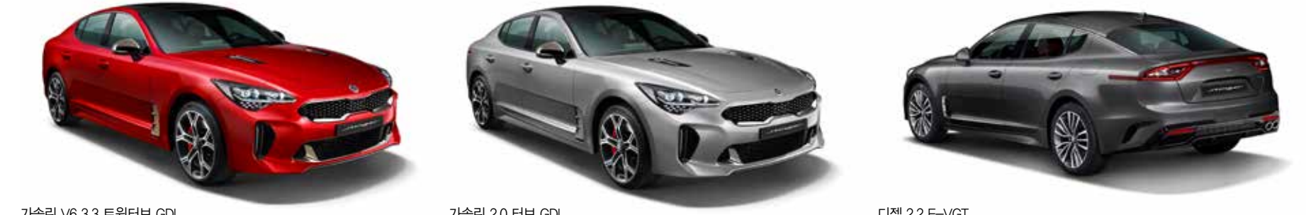
가솔린 V6 3.3 트윈터보 GDI