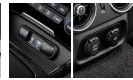
USB 충전기 & 뒷좌석 USB 충전 포트