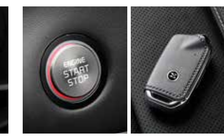
버튼시동 스마트키 시스템