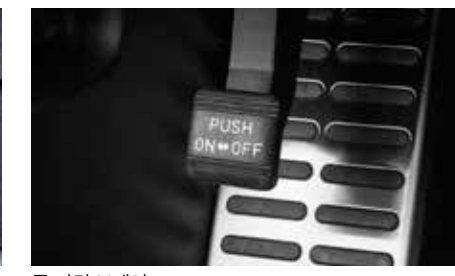
풋 파킹 브레이크