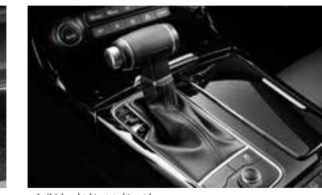
기계식 기어노브 (SBC)