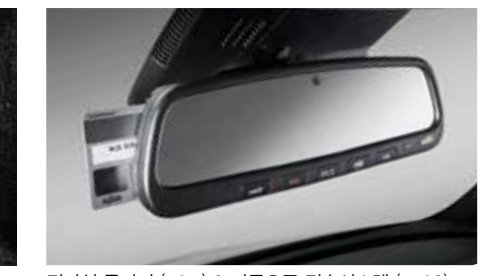
전자식 룸미러 (ECM) & 자동요금 징수시스템 (ETCS)