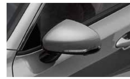
바디컬라 아웃사이드 미러