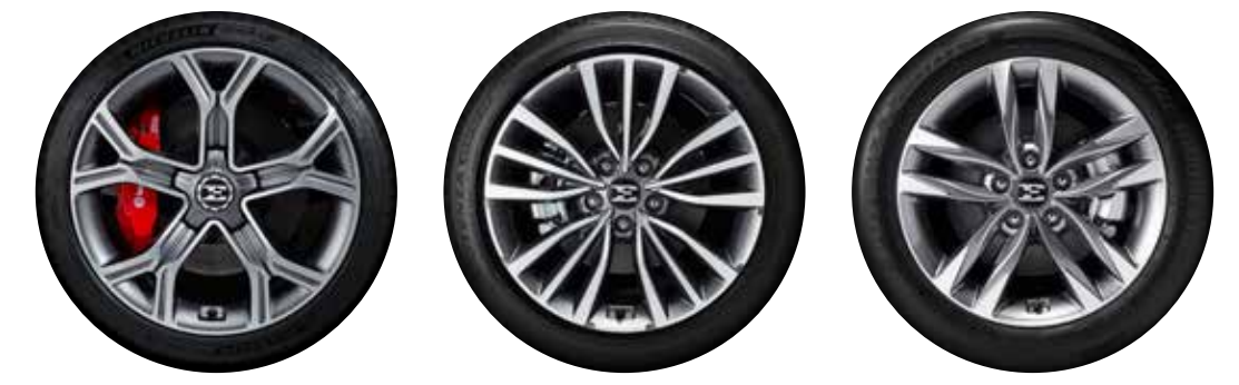
19인치 알로이 휠