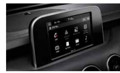
스마트 내비게이션 (7인치, 후방카메라)