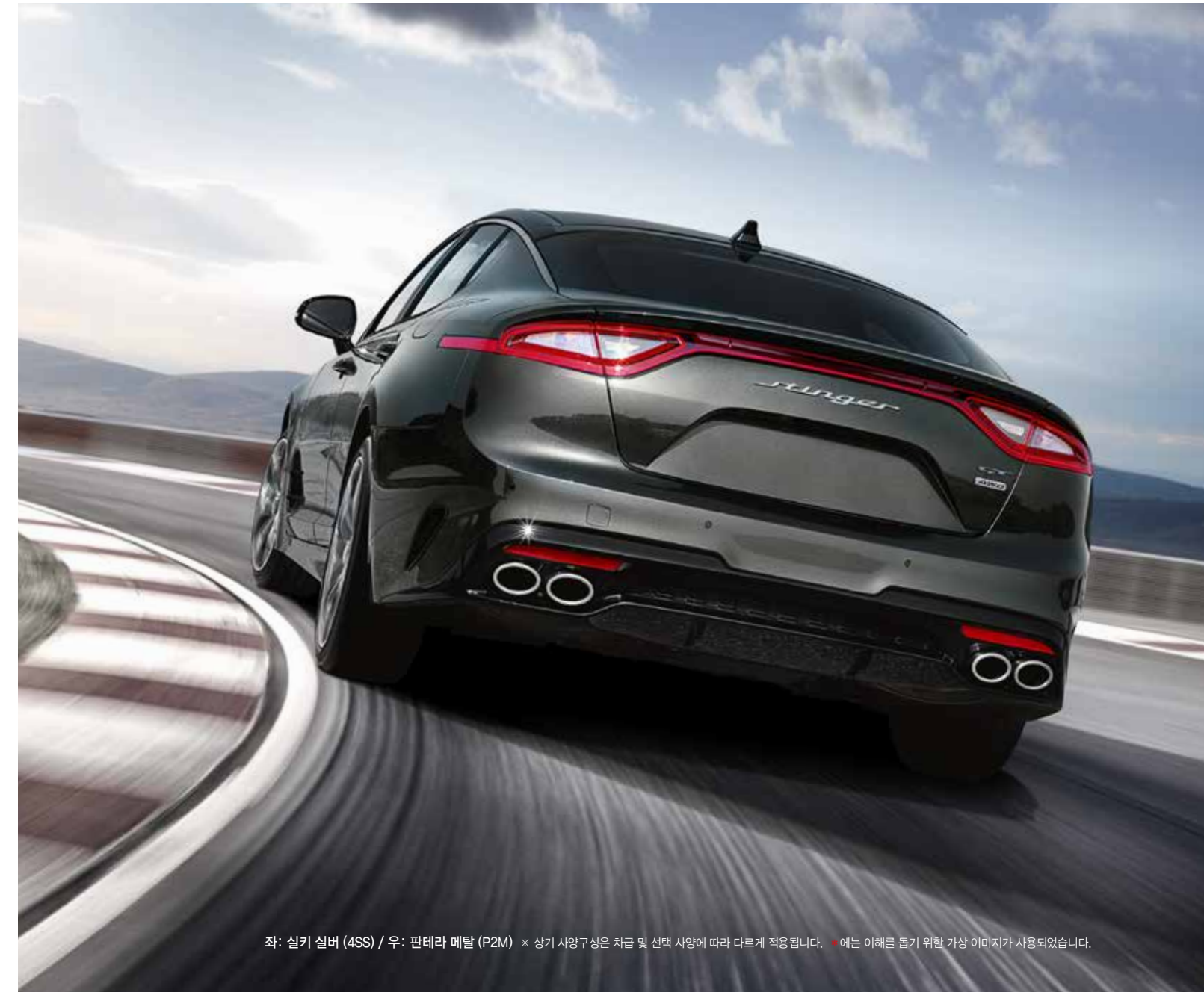
좌: 실키 실버 (4SS) / 우: 판테라 메탈 (P2M) * 상기 사양구성은 차급 및 선택 사양에 따라 다르게 적용됩니다. * 예는 이해를 돕기 위한 가상 이미지가 사용되었습니다.

[론치컨트롤]은 미숙련된 조작으로 인하여 차량 및 안전에 문제를 발생시킬 수 있으므로 전문 드라이버 이외에는 가능한 사용 자제를 권장드립니다. 사용시 준수사항: ① 론치컨트롤 적용 또는 시동후 파워트레인의 냉각 시간 확보가 반드시 필요합니다. [정속 (60km/h)으로 일반 주행후 재시도 필요] ② 론치컨트롤 모드 진입시 '가속 페달 및 브레이크 페달' 동시 조작후 반드시 4초 이내 출발해야 합니다.