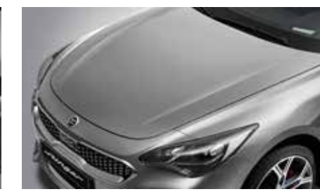
일반 후드 (가니쉬 미적용)