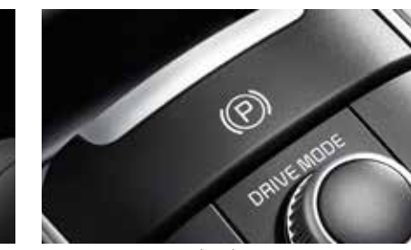
전자식 파킹 브레이크 (EPB)