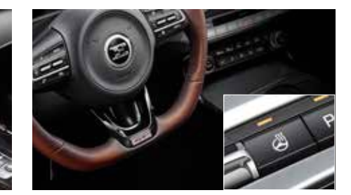
히트드 스티어링 휠 *