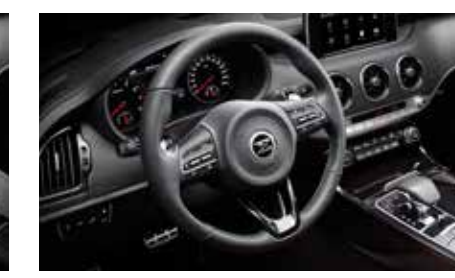
라운드 스티어링 휠