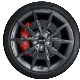
19인치 디자인 휠 (아크로 에디션 전용)

* 19인치 전면가공 휠과 디자인 휠 이미지의 브렘보 브레이크는 퍼포먼스 패키지 선택 시 적용