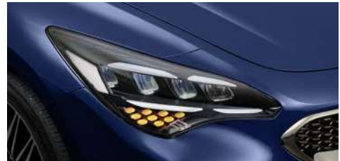
LED 헤드램프 & DRL

* 19인치 전면가공 휠과 디자인 휠 이미지의 브렘보 브레이크는 퍼포먼스 패키지 선택 시 적용