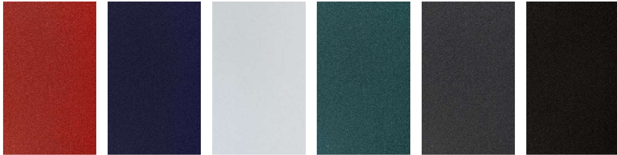
하이크로마 레드 (H4R) 딥크로마 블루 (D9B) 스노우 화이트 펠 (SWP) 애스코트 그린 (ACG) 판테라 메탈 (P2M) 오로라 블랙 펠 (ABP)