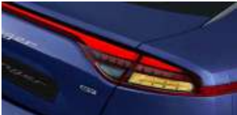
LED 리어 콤비네이션램프 & 벌브 턴시그널램프