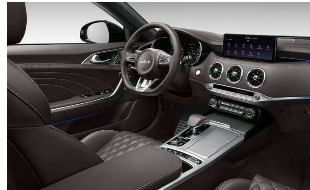
브라운 인테리어 (퀵팅 나파가죽)