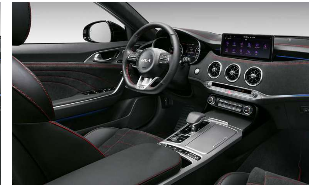
스웨이드 인테리어 (아크로 에디션 전용)