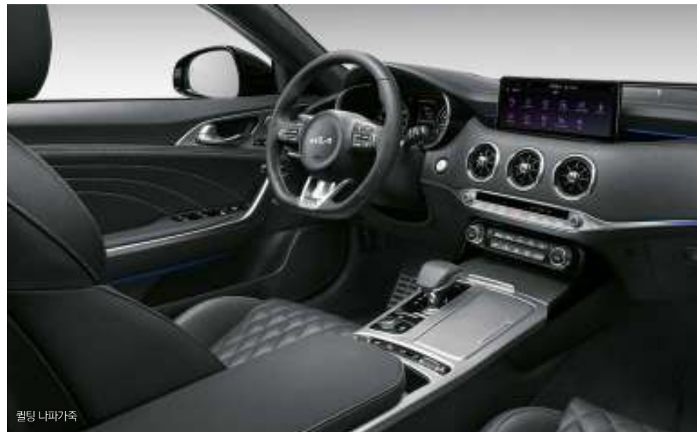
블랙 인테리어 (퀵팅 나파가죽/가죽) 상기 사양구성은 트림, 엔진 및 선택 사양에 따라 다르게 적용됩니다