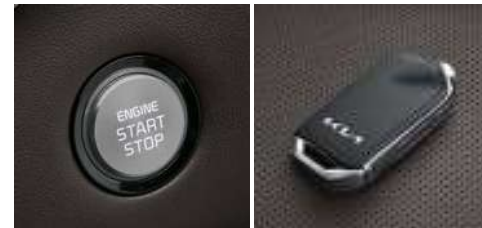
버튼시동 스마트키 시스템