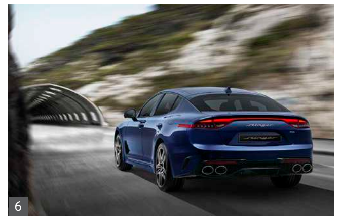
6 외부공기 유입방지 제어

내비게이션과 연동하여 차량의 터널 진입 및 비정정 예상 지역을 지날 때, 윈도우가 개방되어 있으면 자동으로 도어 윈도우를 닫아주며, 공조 시스템을 내기 순환 모드로 전환함으로써 쾌적한 실내 공기 유지에 도움을 드립니다. * 터널 연동 제어는 고속도로/자동차 전용도로 주행 상황에서 작동하며 50m 이하의 짧은 터널에서는 작동하지 않습니다.