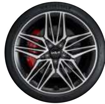
19인치 전면가공 휠