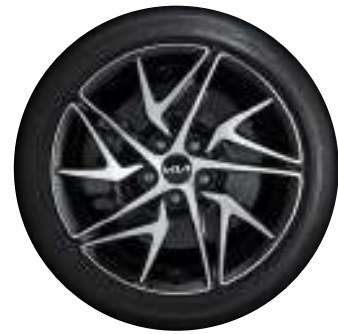
18인치 전면가공 휠