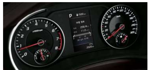
슈퍼비전 클러스터 (4.2인치 칼라 TFT LCD)