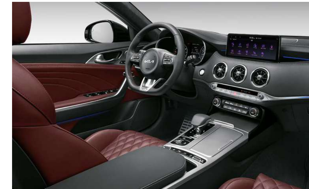
다크 레드 인테리어 (퀵팅 나파가죽)