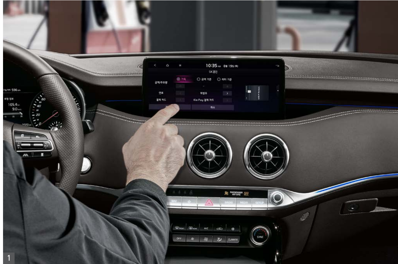
1 Kia Pay

Kia Pay 애플리케이션에 등록된 카드로 제휴 가맹점에서 내비게이션 화면 터치만으로 주유, 주차 요금 등을 결제할 수 있는 간편 결제 시스템입니다. * 가맹점은 향후 지속 확대 예정이며 실시간 가맹점 리스트는 내비게이션 및 Kia Pay 애플리케이션에서 확인 가능합니다.