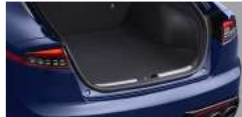
메탈 트랜스버스 트림