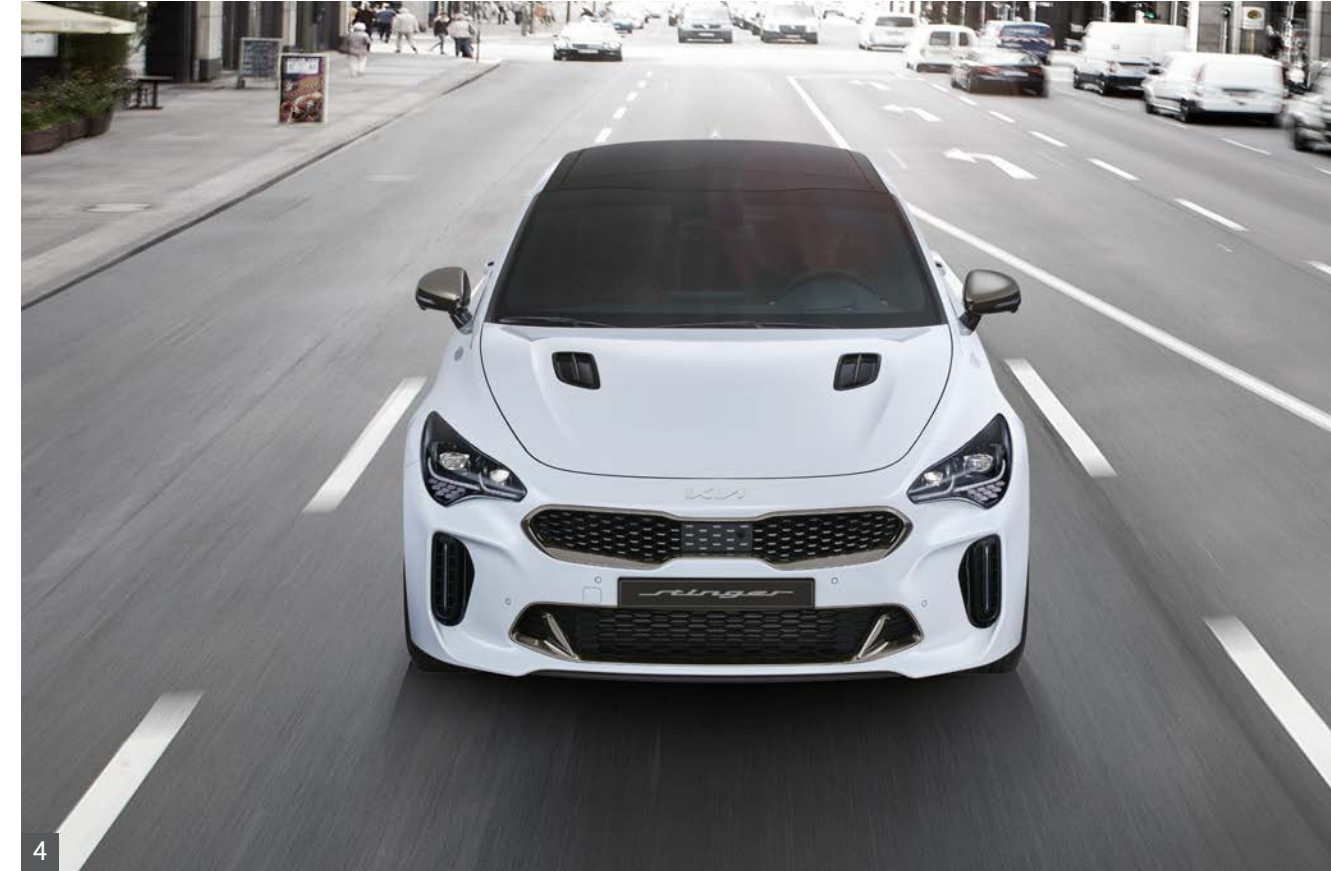
4 차로 유지 보조

고속도로/자동차 전용도로 주행 시 안전구간/곡선로 진입 전에 속도를 줄여주고, 안전구간/곡선로를 벗어나면 원래 설정한 속도로 주행합니다.