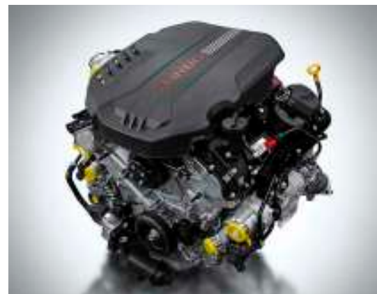
3.3 T-GDI 가솔린 엔진