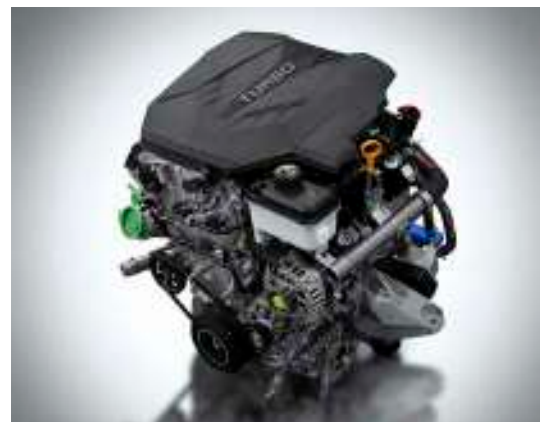
스마트스트림 G2.5 T-GDI 엔진

300마력 이상을 기본으로 탑재한 스마트스트림 G2.5 T-GDI 엔진, 3.3 T-GDI 가솔린 엔진으로 파워풀하고 과감한 주행성능을 제공합니다.