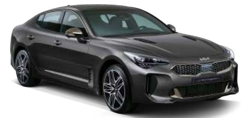
2.5 가솔린 터보