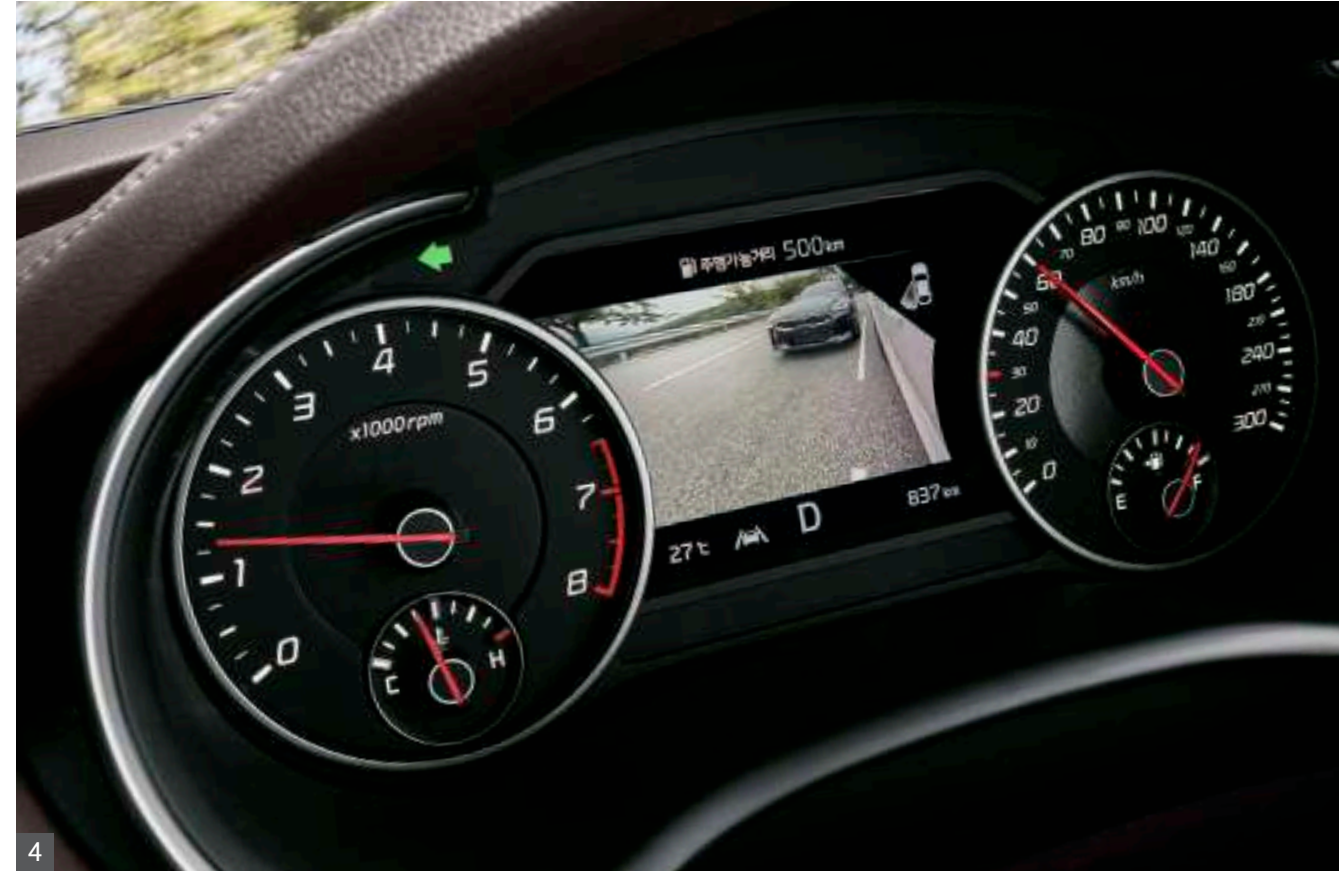
4 후측방 모니터

소프트웨어 버전 1. 업데이트로 HDA 기능을 활성화 할 수 도우며 내비게이션 커넥트 기능을 사용할 수 있습니다. 2. 내비게이션의 데이터베이스를 최신 버전으로 업데이트하는 것을 자동화합니다. * 업데이트는 2022년 4월 1일부터 시작되며, 업데이트를 진행하는 동안 내비게이션 화면이 잠금 상태에 유지될 수 있습니다.