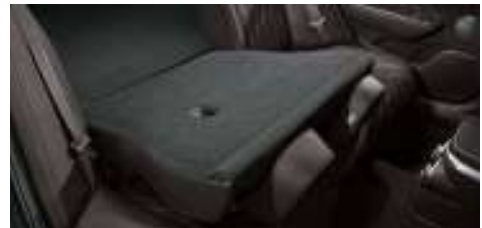
뒷좌석 6:4 폴딩시트