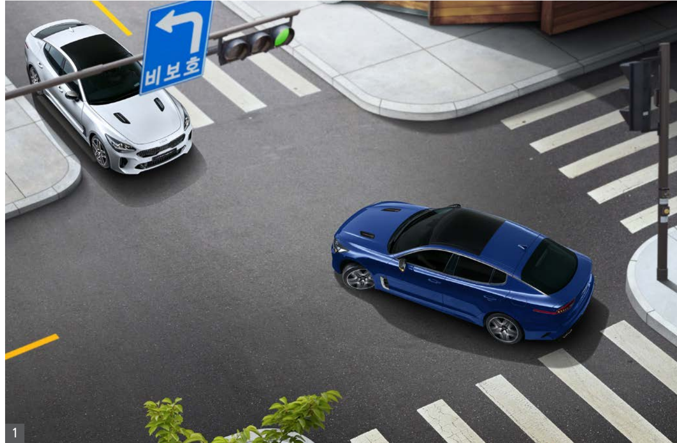
1 전방 충돌방지 보조 (교차로 대향차)

차량, 보행자, 자전거 탑승자 등 전방 충돌 위험이 감지될 경우 경고를 해주고, 경고 후에도 충돌 위험이 높아지면 자동으로 제동을 도와줍니다. 교차로에서 좌회전 시 맞은 편 차량의 차량과 충돌 위험이 발생하는 경우 자동으로 제동을 도와줍니다.