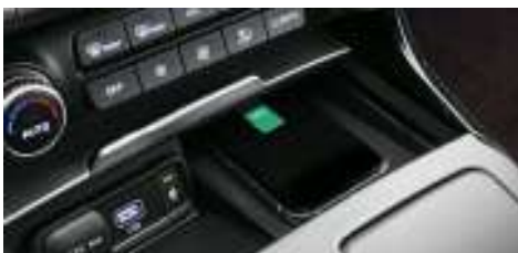
스마트폰 무선충전 시스템