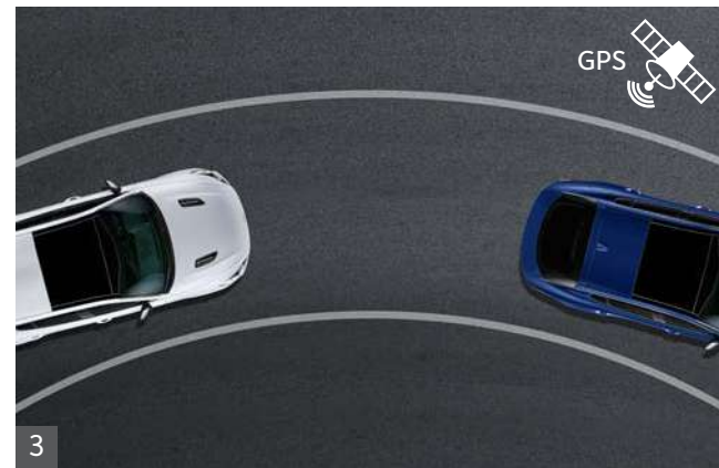
3 내비게이션 기반 스마트 크루즈 컨트롤* (고속도로/자동차 전용도로 내 안전구간/곡선로)

고속도로/자동차 전용도로 주행 시 안전구간/곡선로 진입 전에 속도를 줄여주고, 안전구간/곡선로를 벗어나면 원래 설정한 속도로 주행합니다.