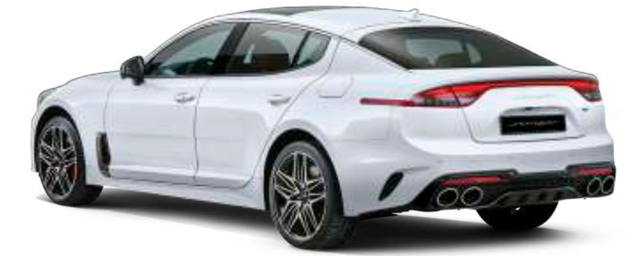
3.3 가솔린 터보