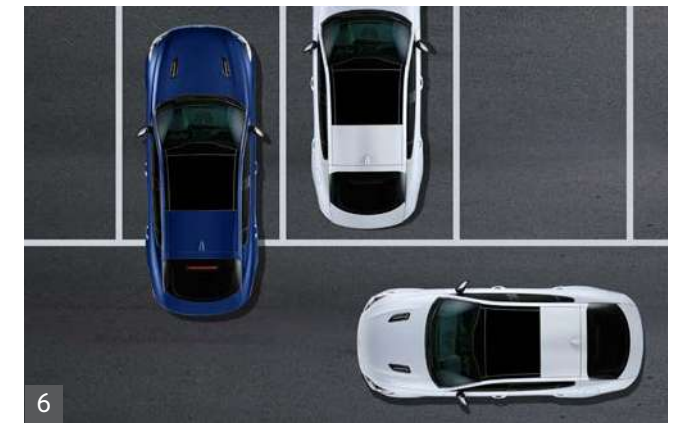
6 후방 교차 충돌방지 보조

후진 중 좌/우측의 충돌 위험이 감지되면 경고를 해주고, 경고 후에도 충돌 위험이 높아지면 자동으로 제동을 도와줍니다.