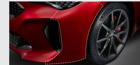
차량 보호 필름* 프론트/리어 범퍼 사이드, 도어 엣지, 도어 캡, 도어 스텝, 주유구 도어 부착