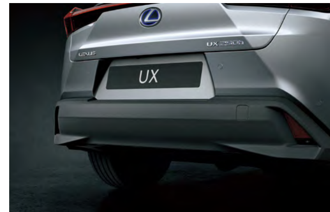
스핀들 그릴 테마를 적용한 후면 디자인 후면의 입체적인 벨트라인은 리어 콤비네이션 램프의 안쪽까지 연결되어, 가장자리에 위치한 머플러와 함께 스핀들 디자인을 완성하고 저중심 스탠스를 강조합니다.