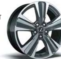
UX 300e 225/50R18 썸머 타이어