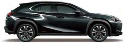
Graphite Black Glass Flake