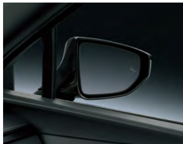
사이드 미러 투톤 컬러 디자인의 사이드 미러는 락 폴딩, 열선, 리버스틸트 등의 기능을 적용해 운전자에게 최상의 편의성을 제공합니다. (UX 250h AWD / F SPORT 사양) • UX 250h AWD / F SPORT : 락 폴딩, 열선, EC(운전석), 메모리, 리버스틸트 • UX 250h 2WD, UX 300e : 파워 폴딩, 열선