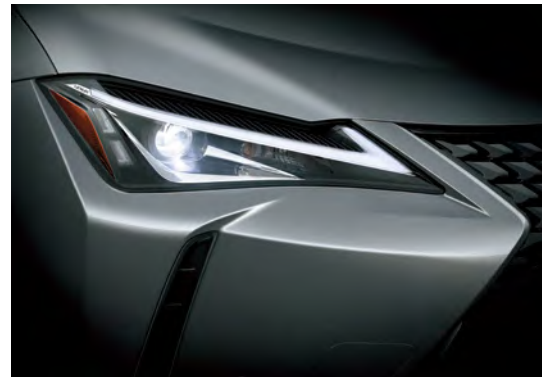
Bi-LED 헤드램프 날카로운 첫인상을 완성하는 Bi-LED 헤드램프는 에너지를 효율적으로 사용하면서도 향상된 시인성을 제공합니다. (UX 250h 2WD 사양)