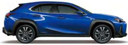
Heat Blue Contrast Layering (F SPORT 전용)