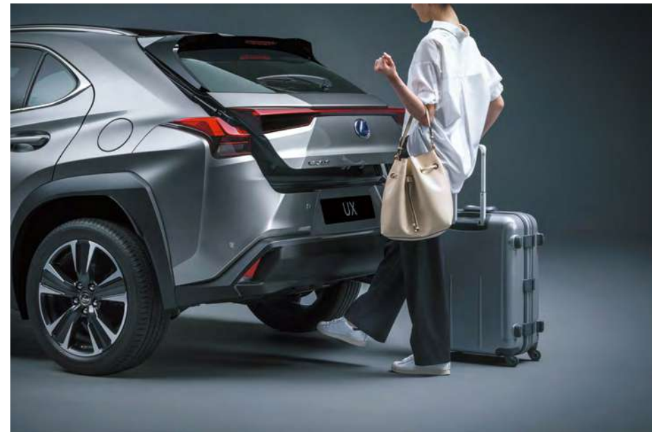
킥 오픈 파워 백도어 스마트 키를 소지하고 리어 범퍼 하단에서 킥 동작을 하면 자동으로 백도어가 열리는 첨단 편의 사양입니다. 무거운 짐을 들고 있을 때나 우천 시에도 편리한 차량 조작성이 가능합니다. (UX 250h AWD 사양)