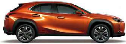
Blazing Carnelian Contrast Layering