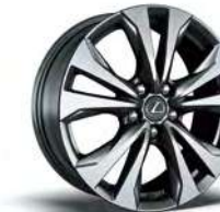
UX 250h F SPORT 225/50RF18 사계절 타이어 (런플랫)