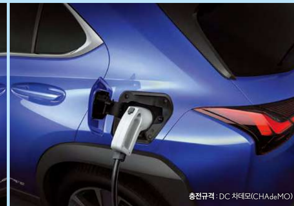
충전규격 : DC 차데모(CHAdeMO)