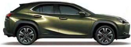
Terrane Khaki Mica Metallic