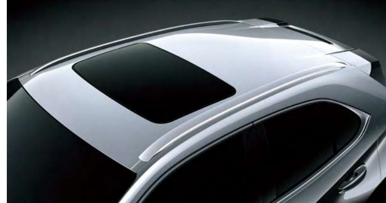
선루프 오버헤드 콘솔의 터치 한 번으로 손쉬운 틸팅과 개폐가 가능한 선루프는 실내 공간의 개방감을 더욱 향상시킵니다.