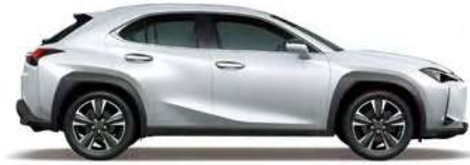
Sonic Quartz (F SPORT 제외)