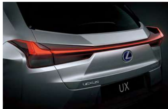
LED 리어 램프 예리하고 선명한 스핀들 형태를 모티프로 한 후면 디자인은 콤팩트 SUV 디자인의 정점입니다. 레이싱 카의 리어 윙에서 영감을 얻은 리어 콤비네이션 램프는 '에어로 라이트 블레이드' 콘셉트의 테일 램프의 중심을 따라 좌우를 연결하는 하나의 연속적인 선을 만들어 냅니다.