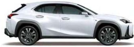
White Nova Glass Flake (F SPORT 전용)