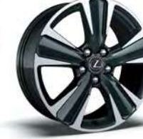
UX 250h AWD 225/50RF18 사계절 타이어 (런플랫)