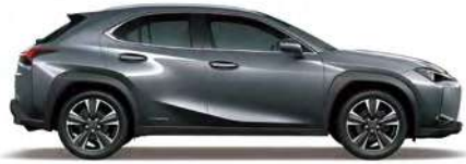
Mercury Gray Mica