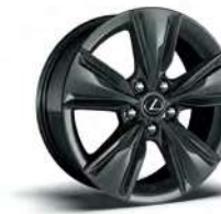
UX 250h 2WD 215/60R17 사계절 타이어