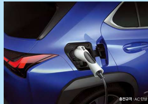
충전규격 : AC 단상