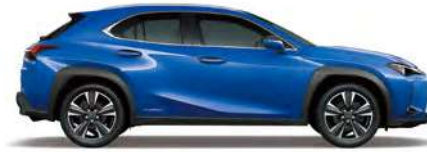
Celestial Blue Glass Flake