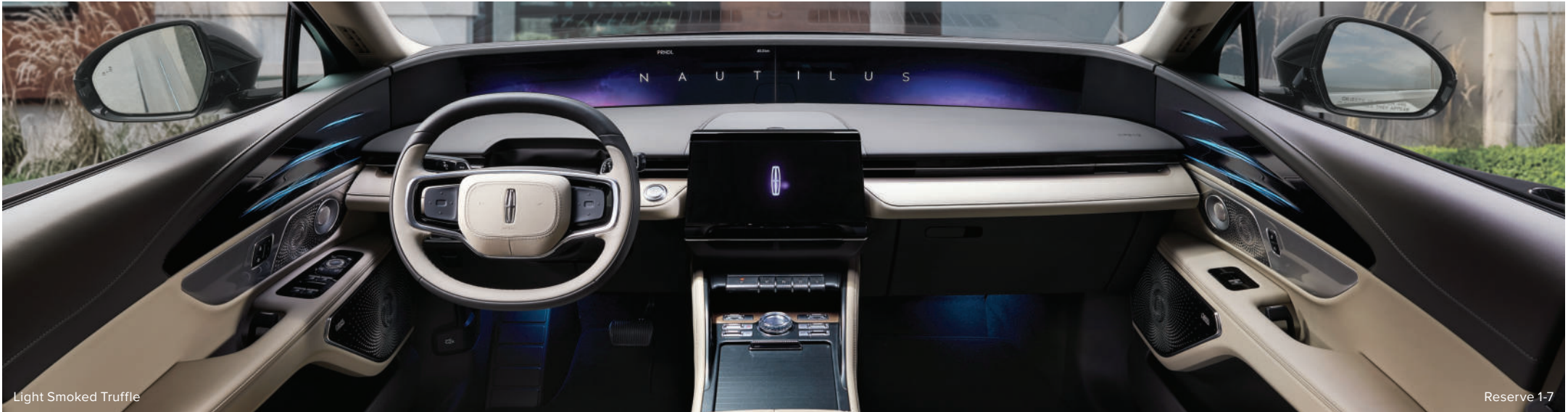
Light Smoked Truffle