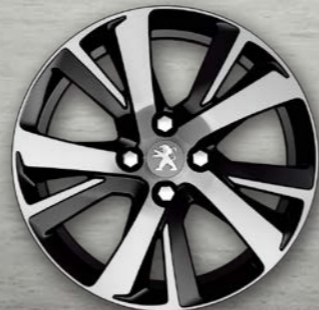
17" 'Eridan' Brilliant Black Alloy Wheel (GT Line 적용)

* 본 브로셔의 사진과 장비관련 정보는 판매되는 실차와 상이할 수 있습니다.