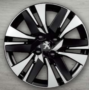
16" 'Aquila' Alloy Wheel (Allure 적용)