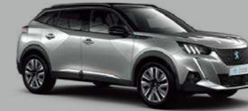
Cumulus Grey (M0F4)