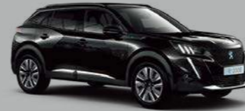
Onyx Black (P0XY)