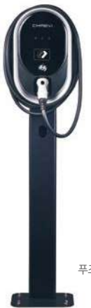
푸조 월박스 (스탠드)