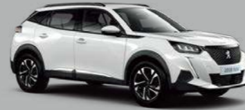
Bianca White (P0WP/EV 불가)

차량을 돋보이게 만들어주는 다양한 색상이 제공됩니다. 취향에 맞게 선택하세요.