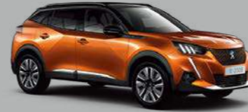
Orange Fusion (M02S)