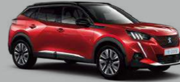
Elixir Red (M5VH)