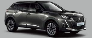
Nimbus Grey (M0VL/EV 불가)