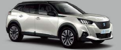
Pearlescent White (M6N9)