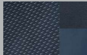
Tri-material 'Traxx' leather effect and 'Isabella' cloth seat (Allure)