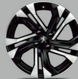
17" 'SALAMANCA' DIAMOND CUT ALLOY WHEELS