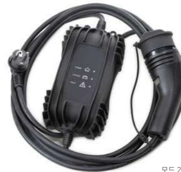
모드 2 케이블