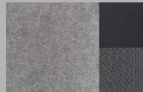
Tri-material grey Alcantara® and cloth seat trim (GT Line, Option(EV))