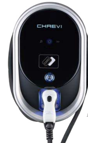
푸조 월박스 (벽걸이)