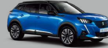
Vertigo Blue (M6SM)