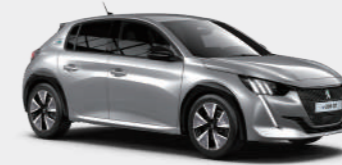
큐물러스 그레이 (Cumulus Grey)