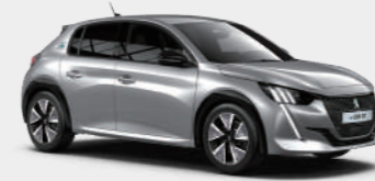
큐물러스 그레이 (Cumulus Grey)