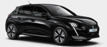
네라 블랙 (Nera Black)