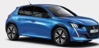
버티고 블루 (Vertigo Blue)