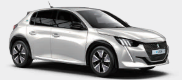
비앙카 화이트 (Bianca White)