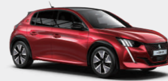
엘릭서 레드 (Elixir Red)