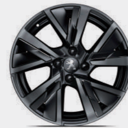
17" 'BRONX' Diamond Cut Two tone Alloy Wheels (GT)