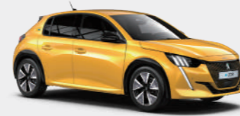
파로 옐로우 (Faro Yellow)