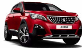
Ultimate Red (옵션)