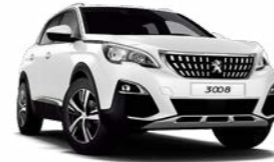
Bianca White (Allure 적용)