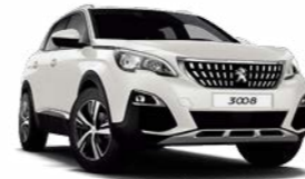
Pearl White (옵션)