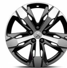
18" "LOS ANGELES" Diamond Alloy Wheels