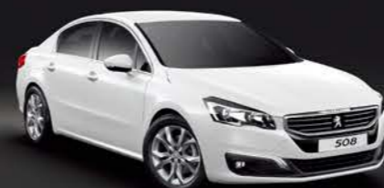
Pearl White (옵션)