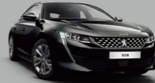
Nera Black (M09V)