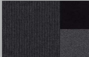
Mistral tri-material 'Imila' leather effect and 'Brumeo' cloth (Allure)