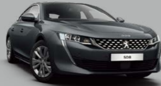
Hurricane Grey (P09G)