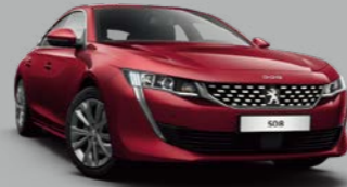
Ultimate Red (M5F3)