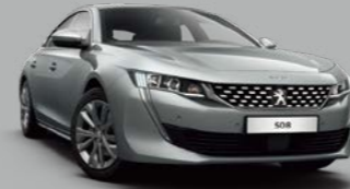
Cumulus Grey (M0F4)