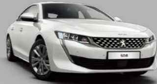
Pearlescent White (M6N9)