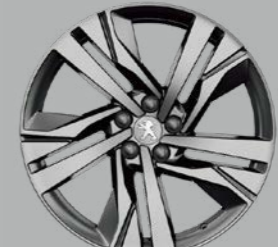
19" 'AUGUSTA' diamond-cut two tone (GT)