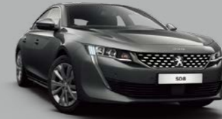
Nimbus Grey (M0VL)