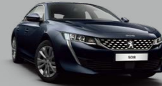
Twilight Blue (M0KU)