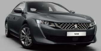
Celebos Blue (M0SY)