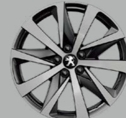
18" 'HIRONE' diamond-cut two tone with tinted varnish (GT Line)