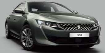
Amazonite Grey (M0KL)