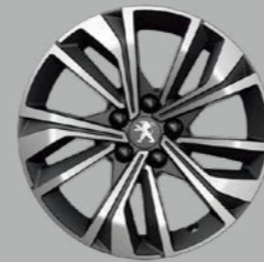
17" 'MERION' diamond-cut two tone (Allure)