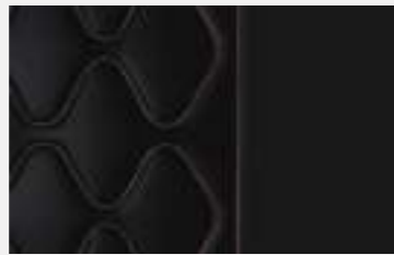
Nappa Mistral full grain leather (GT)