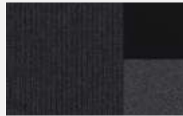
Mistral tri-material 'Imila' leather effect and 'Brumeo' cloth (Allure)