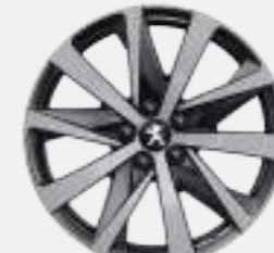
18" 'HIRONE' diamond-cut two tone with tinted varnish (GT)