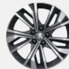
17" 'MERION' diamond-cut two tone (Allure)