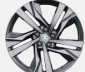
19" 'AUGUSTA' diamond-cut two tone (GT PACK)