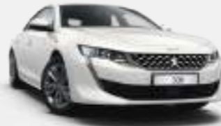
비앙카 화이트 (Bianca White)