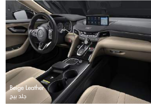
Beige Leather جلد بيح