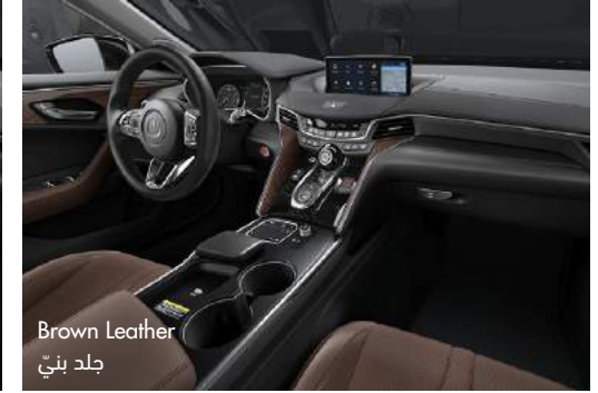
Brown Leather جلد بني