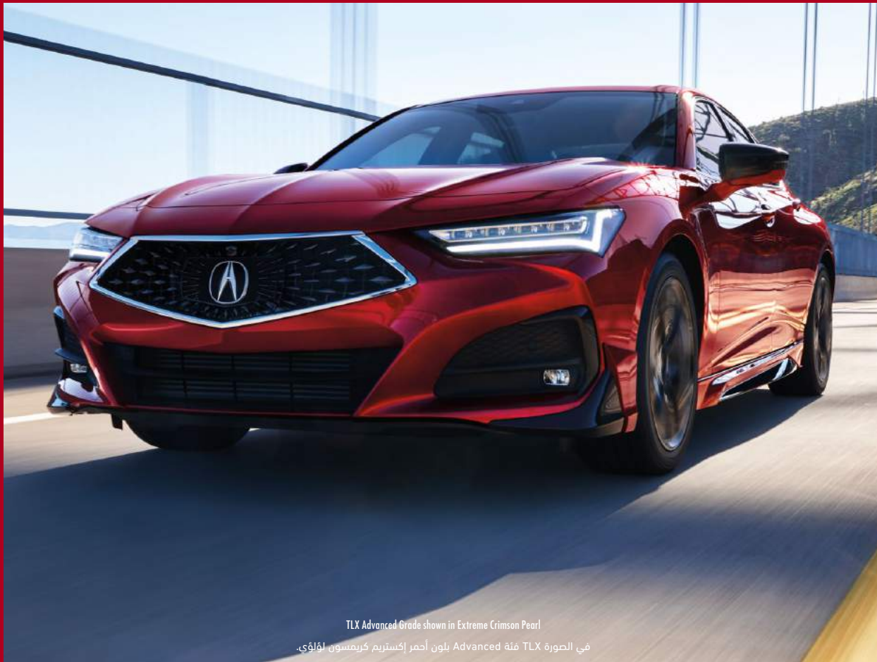
TLX Advanced Grade shown in Extreme Crimson Pearl في الصورة TLX فئة Advanced بلون أحمر إكستريم كريمنسون لؤلؤي.

The level of detail that goes into every Acura vehicle is rivaled only by the level of detail we put into Acura Genuine Accessories. From wheel locks, door trims, and cargo hooks to remote start and heated steering wheels, they're all designed by Acura and manufactured specifically for Acura.