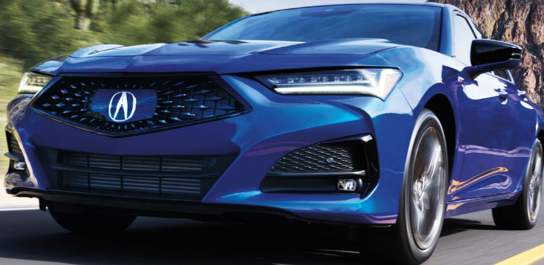
TLX Tech-A Grade shown in Signature Blue Pearl. في الصورة TLX فئة Tech-A بلون أزرق سيغناتشير لؤلؤي

تشدد الجماليات الرائعة لـ TLX المُعاد تصميمها على الطاقة التي تختزنها. تُبرز خطوط الجسم الحادة والوقوف المنخفضة والعريضة إطلالة قوية. في المقدمة من الأعلى، ينساب غطاء المحرك الطويل والمنحوت إلى الشبكة المتميّزة بفتحات خماسية الأضلاع على شكل ماسة والأضواء الأمامية من الجيل الجديد ذات المصابيح الأربعة، Jewel Eye® LED، التي تضيء خلال النهار. وعلى طول الجانب، تمتد نسب الأداء والخطوط الشفافة إلى الرفارف الخلفية العريضة، مما يضيف المزيد من القوة إلى وقفتها. لا تبرز هذه السيارة على الطريق فحسب، بل تختلف عن أي شيء آخر على الطريق.