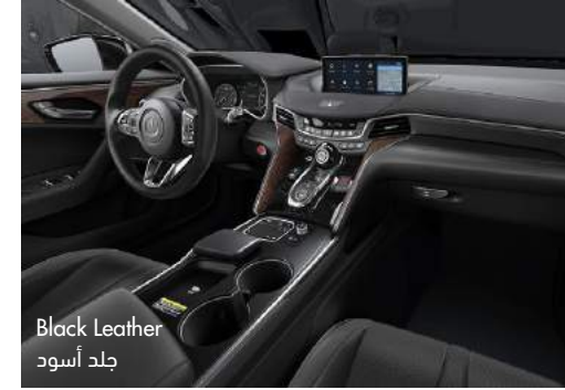
Black Leather جلد أسود