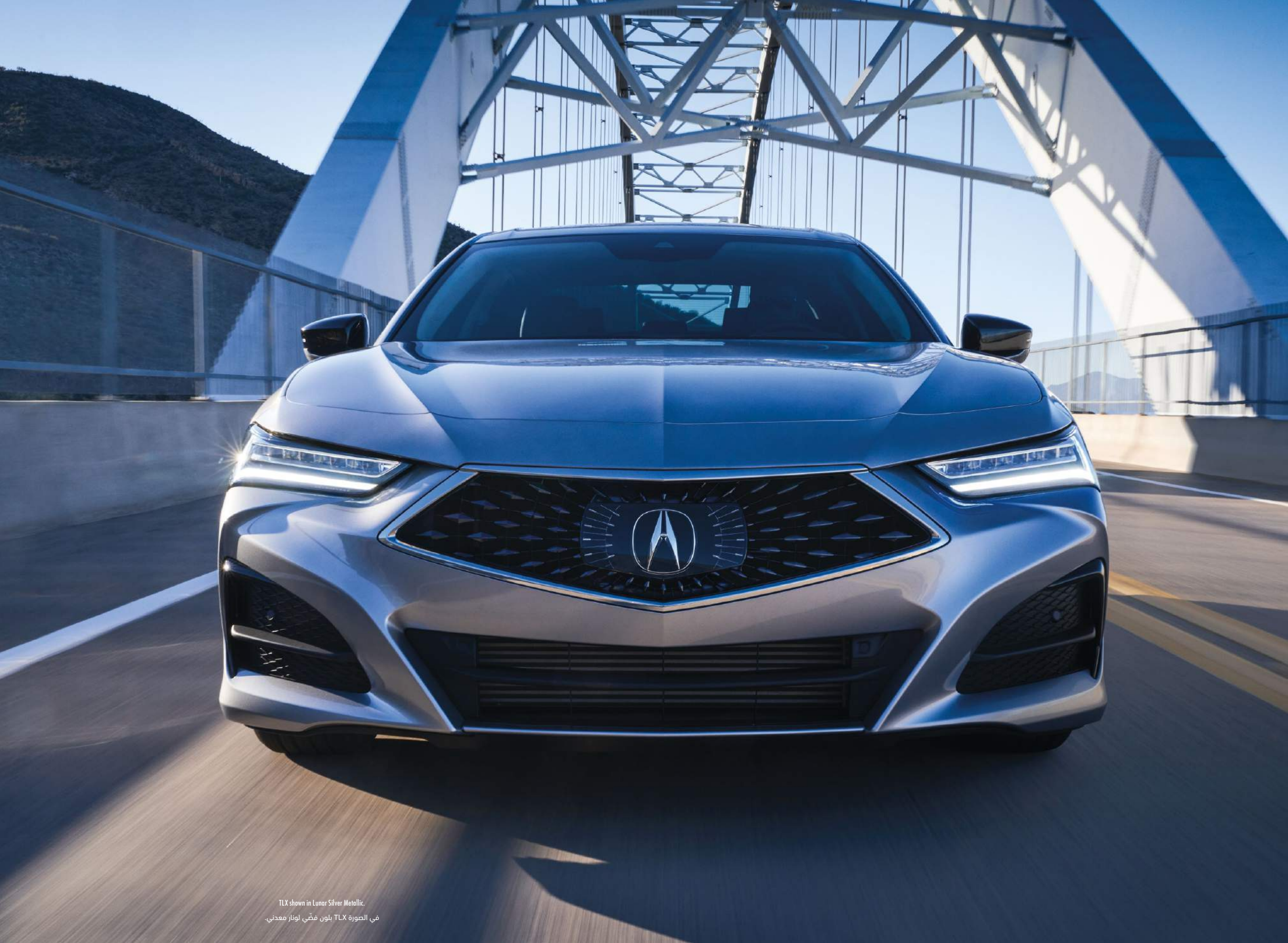
TLX shown in Lunar Silver Metallic. في الصورة TLX بلون فضي لونا معدني.