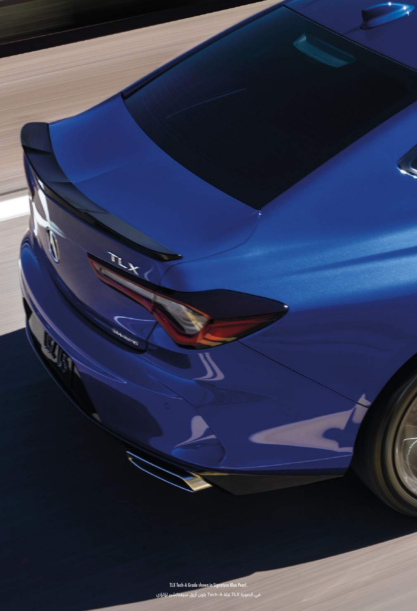
TLX Tech-A Grade shown in Signature Blue Pearl. في الصورة TLX فئة Tech-A بلون أزرق سيغناتشير لؤلؤي