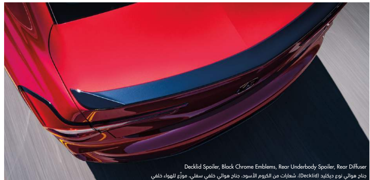
Decklid Spoiler, Black Chrome Emblems, Rear Underbody Spoiler, Rear Diffuser جناح هوائي نوع ديكليد (Decklid)، شعارات من الكروم الأسود، جناح هوائي خلفي سفلي، موّج للهواء خلفي