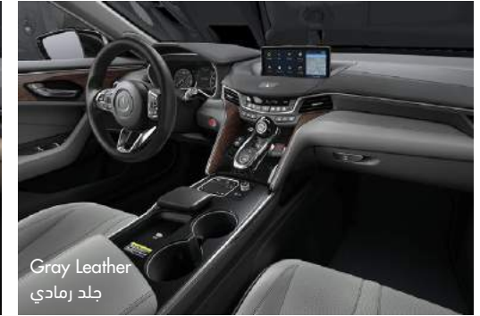
Gray Leather جلد رمادي