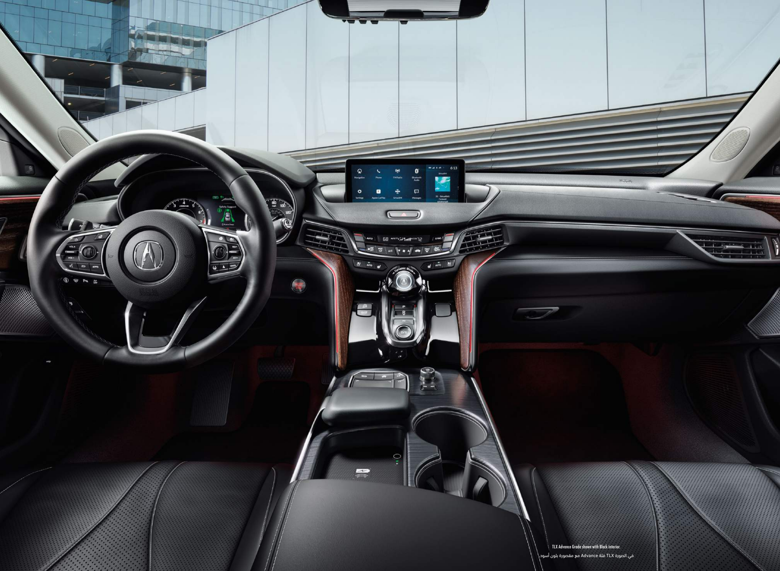
TLX Advance Grade shown with Black interior. في الصورة TLX فئة Advance مع مقصورة بلون أسود.