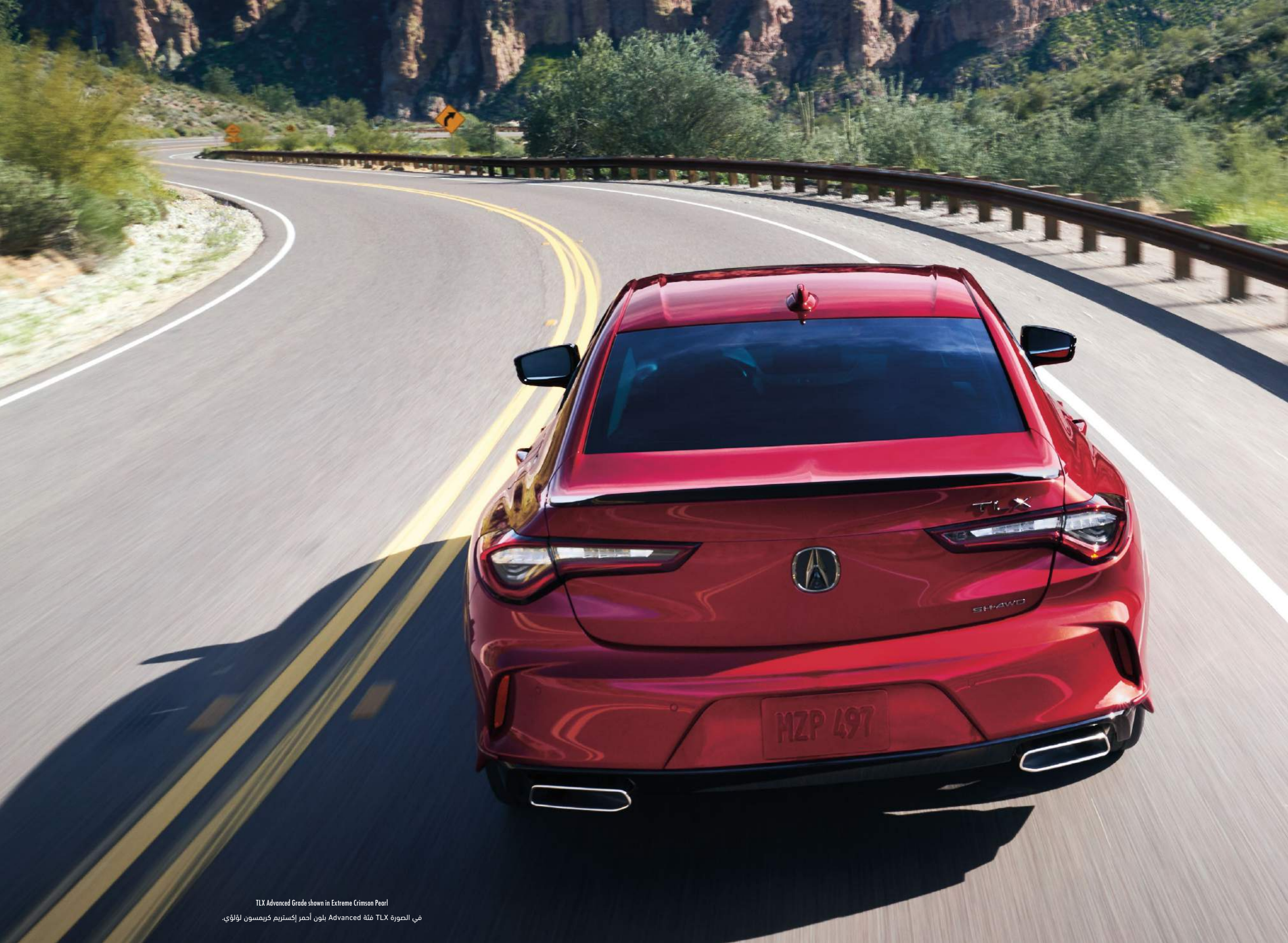
TLX Advanced Grade shown in Extreme Crimson Pearl في الصورة TLX فئة Advanced بلون أحمر إكستريم كريمةسون لؤلؤي.