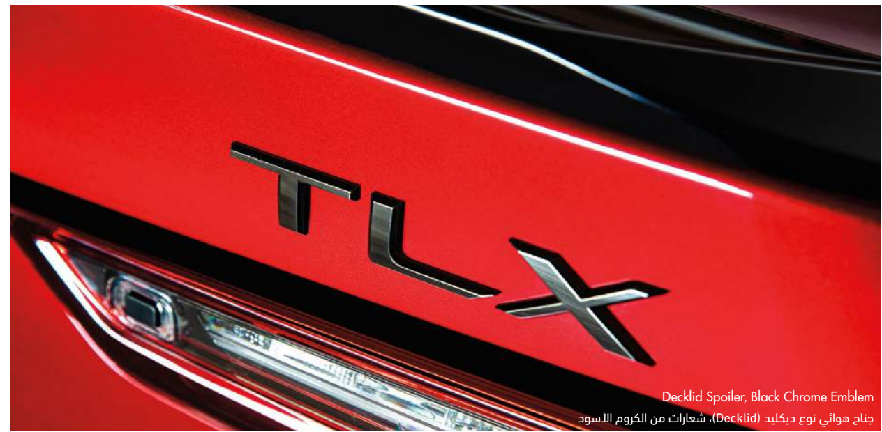
Decklid Spoiler, Black Chrome Emblem جناح هوائي نوع ديكليد (Decklid)، شعارات من الكروم الأسود

احصلوا على القائمة كاملة من خلال زيارة وكيل أكيورا أو موقع acura.com .