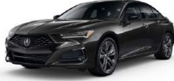
FATHOMLESS BLACK PEARL أسود فاخومليس لؤلؤي