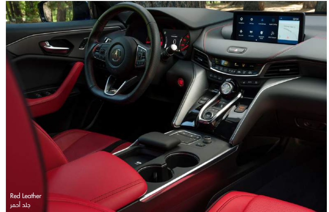
Red Leather جلد أحمر