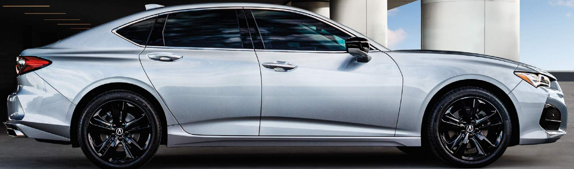
TLX shown in Lunar Silver Metallic.