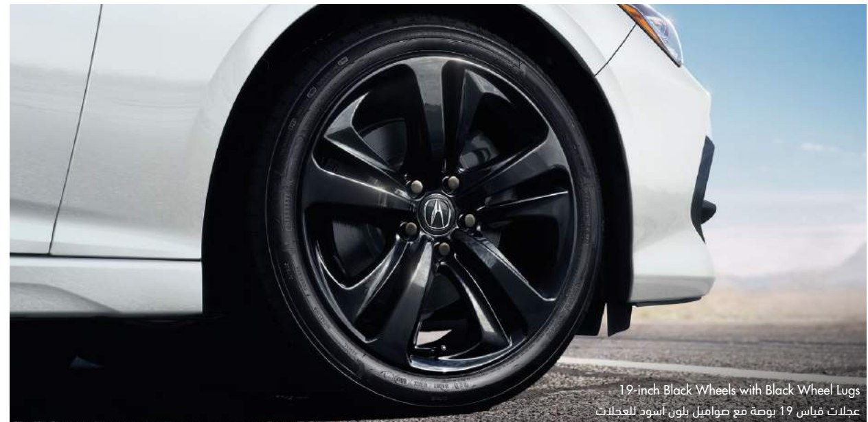
19-inch Black Wheels with Black Wheel Lugs عجلات قياس 19 بوصة مع صواميل بلون أسود للعجلات