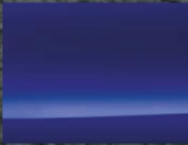
أزرق سديمي معدني <AXI>