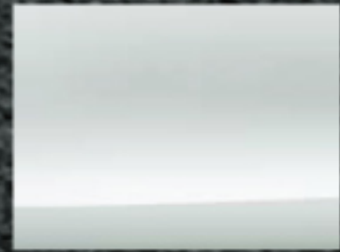
كريستال لؤلؤي أبيض لامع <VVO>