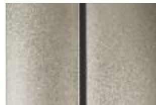
Бежевый (Beige Mativoire)