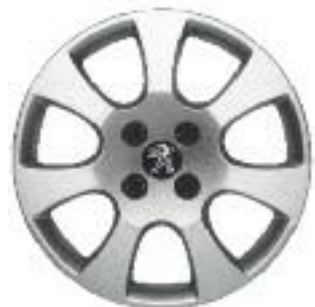
стальные диски с декоративными колпаками Toliman 16" (Access, Active)