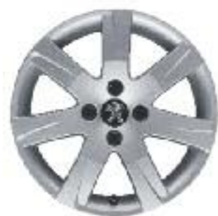
легкосплавные диски Santiagito 2 16" (Allure)