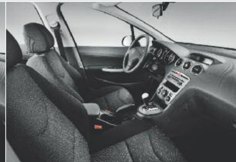
Active – Chilico Sibyak