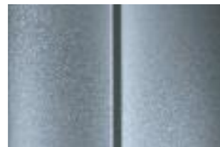
Серебристый (Gris Aluminium)