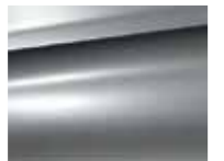
Grey Aluminium (M)