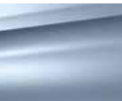
Blue Teles (M)