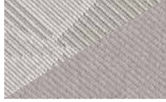
Birdy Lama Cloth/Sergor Lama Cloth