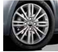
16" Boston alloy wheels