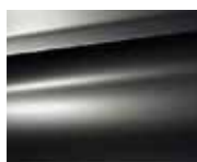
Grey Shark (M)