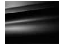
Black Onyx (O)