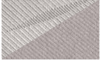
Waxe Lama Cloth/Sergor Lama Cloth