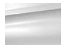
White Banquise (O)