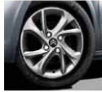
15" Tuorla alloy wheels