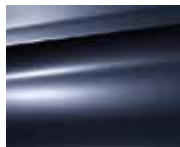
Blue Kyanos (M)