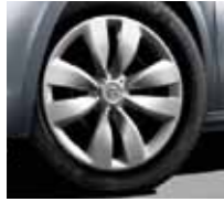
15" Asterodea hubcap