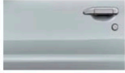
فضي (KY0) Silver (M) (KY0)