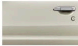
ذهبي فاتح (EY0) Light Gold (RPM) (EY0)