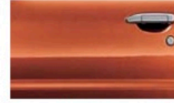
نحاسي سائل (R12) Brownish Orange (M) (R12)