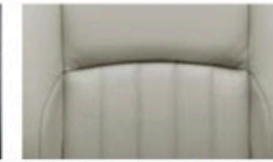
جلد (أكرو) Leather (Ecru)