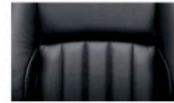
جلد (أسود) Leather (Black)