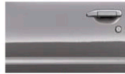
رمادي حديدي (K43) Iron Grey (M) (K43)