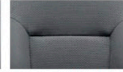
قماش (رمادي) Woven (Grey)