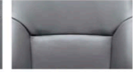
جلد بي في سي (رمادي) PVC (Grey)

(M): Metallic (P): Pearl (PM): Pearl Metallic (3P): 3-coat Pearl (RPM): Reflection Pearl Metallic