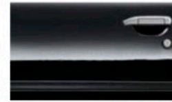
أسود (KH3) Black (KH3)