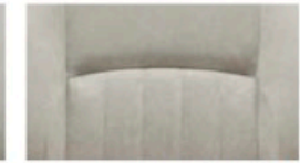
الكانترا (أكرو) Alcantara (Ecru)