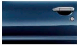
أزرق داكن (B31) Dark Blue (PM) (B31)