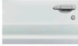
أبيض (QM1) White (QM1)