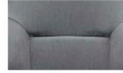
قماش سويد (رمادي) Suede-like tricot (Grey)