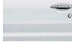
أبيض (QX1) White (3P) (QX1)