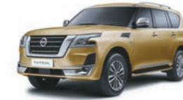
Gold Beige (HAJ) بيج ذهبي