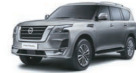
Metallic Slate (KAD) صخري حديدي