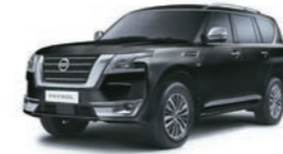
Black (KH3) أسود