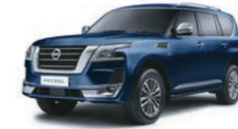
Hermosa Blue (BW5) أزرق محيطي