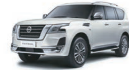
White Pearl (QAC) أبيض لؤلؤي