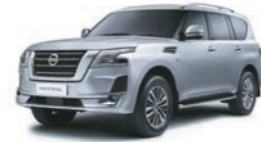
Silver (K23) فضي