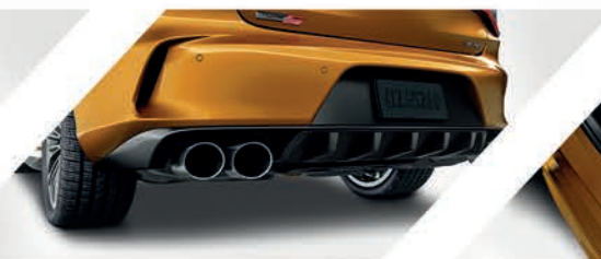
Difusor de fibra de carbono