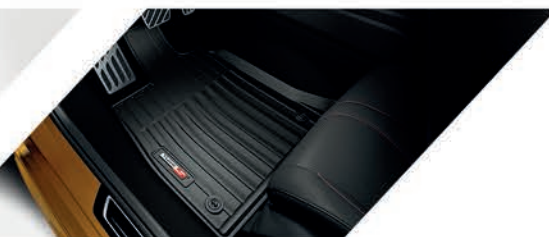
Tapetes toda temporada con logo Type S