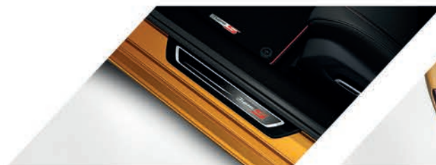
Adorno para piso de puerta iluminado con logo Type S