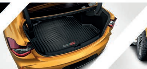
Bandeja de carga con logo Type S