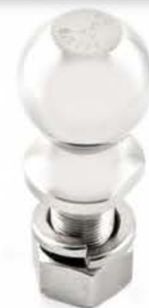
BOLA DE ARRASTRE