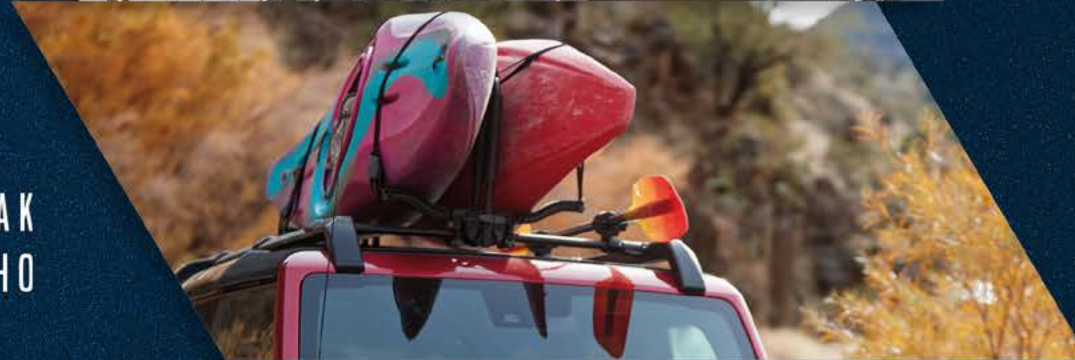
PORTA KAYAK DE TECHO