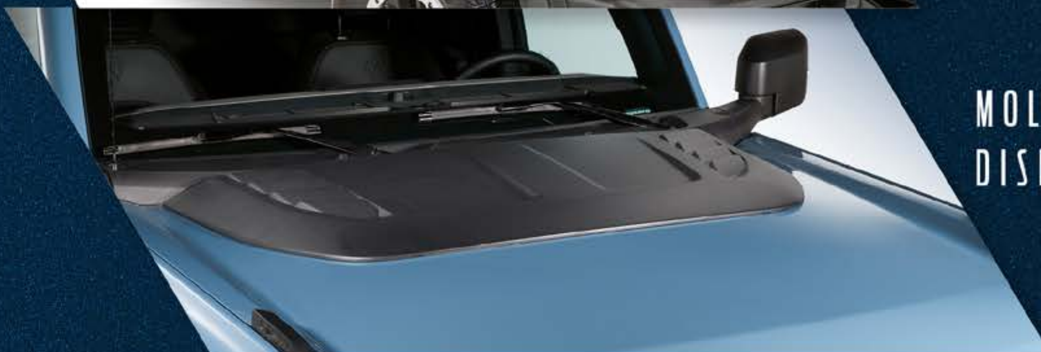
MOLDURA DECORATIVA CON DISEÑO DE TOMA DE AIRE