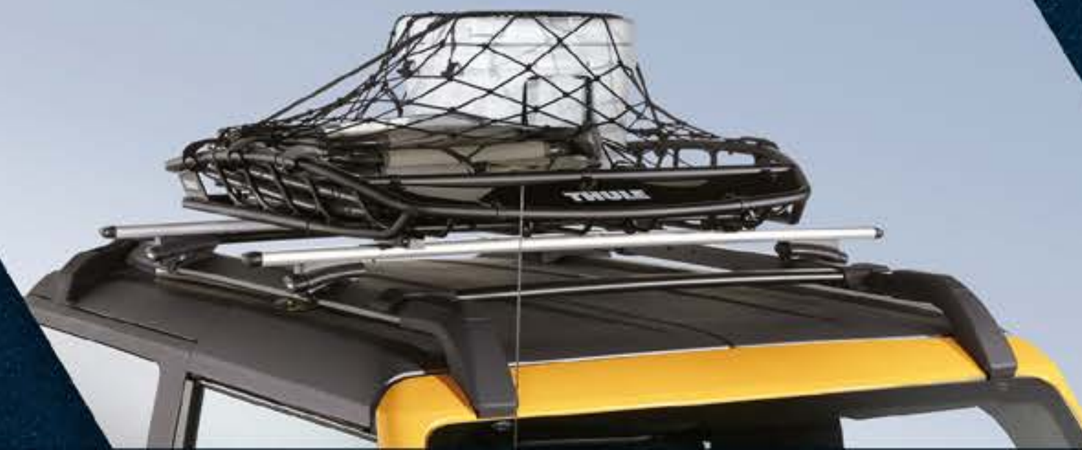
CANASTILLA DE CARGA CON RED

Las imágenes son meramente ilustrativas. Los accesorios mostrados en el presente catálogo pueden tener cambios posteriores a su publicación en: especificaciones técnicas, descripciones, números de parte, incorporación de opciones, requerimientos de ordenamiento o pudieran existir limitaciones de disponibilidad.