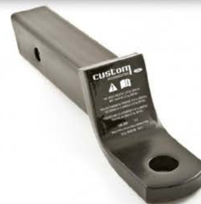
BARRA DE ARRASTRE

Las imágenes son meramente ilustrativas. Los accesorios mostrados en el presente catálogo pueden tener cambios posteriores a su publicación en: especificaciones técnicas, descripciones, números de parte, incorporación de opciones, requerimientos de ordenamiento o pudieran existir limitaciones de disponibilidad. Ford Motor Company se reserva el derecho de modificar en sus productos opciones de equipamiento y combinaciones de accesorios en cualquier momento, sin incurrir en responsabilidad alguna. Consulte a su Distribuidor Ford más cercano para obtener información actualizada.