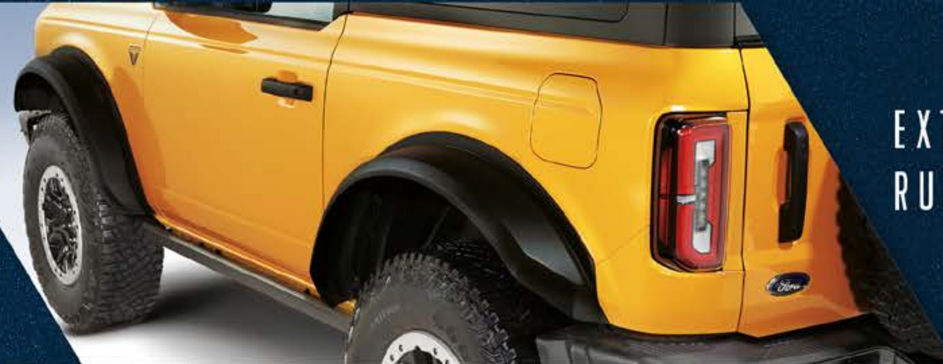
EXTENSIONES DE ARCOS DE RUEDA (FENDER FLARES)