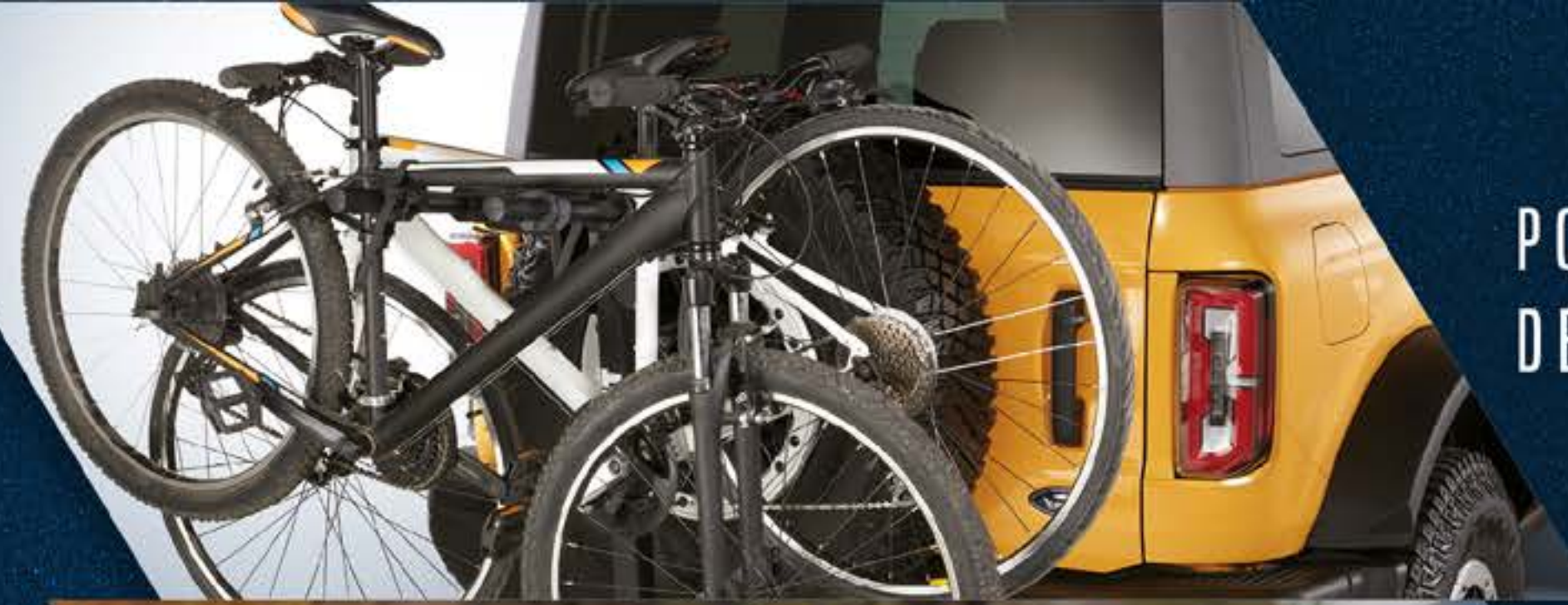
PORTABICICLETAS DE TIRÓN