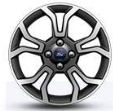
Rines de Aluminio de 17 Pulgadas